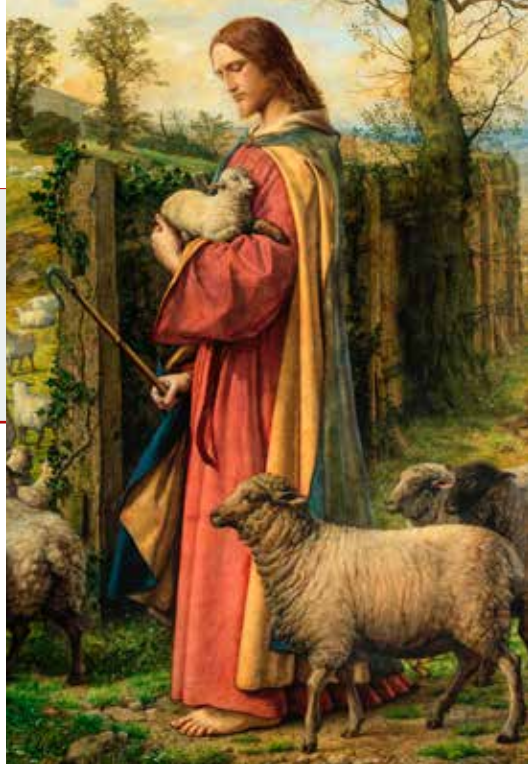
William Dyce, Isus – Dobri Pastir, 1857. – 1859.