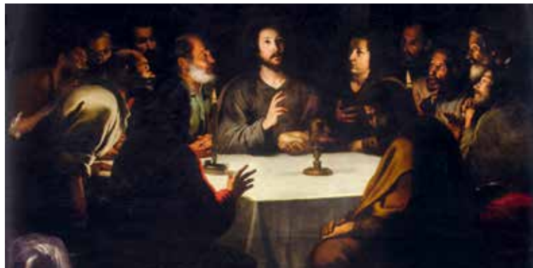
Bartolome Esteban Murillo, Posljednja večera , 1650.

Sakramenti su prema obrednoj strukturi najdjelotvornija actio jer u obredu Bog, djelovanjem Duha Svetoga, uvremenjuje na najstvarniji i najsnažniji način djelo spasenja. Nijedna druga aktivnost ili djelatnost Crkve ne može se usporediti sa snagom otajstvenog događanja u sakramentalnim slavljinama.