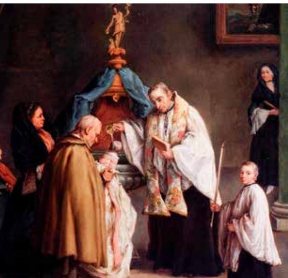
Pietro Longhi, Krštenje , 1755.

U krštenju vjera Crkve prethodi vjeri vjernikā koji su pozvani prionuti uz nju. Svaki puta kada Crkva slavi sakramente, ispovijeda vjeru primljenu od apostola.