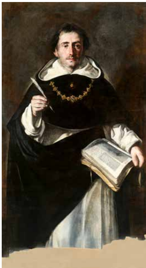
Antonio del Castillo y Saavedra, Sv. Toma Akvinski, 1649.

Sakramenti tvore međusobno povezanu cjelinu koja prati i oblikuje čitav kršćanski život. Upravo zbog te unutarnje povezanosti teologija govori o sakramentalnom organizmu, naglašavajući da svaki sakrament ima svoje posebno mjesto u životu vjernika i u izgradnji crkvene zajednice. Konstitucija Sacrosanctum Concilium podsjeća da je liturgija vrhunac prema kojemu teži djelovanje Crkve i ujedno izvor iz kojega proizlazi sva njezina snaga (SC 10). Sakramenti su stoga nerazdvojivo povezani s liturgijskim životom Crkve, jer upravo u liturgijskom slavlju vjernici sudjeluju u Kristovu spasenjskom djelu i primaju milost koja proizlazi iz njegova vazmenog otajstva. Unutar toga sakramentalnog organizma pojedini sakramenti imaju različite uloge u životu vjernika. Teološka