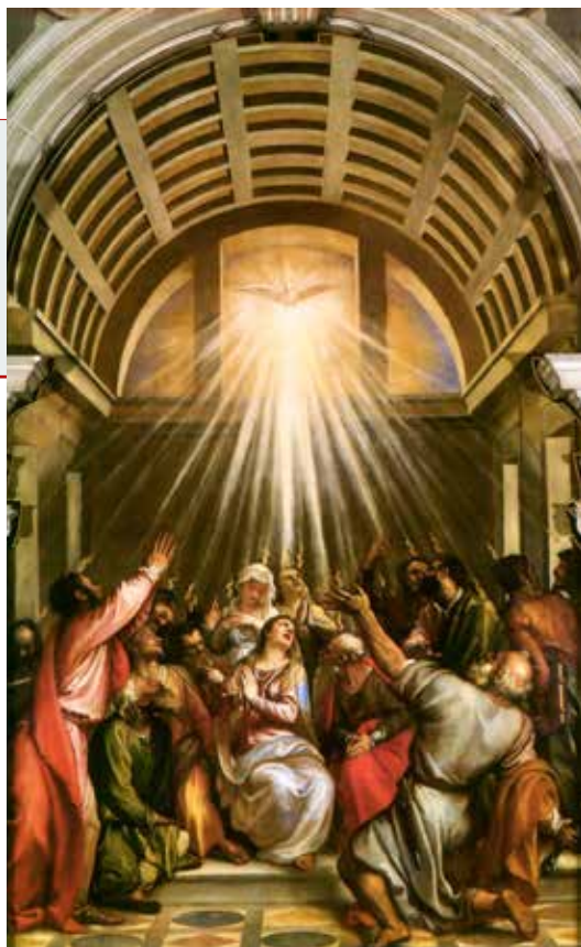
Tiziano Vecellio, Duh Sveti , 1545.