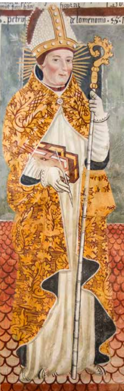
Nep. autor, Petar Lombardski , XV. st.

razvija i preciznija terminologija. Izraz sacramentum i dalje ima široko značenje, ali se sve jasnije prepoznaje posebno mjesto određenih liturgijskih slavlja u životu Crkve. Krštenje i euharistija ostaju temelji kršćanskoga života, dok se postupno oblikuju i drugi sakramentalni obredi. Teološka promišljanja sve više naglašavaju djelotvornost sakramenata: oni nisu samo spomen Kristova djela, nego mjesta u kojima Bog djeluje u životu vjernika i izgrađuje zajedništvo Crkve. Ovo razdoblje predstavlja prijelaz između patrističkoga iskustva i kasnije skolastičke sakramentologije, u kojemu se liturgijska praksa i teološko promišljanje sve snažnije prožimaju.