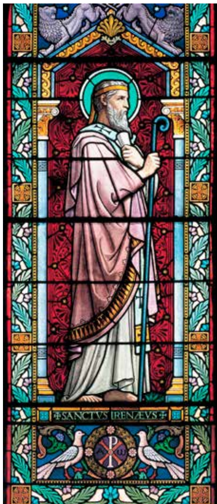
Lucien Bégule, Sv. Irenej Lyonski (vitraj u crkvi sv. Ireneja u Lyonu), 1901.

svijeta, radije se želi s Kristom sjediniti i nasititi se njime, negoli svim stvarima ovoga svijeta.