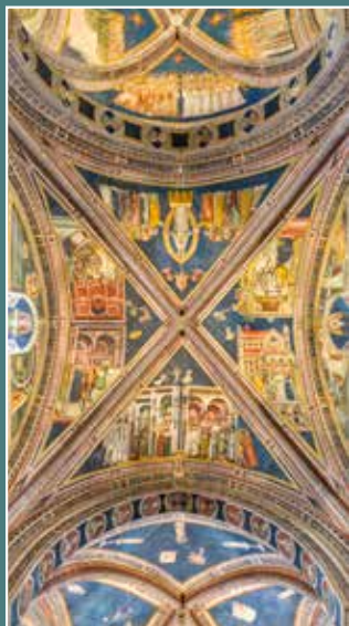
Nep. autor, Sedam sakramenata , XIII. st.