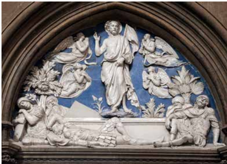
Luca della Robbia, Uskrsnuće , 1440.

Svi sakramenti, premda različiti po svojoj svrsi i strukturi, povezani su s istim otajstvom spasenja. U svakom od njih Crkva na poseban način sudjeluje u plodovima Kristova vazmenog djela: u krštenju se rađa novi život, u euharistiji se obnavlja zajedništvo s Kristom, dok drugi sakramenti prate vjernika na njegovu putu vjere i sudjelovanja u životu Crkve. Stoga se liturgijsko slavlje sakramenata može razumjeti kao način na koji Crkva sudjeluje u otajstvu Kristova vazma. U njima se ostvaruje susret između spasenjskog djela koje je Krist ostvario jednom zauvijek i života vjernika koji kroz sakramentalno slavlje ulaze u njegovu preobražavajuću snagu.