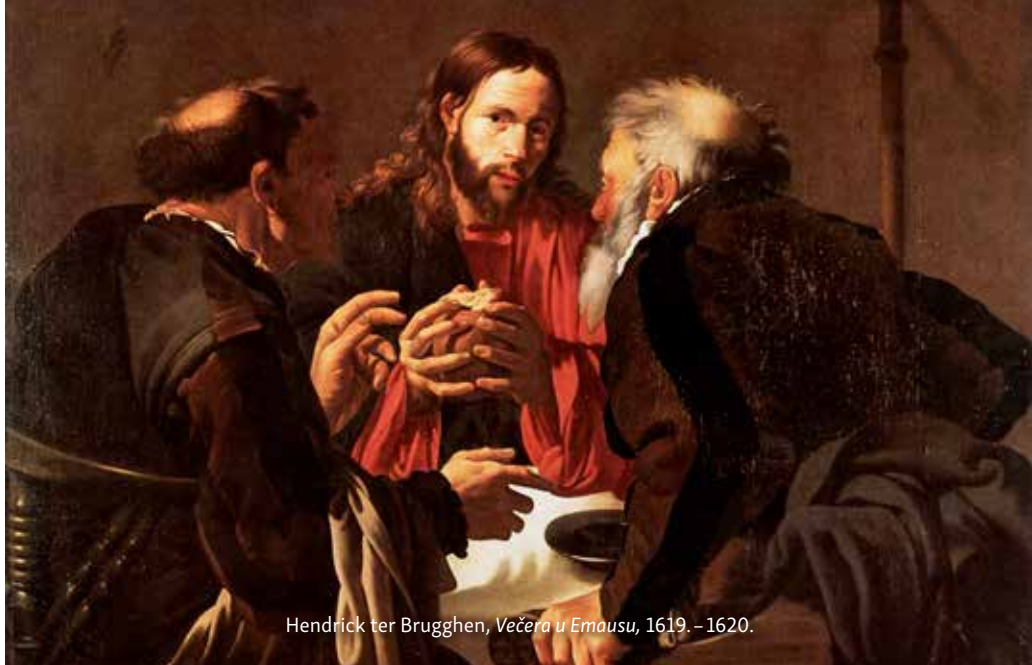
Hendrick ter Brugghen, Večera u Emausu , 1619. – 1620.

knjiga za razumijevanje naše zapadne kulture i kršćanske religije. To je ujedno i najčitanija knjiga u cijelom svijetu. Čak i danas vidimo kako likovi i priče iz Biblije mogu privući rekordnu gledanost u televizijskim programima. Ali postoji još jedan, daleko izazovniji način pristupa Bibliji, a to je vjerovati da ona sadrži živu Božju riječ za nas. Da je to »nadahnuta« knjiga, odnosno knjiga koju su napisali autori, sa svim svojim ograničenjima, ali uz izravnu Božju intervenciju. Vrlo ljudska i, istovremeno, božanska knjiga. Govori čovječanstvu svih vremena, otkrivajući smisao života i smrti. Iznad svega, otkriva Božju ljubav. Sv. Augustin je rekao: »Kad bi sve Biblije na svijetu bile uništene nekom kataklizmom, i ostao samo jedan primjerak, i ako bi od tog primjerka samo jedna stranica i jedan redak te stranice bili čitljivi; kad bi ovaj redak bio iz Prve Ivanove poslanice, gdje piše: »Bog je ljubav«, sve bi bilo spašeno. Jer ovdje je sažeto cijelo Pismo. To je ljubavno pismo koje je Bog poslao čovječanstvu.« To objašnjava zašto toliko ljudi pristupa Bibliji bez kulture, bez opsežnog proučavanja, s jednostavnošću, vjerujući da je Duh Sveti taj koji u njoj govori i da u njoj pronalaze odgovore na svoje probleme, svjetlo, ohrabrenje, jednom riječju, život. Isus je rekao: