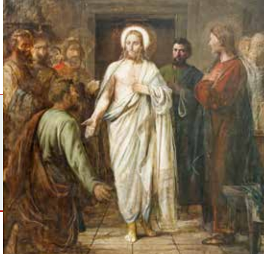
Wilhelm Marstrand, Tomina nevjera , 1870.