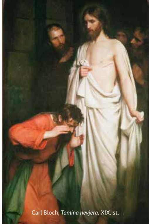
Carl Bloch, Tomina nevjera , XIX. st.

Najviše od svega modernoj je crkvi potrebno religiozno iskustvo susreta s uskrsnim Kristom, što se događa na nedjeljnoj euharistiji. Tada slušamo Isusa kako nam tumači pisma i primamo kruh života, što je njegovo tijelo koje nas hrani za život vječni.