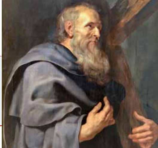
Peter Paul Rubens, Apostol Filip, oko 1611.