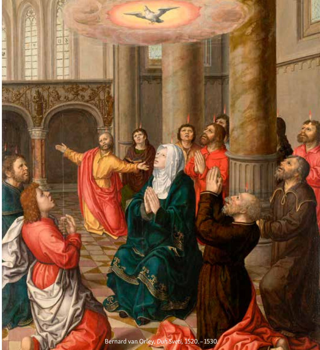
Bernard van Orley, Duh Sveti , 1520. – 1530.

mijeva čuvanje Kristovih zapovijedi. Upravo to proizlazi iz Isusovih riječi s početka i s kraja današnjeg odlomka evanđelja po Ivanu. Duh Sveti neće djelovati na način koji nema veze s Isusom, već upravo suprotno. On trajno oživotvoruje Kristov poziv na življenje onoga što je Isus živio i naviještao, a ključ i vrhunac njegovih zapovijedi je ljubav po uzoru na njegovu. Upravo bi to trebao biti glavni motiv i za ostvarivanje svih drugih zapovijedi kršćanskog pogleda na stvarnost. Zapravo, življenje svih drugih zapovijedi vrhunac ponovno dostiže u ljubavi. Djelovanje Duha uvijek je dakle djelovanje u vidu ostvarivanja kršćanske ljubavi i zato sve što bi se protivilo njoj u