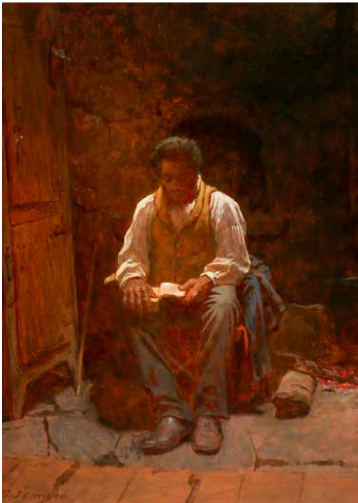
Eastman Johnson, Gospodin je pastir moj , 1863.

Osim toga, Isus koji je Dobri Pastir ukazuje na važnost osobnoga pristupa. Kao što pastir poznaje svoje stado i svoje ovce tako i Isus pristupa svakome osobno, svakoga poznaje i sa svakim ima strpljenja. Svatko mu je jednako vrijedan. Kao što pastir traži izgublenu ovcu nadajući se da će je pronaći i vratiti je na pravi put, tako Isus ide za svakim koji skrene sa pravoga puta i koji odluta od njega. Isus ne odstaje ni od koga, traži one koji su izgubljeni i strpljivo ih poziva i čeka da se vrate na pravi put. Upravo on je taj put prema nebeskom Ocu. On je onaj koji jamči sigurnost za svoje stado koje mu je povjereno kao Dobrome Pastiru.