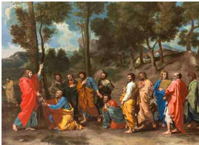
Nicolas Poussin, Sveti red , 1630.

U pastoralnoj praksi može se govoriti o krizi pojedinih sakramenata iz razloga što se ne doživljavaju kao slavlja cijele Crkve, nego kao tradicionalni obredi vezani uz različite životne etape bez dubljeg značenja za život vjernika. Slavlje euharistije naj snažniji je izraz zajedništva u kršćanskoj zajednici pa su svi sakramenti usmjereni prema euharistiji kao njihovom središtu. Krštenje je primjerice temelj i preduvjet za slavlje euharistije te je usmjereno na njezino prihvaćanje. Potvrda usavršuje vjernika za angažirano