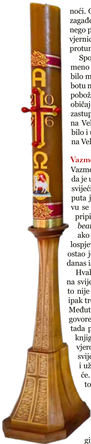
Vazmena svijeća od pravoga voska

noći. Ostaje istina da je danas u spomenutom »svjetlosnom zagađenju« simbolika Krista kao svjetlosti manje izražena nego prije više stoljeća. Međutim, ako neki simbol danas nije vjernicima toliko izražajan kao nekoć, potrebno ga je dodatno protumačiti.