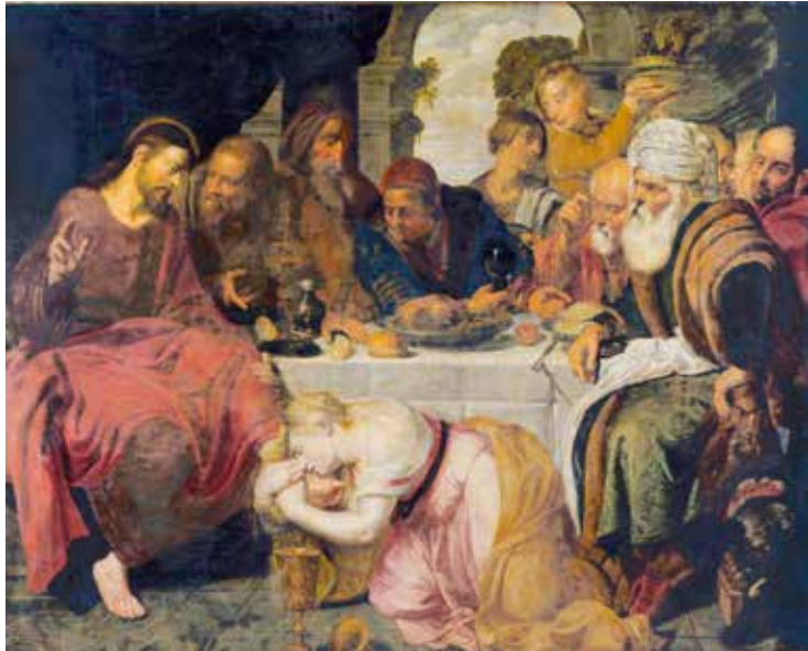
Artus Wolffort, Marija otire kosom Isusove noge , XVII. st.

Isus zatim izgovara riječ koja mijenja stvarnost: »Lazare, izlazi!« (Iv 1,43). To nije samo zapovijed mrtvacu; to je objava Božje moći stvaranja. Kao što je na početku svijet nastao po Božjoj riječi, tako sada novi život nastaje po toj istoj riječi. Bog ne govori u prazno — njegova riječ uvijek je djelo. Ona ne opisuje život, nego ga stvara.