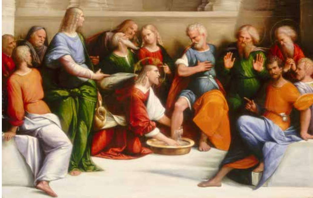
Benvenuto Tisi, Isus pere noge učenicima , 1520. – 1525.