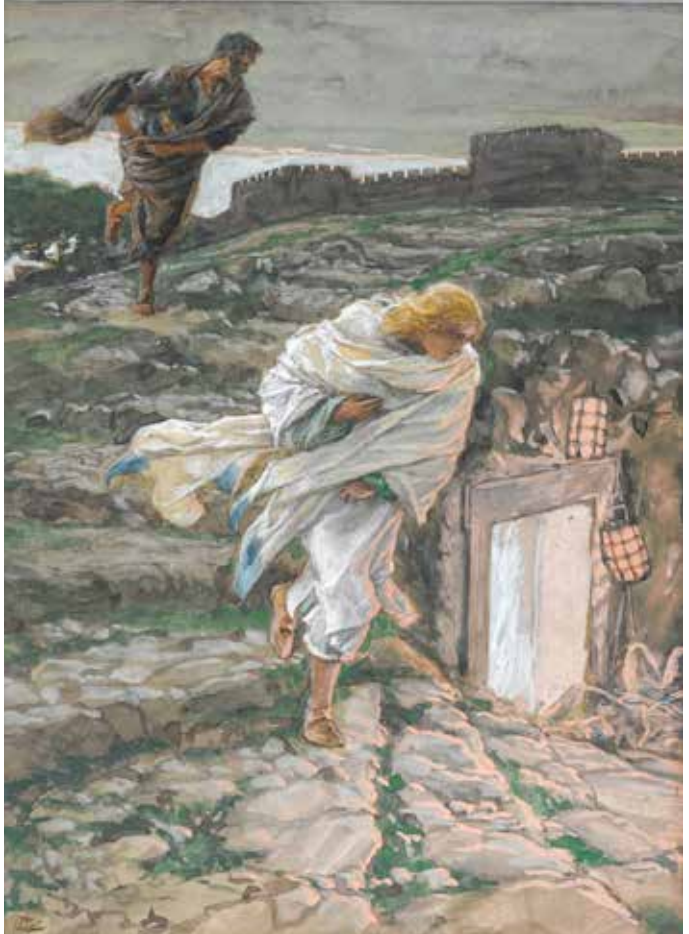
James Tissot, Petar i Ivan trče na grob , 1886. – 1894.

U evanđeoskom odlomku, nakon što su primili vijest o praznom grobu, Petar i drugi učenik, koji se obično poistovjećuje s Ivanom, kreću prema grobu. Trčanje izriče njihovu ljubav prema Isusu, onu ljubav koju će kasnije Petar triput morati potvrditi (usp. Iv 21,15-17). Nakon Petra u grob ulazi i onaj drugi učenik »i vidje i povjerova.« To je svrha kršćanskoga svjedočenja čiji je prvi uzor Marija Magdalena. Ovaj »drugi učenik« potrčao je na svjedočenje Marijino, želeći i svojim očima provjeriti sadržaj njezina svjedočanstva, premda ni sama Magdalena još nije vjerovala. Ivan je vidio isto što i Marija, no on je povjerovao. Evanđelist tumači: »Jer oni još ne upознаše Pisma da Isus treba da ustane od mrtvih.« Ivan je povjerovao i postaje svjedok pa i svoje Evanđelje piše kako bi svjedočio uskrsnu vjeru. Zato će u prvom zaključku njegova Evanđelja i pisati: »Isus je pred svojim učenicima učinio i mnoga druga znamenja koja nisu zapisana u ovoj knjizi. A ova su zapisana da vjerujete: Isus je Krist, Sin Božji, i da vjerujući imate život u imenu njegovu« (31-20,30). To je smisao Kristova uskrsnuća. Naglašavanje, da učenici još nisu upoznali Pisma, može