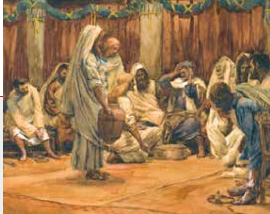
James Tissot, Isus pere noge učenicima, 1886. – 1894.