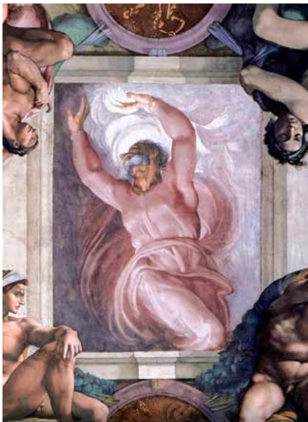
Michelangelo Buonarroti, Odvajanje svjetla od tame , 1508. – 1512.

U obrednim i simboličkim kontekstima, vatra se često pojavljuje kao znak regeneracije i pročišćenja. Vatre koje se pale na poljima (spaljivanje suhe trave i biljnoga ostatka) obnavljaju tlo, taljenje metala pokazuje kako vatra odvaja ono vrijedno od troske i nečistoća, sunčeva toplina sudjeluje u kruženju vode uzdižući ju isparavanjem prema nebu i vraćajući je zemlji u obnovljenom obliku, a prolazak kroz vatru postaje slika kušnje koja razlučuje,