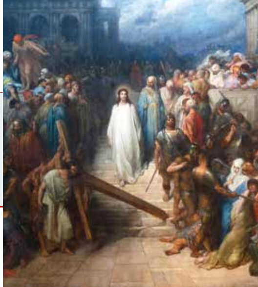
Gustave Doré, Isusa odvode da ga razapnu, 1876. – 1883.