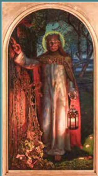
William Holman Hunt, Krist – Svjetlost svijeta , 1904.