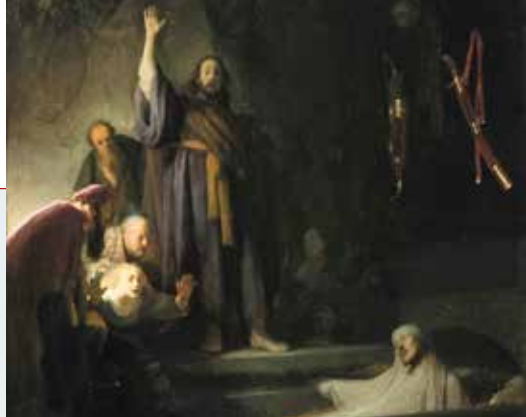
Rembrandt Harmenszoon van Rijn, Isus uskrisuje Lazara, 1630.