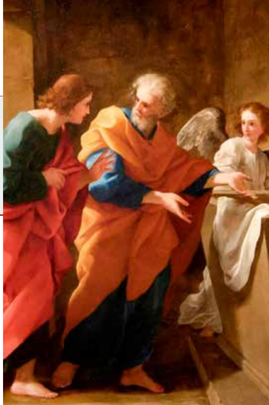
Giovanni Francesco Romanelli, Petar i Ivan kod praznog Kristovog groba, 1641.