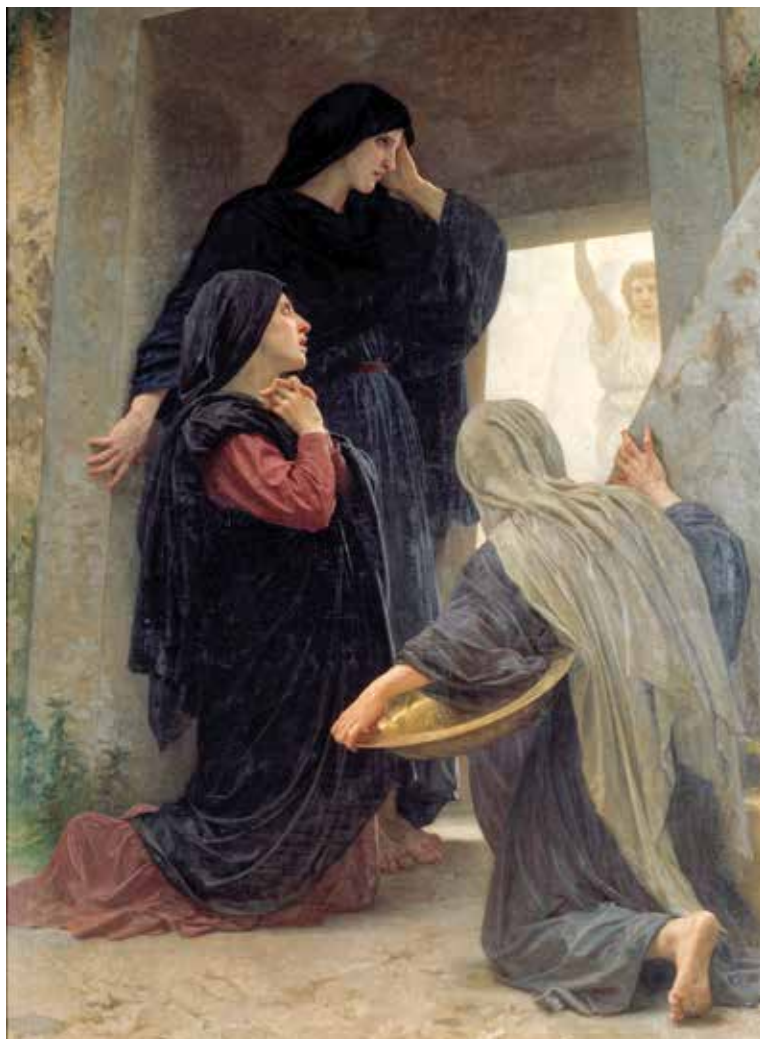
William-Adolphe Bouguereau, Žene na grobu , 1890.

onda svi vjernici palili svoje svijeće, što je simboliziralo Krista koji prosvjetljuje svoje vjernike. Osim toga u 4. st. hodočasnica Egerija svjedoči kako bi u bazilici Svetoga groba u Jeruzalemu u sklopu službe Večernje svakoga dana oko desetog sata (16 sati) biskup sa Svetoga groba – gdje danju i noću gori uljanica – palio svijeću od koje bi svi vjernici palili svoje svijeće.