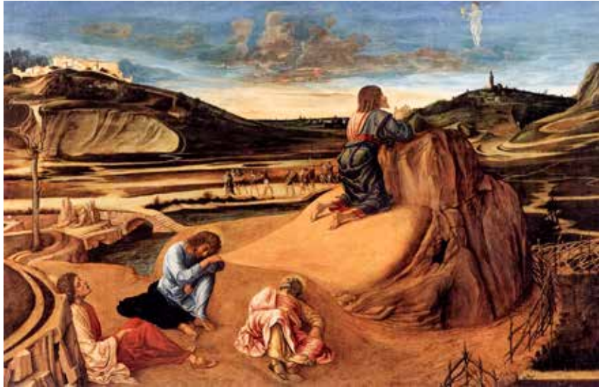
Giovanni Bellini, Agonija u Getsemanskom vrtu , 1465.

Na žalost, mi izgrađujemo društvo – naš grad, kao društvu u kojemu očekujemo da nam političari i društvene vođe omoguće da ostvarimo svoje želje, bilo da je riječ o nostalgijama ili nekim projekcijama budućnosti. Umjesto da raspravljamo o nostalgičnoj prošlosti i priželjkujemo neostvareno budućnost, bilo bi nam mnogo poželjnije slijediti Isusa i prihvatiti ga za Mesiju i Spasitelja koji dolazi u ime Gospodnje, a ne u ime ljudskih potreba i želja. On je Bog naše sadašnjosti, prorok i kralj koji je sposoban dotaknuti naš život i izbrišati nam sve lažne predodžbe i neutemeljena nadanja, bilo prošla bilo buduća. Ali