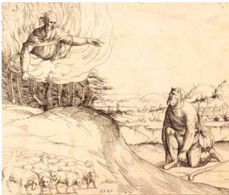
Augustin Hirschvogel, Mojsije pred gorućim grmom , 1548.

Horeb ( 1Kr 19,12 ) istodobno produbljuje istu simboliku i čuva ju od toga da se Božja prisutnost svede samo na silovite pojave. Naime, Bog se ne iscrpljuje u oluji, potresu i ognju, premda se njima može služiti; on dolazi u tišini, gdje susret nadilazi