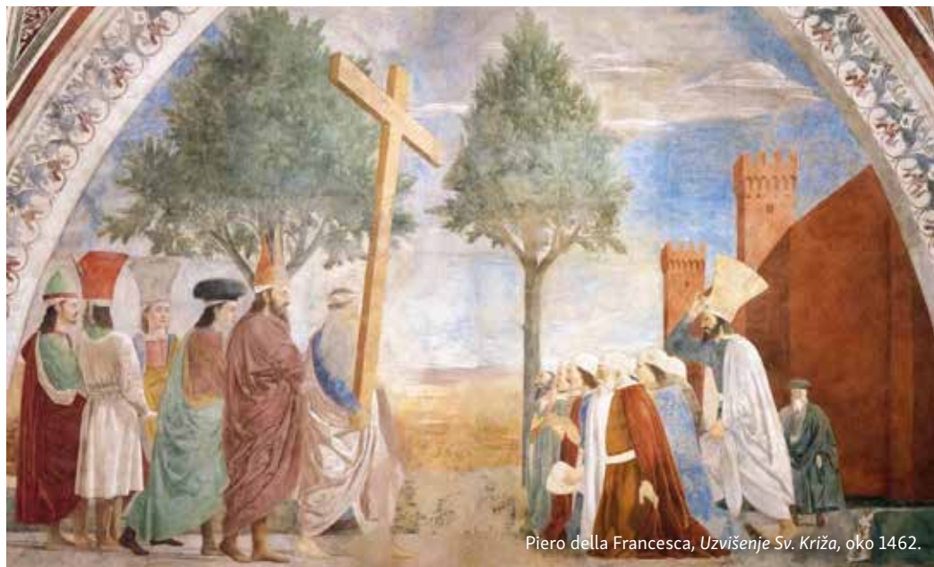
Piero della Francesca, Uzvišenje Sv. Križa, oko 1462.

zmiju – pogled u nju liječi (usp. Br 21,9). Isus ovo navodi jer ponovno uspoređuje ono prije i ovo sada. Prije je pogled u zmiju dopuštao nastavak FIZIČKOG života (vjera), a sada pogled u križ omogućuje UNUTARNJI život.