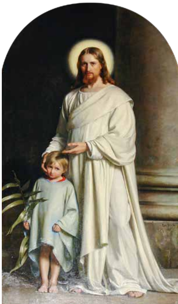
Carl Bloch, Isus i dijete , 1873.

Kada se vjernici nedjeljom saberu oko Riječi i stola Gospodnjega, onda im se ovaj važni Markov tekst pretvara u svjetlo pouke. Vjernicima je potrebno uvijek iznova razumjeti kakav je svijet. Potrebno im je izići iz straha od nerazumijevanja i odvažiti se na