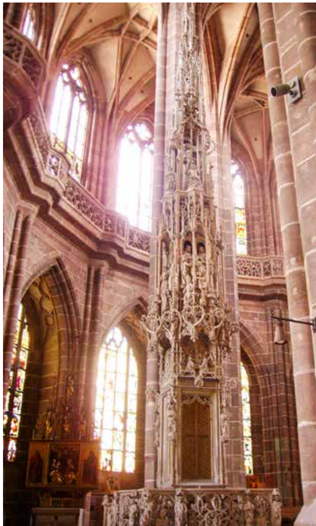
Sakramentalni toranj u crkvi sv. Lovre u Nürnbergu

Nakon prvog tisućljeća nalazimo ono što će biti prihvaćeni oblik nekoliko stoljeća u Italiji, a također u Njemačkoj, jer se smatrao praktičnijim i sigurnijim: zidni tabernakul. To je niša u zidu apside, obično uz oltar, postavljena na stranu oltara s koje se naviještalo Evanđelje ( cornu Evangelii ) ili u koru, i opremljena malim vratima s bravom. U gotičkom i renesansnom razdoblju, ovi zidni tabernakuli imaju veće dimenzije obogaćivani su reljefnim skulpturama s euharistijskim simbolima i sve više postajali remek-djela kojima se i danas možemo diviti, poput onoga u bazilici Sv. Klementa u Rimu (XIII. st.) i onoga iz Spoleta (XV. stoljeće). Od XVII. stoljeća, poslije Tridentskog koncila, tabernakuli za čuvanje posvećenih hostija stavljaju se na središte oltara, a ovi zidni korišteni su za čuvanje svetih ulja.