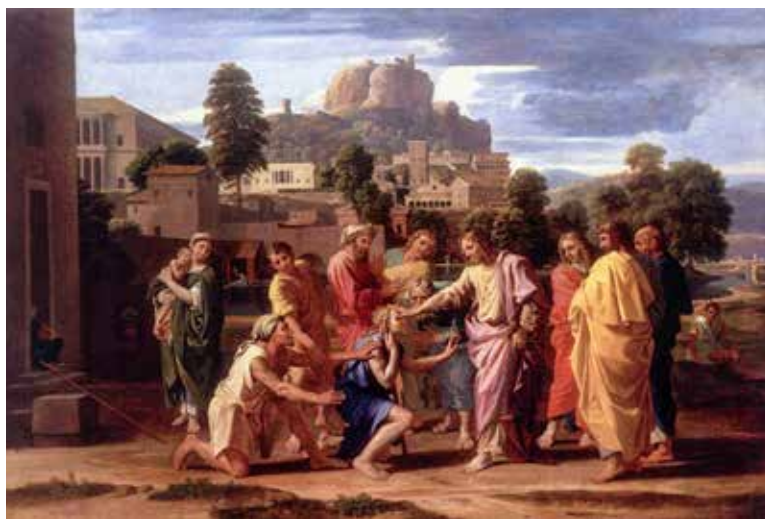
Nicolas Poussin, Ozdravljenje slijepca Bartimeja, 1650.

Kontemplativno pristupati svima i svemu znači dematerijalizirati ovaj svijet. Kada susrećeš sve ljude i sva stvorenja, tada ih promatraš duhovno, a to znači s Božjega gledišta: svakoga čovjeka promatraš kao sliku Božju, za kojega je Bog patio i umro, za kojim žudi svojom ljubavlju.