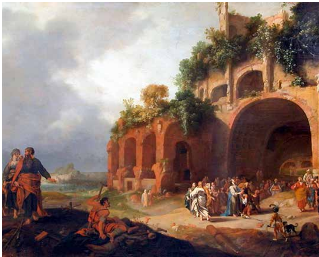
Bartholomeus Breenbergh, Isus ozdravlja gluhog mucavca , 1635.