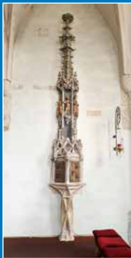
Gotičko svetohranište u župnoj crkvi Presvetog Trojstva u Nedelišću, 1530. – 1540.