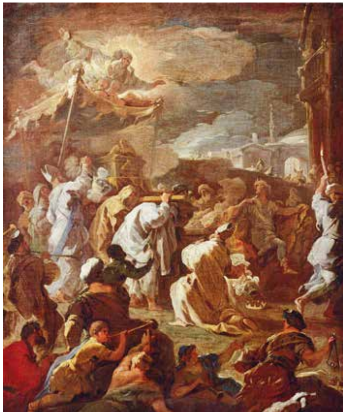
Luca Giordano, David prenosi kovčeg saveza , 1685.

sve je čisto. Naime, budući da je »čistima sve čisto« ( Tit 1,15) i svi su ljudi za kontemplativnu dušu čisti, jer ih ona sve želi zaključati Kristovom ljubavlju. I pritom takva duša, koja kontemplativno dematerijalizira sva stvorenja, sve ljude pa i sva stvorenja smatra većima od sebe ( Fil 2,3), jer u svima vidi Krista i jer svima želi služiti radi Krista. Budući da je ljubav služenje, ljubav zahtijeva da sve ljude i sva stvorenja smatramo višima od sebe.