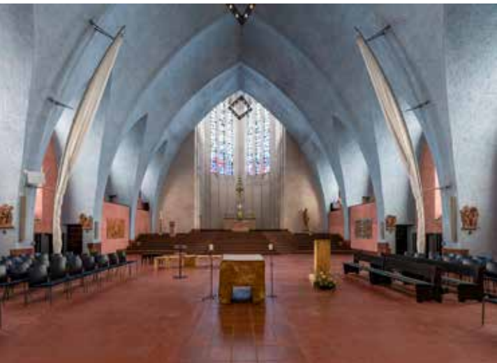
Crkva sv. Bonifacija u Frankfurtu na Majni (primjer praznine u prostoru svetohraništa)

Crkve, kao mjesta okupljanja vjernika na liturgijska slavlja, ne bi smjele biti klijalište kritika i nezadovoljstva već skladno promišljeni i situirani liturgijski prostori unutar crkvene zajednice, koji su svojom dinamikom i oblikovnim izričajima Božji dom – dostojno mjesto susreta i života s Bogom.