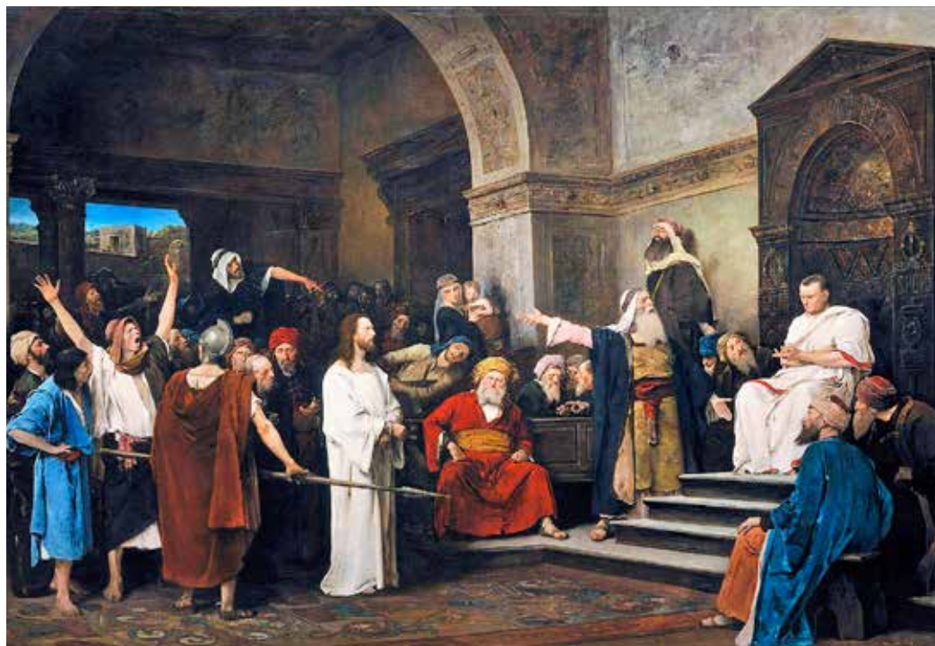
Mihály Munkácsy, Krist pred Pilatom , 1881.