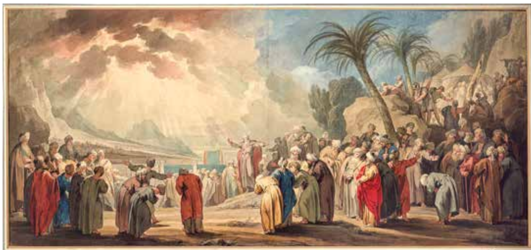
Jacob de Wit, Mojzije i sedamdesetorica starješina , 1739.

velike stvari u ime Isusovo zapravo znači posjedovati Isusovog Duha, te iz punine toga Duha Božjega i njegove ljubavi, činiti dobra djela svakom čovjeku, gladnom i žednom, golom i bosom, osamljenom i bolesnom. Tko god to čini, neće mu propasti plaća, makar ne pripada grupnim granicama apostolske dvanaestorice.