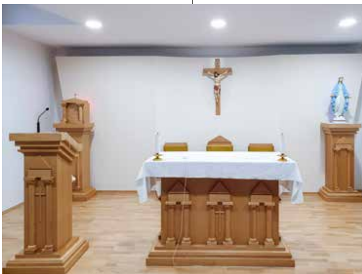
MK, Prezbiterij sa svetohraništem u kapeli pastoralnog centra u Ludbregu, 2017.