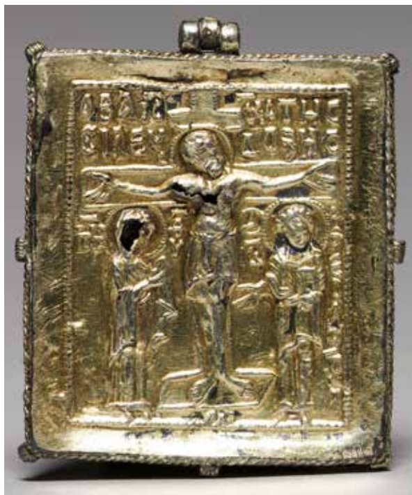
Nep. autor, Enkolpija, oko 1080.

je bio euharistijski kruh. Hipotezu podupire materijal korišten za izradu, zapravo tornjevi su bili izrađeni od srebra, a golubice od zlata. Knjižničar Anastazije piše u djelu De vita Pontificum da je Konstantin bazilici svetog Petra darovao toranj i golubicu od čistog zlata, ukrašenu s dvjesto pedeset bijelih bisera; Inocent I. je dao sagraditi za crkvu sv. Gervazija i Protazija srebrni toranj i zlatnu golubicu, a papa Hilarije darovao je Lateranskoj bazilici srebrni toranj i zlatnu golubicu. Također se govori o mjestu gdje su tornjevi i golubice bili smješteni. Pozivajući se na ulomak iz Apostolskih konstitucija, koje potječu iz IV. stoljeća, neki smatraju da su se posvećene hostije čuvale u pastoforiju , odnosno na najskrivenijem i najnepriступnijem mjestu crkve. Sveti Jeronim i neki drugi crkveni pisci poistovjećuju pastoforij i sakrarij. Pastoforij je bila soba, izvan crkvene dvorane. Tornjevi i golubice bili su obješeni, pomoću lanaca, na sredini ciborija koji je bio iznad oltara. Kao što su se ispod