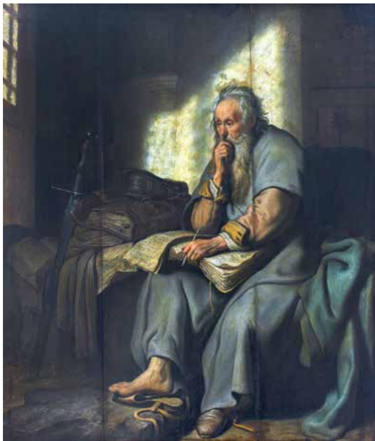
Rembrandt Harmenszoon van Rijn, Sveti Pavao u zatvoru, 1627.

[...] Gospodin želi biti skrovito prisutan da nas pouči ljubavi. Ljubav traži skrovitost, intimu, samoću, tamu, tj. tamu groba i ložnice, kako bi se oni koji ljube potpuno posvetili jedno drugomu. Tko ne traži Gospodina u svetohraništu, u toj skrovitosti groba i ložnice, taj ne ljubi Gospodina. Čini možda pred ljudima velika djela, ali ne čini to radi Gospodina.