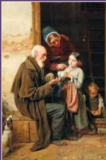
Ferdinand Georg Waldmüller, Ljubazni dar siromahu , 1850.