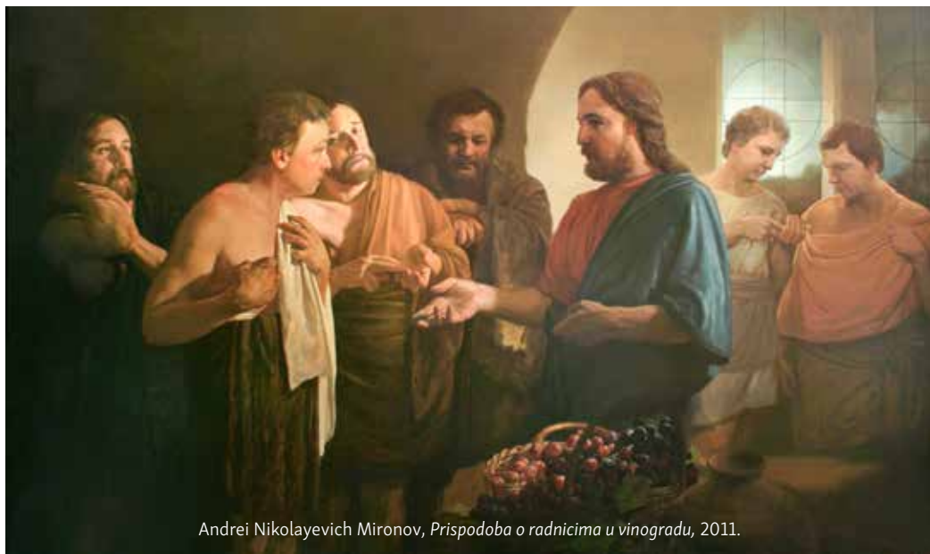
Andrei Nikolayevich Mironov, Prispodoba o radnicima u vinogradu , 2011.

tegotu dana i žegu» (20,12). Gospodar tada pokazuje svoju pravednost: s točke gledišta prava on je besprijekoran zato što se striktno pridržava dogovora s prvima o visini dnevnice i zato što je njegovo neotuđivo pravo dati posljednjima toliko koliko i prvima. Pravo nije povrijeđeno: »Prijatelju, ne činim ti krivo« (r. 13). No možda je problem sasvim drugi. »Ili zar je oko tvoje zlo što sam ja dobar? (r. 15)«. Problem koji veoma jasno suprotstavlja »zlo oko«, tj. zavist prvih radnika zbog dobrote gospodara. Ustvari to što je prvima teško prihvatiti je izjednačenost plaća, a u biti izjednačenost s drugima: oni su imali sva prava, prema njihovoj logici, očekivati više: »no ti si – predbacuju gospodaru – ti si ih izjednačio s nama« (r. 12). Drugim riječima, poveo si se prema njima kao prema nama. No zašto bi to trebao biti problem?