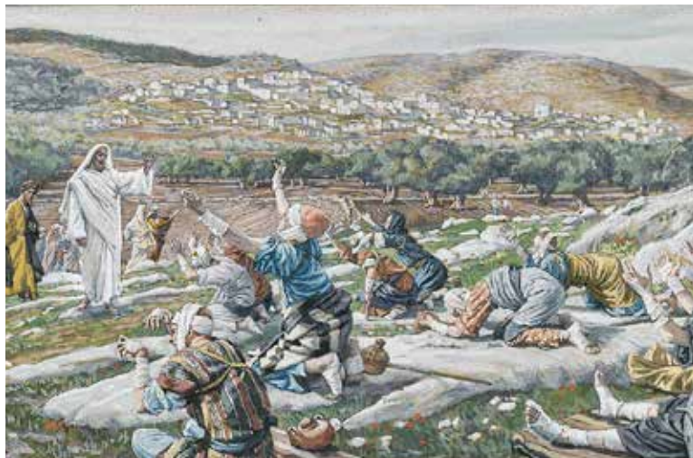
James Tissot, Ozdravljenje deset gubavaca, 1886. – 1894.

kvatre donose evanđelje o pozivu prvih učenika. U skladu s time ponuđeni su i obrasci (modeli) molitve vjernika.