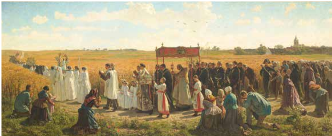
Jules Breton, Blagoslov žita , 1857.

Čovjekove sposobnosti kojima dolazi do ploda su dar Božji. Tu su i vanjske okolnosti, na koje često čovjek nema utjecaja, već samo Stvoritelj.