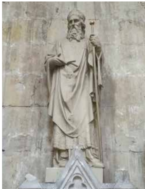
Sv. Mamerto (11.V.), kip u katedrali Sv. Mauricija u Vienne (Francuska)

Stari liturgijski izvori redovito na temelju spominjanih sakramentarâ, donose liturgijske obrasce za oba slavlja. Često u njima nalazimo jednake molitve, što nam implicitno govori da je njihov smisao već u srednjem vijeku shvaćan i doživljen praktično jednako. Pokornički je element naglašen pojmovljem što je očito u uvodnom zazivu molitve Ad pontem olbi iz obrasca Litania maior u GrH br. 468: »Parce, Domine, quæsumus, parce populo tuo... Poštedi, Gospodine molimo, poštedi svoj narod...« Jednako shvaćanje smisla obaju slavlja preuzima i Tridentiski misal. Obrasci mise su jednaki za oba slavlja, i preuzeti su iz GrH. Ostaje naglašen pokornički element pa se u rubrici veli da se u slučaju održavanja ophoda, procesije, Vjerovanje ne govori, čak ni u nedjelju. Vidljivo je doduše da je procesija tada već po volji, dakle nije obvezna, već će se prilagođavati pastoralnim okolnostima i kontekstu.