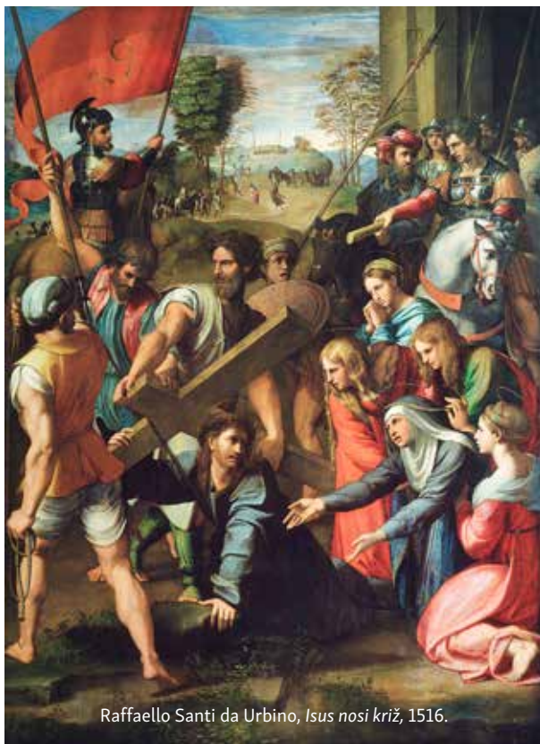
Raffaello Santi da Urbino, Isus nosi križ , 1516.

Pozvani smo živjeti u društvu i to ne možemo izbjeći, ali trebamo kao kršćani prepoznavati i vrednovati pozitivne stvari društva i kulture, a ne nasljedovati kulturu svjetovnosti. Nasljedovati Isusa uz riječi: »hoće li tko za mnom« i »neka ide za mnom« pretpostavlja dva uvjeta: odreći