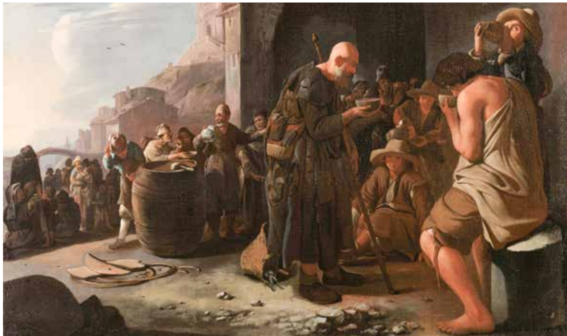
Michiel Sweerts, Žednoga napojiti , 1646. – 1649.

će im on odgovoriti: 'Zaista, kažem vam, što god ne učiniste jednemu od ovih najmanjih, ni meni ne učiniste.'« (Mt 25,45) Stoga si bliži Gospodinu uvijek kada daješ, a ne kada primaš; kada se osiromašuješ, bliži si njemu nego kada se bogatiš. Jer je Gospodin ljubav, a ljubav se bogati tako što se osiromašuje, ona se povećava tako što se daje. No, još je nešto važno ovdje istaknuti. Postoji opasnost da se u davanju milostinje, ne samo pred drugima, oholo hvalimo kao farizeji – svi moraju znati da smo dali milostinju, odmah zovemo »medije«, nego da se hvalimo i u sebi samima. Takvo pak oholo hvalisanje sobom ne donosi nam nikakvu zaslugu. Štoviše, možemo biti zbog oholosti i gori od onih koji nisu ništa dali za milostinju. Da se to ne dogodi, budimo ponizni, uvijek pred sobom imajmo Gospodina kao nenadmašni uzor osiromašenja. Jer, tko se može tako osiromašiti kao sam Spasitelj, Bog koji je postao čovjekom! Nitko. I još nešto. Ne možemo se oholo hvalisati sobom kod davanja milostinje jer je Spasitelj uvijek više prisutan u onom siromašnom koji prima negoli u onom bogatašu koji daje.