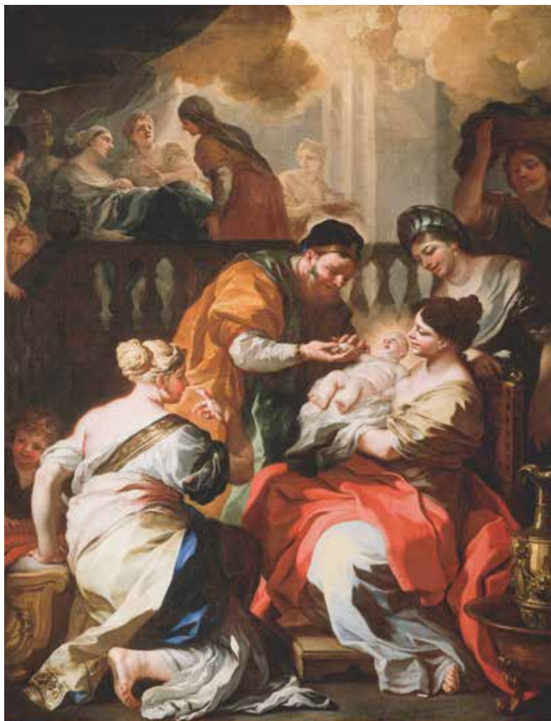
Francesco Solimena, Rođenje Blažene Djevice Marije , 1690.

Današnji blagdan ne govori samo o rođenju Blažene Djevice Marije nego i o tvom novom rođenju po Božjoj Riječi. Danas te Gospodin poziva da Njemu prepustiš svoju prošlost jer ti vrijediš više od pukotina i rana svoje prošlosti, bilo da si ih sam u