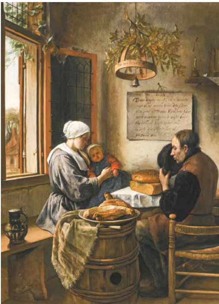
Jan Havickszoon Steen, Molitva prije jela , 1660.