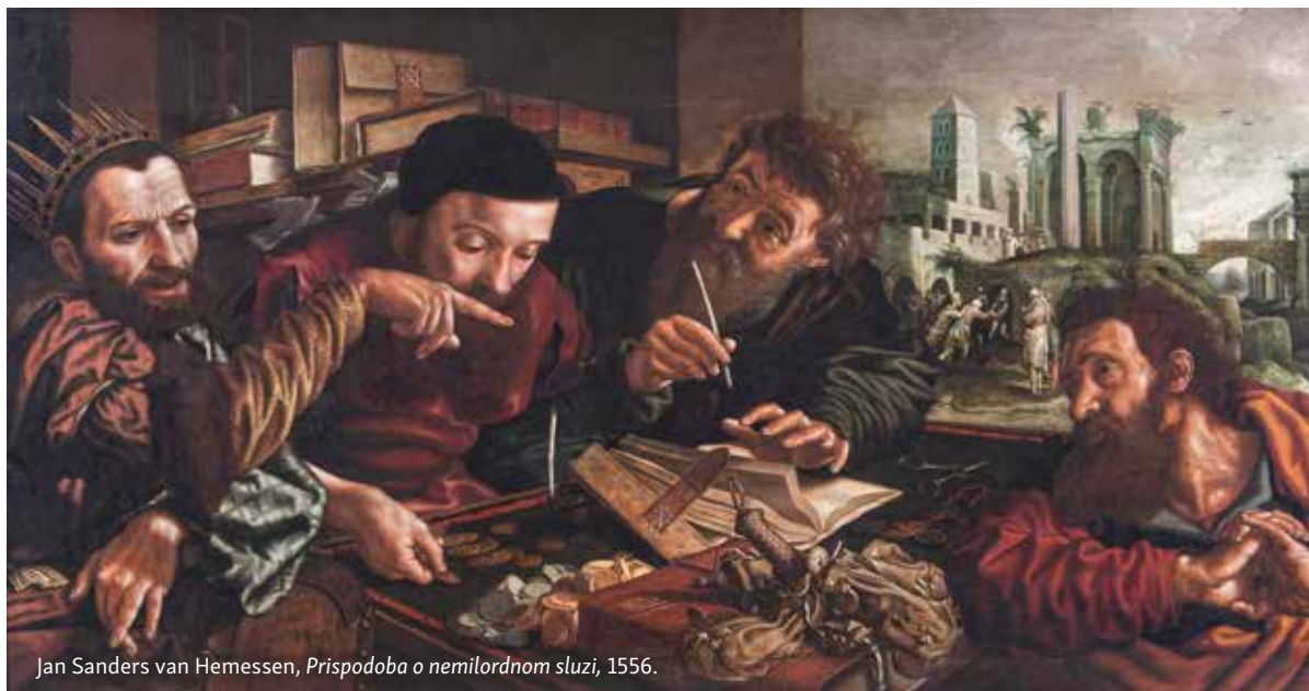
Jan Sanders van Hemessen, Prispodoba o nemilordnom sluzi , 1556.

a ne traže oprostjenje? Treba li opraštati 'braći' koja, ne samo da ne traže oprostjenje, već svjesno nastavljaju činiti zlo, ne samo da ne traže da im 'vratimo njihov dug', već se i dalje 'zadužuju' zlom i mržnjom, uvredama i lažima? Osim toga, određeni broj takve 'braće', 'braćnih drugova', 'rođaka' i 'prijatelja' čine nepravdu i onima koji je trpe tumače kako su dužni trpjeti u ime Evanđelja i Isusova nauka koji nas obvezuje bespogovorno trpjeti nepravdu.