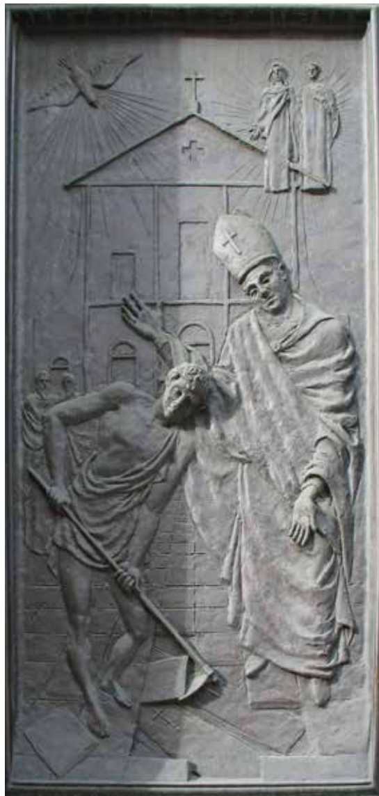
Papa Gelazije I., prikaz na vratima bazilike svetih Gervazija i Protazija (zaštitnici kosaca...), Rapallo (Italija)

Tri termina posta odgovaraju dakle danima rimskih poganskih slavlja te se mogu čitati kao nastojanje Crkve da tim danima dade novo, kršćansko značenje. Četvrte kvatre, one proljetne, dodane su kasnije kako bi se 'dopunio' godišnji ciklus posta vezan uz godišnja doba. U izvorima iz 5. stoljeća, a koji se povezuju s papom Gelazijem, proljetne kvatre nazivaju se Ieiunium quadragesimalis inities , »post na početku korizme«. Vlastiti molitveni obrasci za proljetne kvatre dodani su vjerojatno u drugoj polovici 6. stoljeća te su različiti u odnosu na misne tekstove prvoga korizmenog tjedna. Zbog dvostrukih tekstova za iste dane, oni vlastiti korizmi ubrzo su nestali iz liturgijske tradicije. O tome svjedoči Liber diurnus iz 6. stoljeća koji na tragu odredaba pape Gelazija propisuje obrede ređenja u dane kvatri ( primi, quarti, septimi et decimi mensis ieiunii ), odnosno na kvatrene tjedne u ožujku, lipnju, rujnu i prosincu. Time i proljetne kvatre postaju sastavni dio rimske kvatrene liturgije. Uz židovsku tradiciju posta i utjecaje poganskih poljodjelskih običaja i blagdana, kršćani su u bogoslužju kvatri nastojali postom i subotnjim bdjenjem istaknuti eshatološko shvaćanje vremena i liturgijske godine, koja je ritmizirana kozmičkim kalendarom, solsticijima i ekvinocijima, te time naglasiti eshatološko značenje svih liturgijskih bdjenja u gradu Rimu.