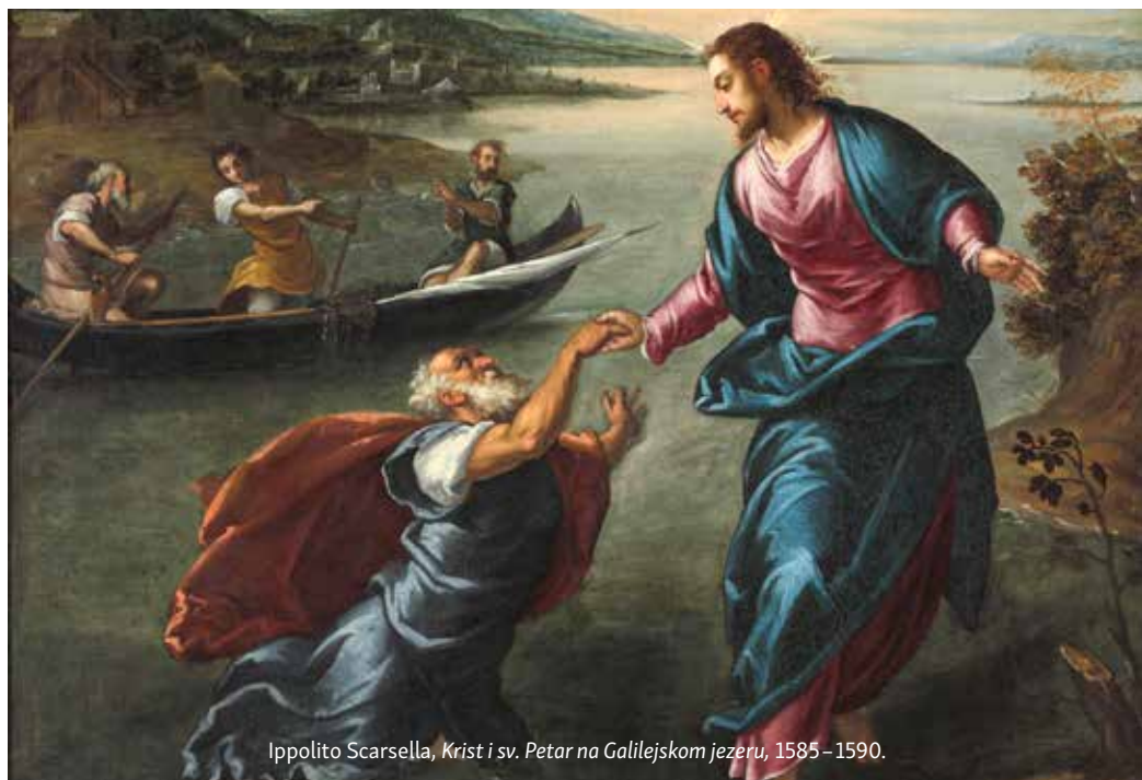
Ippolito Scarsella, Krist i sv. Petar na Galilejskom jezeru , 1585–1590.

što ide prema Gospodinu. A išao je Gospodinu zahvaljujući poslušnomu izvršavanju njegove zapovijedi. Još više, snaga mu je došla iz Kristove zapovijedi: »Gospodine, ako si ti, zapovjedi mi da dođem k tebi po vodi.« Suprotno od bučnoga svijeta, Petar snagu crpi u zapovijedi i poslušnosti. Tako nas Gospodin poučava: gdje su zapovijedi i poslušnost, tu je spasenje . Dok Petar po zapovijedi i u poslušnosti ide k Gospodinu, čovjek pak bučnoga svijeta prezire zapovijedi i poslušnost, jer ide k sebi. I Petar je moćan dok je nemoćan, dok je u svojoj nemoći gledao Isusa. Tonuti počinje u onom trenutku kada prestaje »slušati ono što mu Gospodin govori«, kada počinje slušati i gledati ono što mu bučni svijet govori. Zaista je to tako neobično. Petar je snažan dok u strahu nad sobom ide izdaleka Gospodinu, a počinje tonuti kada je blizu Gospodinu, kada se u toj blizini počinje pouzdavati u sebe. Kako li je blizina s Gospodinom opasna, često i opasnija negoli udaljenost od Gospodina! Zašto? Jer nas može učiniti još oholijima, tako umišljenima da sada, u blizini s Gospodinom, dok