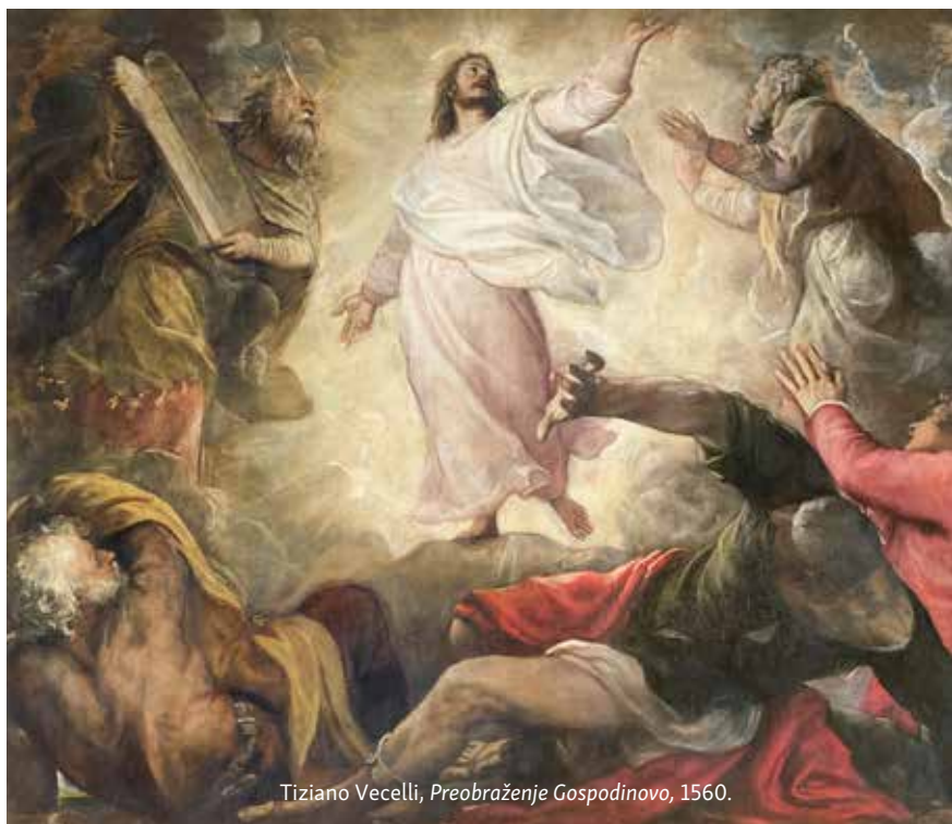
Tiziano Vecelli, Preobraženje Gospodinovo , 1560.

Činjenica je da Isus nije poveo sve učenike na brdo preobraženja, izabrao je samo