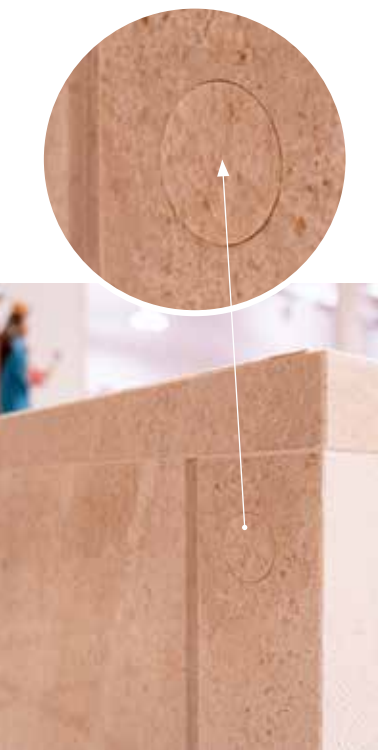
Posudica s moćima ne pohranjuje se ni na oltar ni u oltarnu ploču nego, već prema obliku oltara, pod njegovu ploču (Rpo, 11). U oltar se pohranjuju moći mučenika da bi se označilo kako žrtva udova ima svoje počelo u žrtvi Glave.

Latinski tekst molitve sastoji se od 41 stiha, raspoređenih u 11 strofa, a podijeljen je na tri dijela. Prvi dio (1-19) sastoji se od 5 strofa, od kojih prve četiri čine prolog koji najavljuje temu: Krist je ispunjenje mnogih drevnih likova otajstva oltara; po tri sljedeća