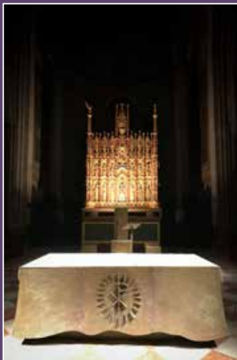
Oltar katedrale u Piacenzi (Italija)