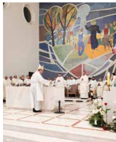
Pomazanjem krizmom oltar postaje znamen Krista, koji prije svega jest, a onda se i zove, »Pomazanik«; njega je naime Otac pomazao Duhom Svetim i postavio za Velikog svećenika, da na žrtveniku svoga Tijela prinese život kao žrtvu za spasenje sviju (Rpo, 22a).

Nakon obreda pomazanja stavi se na oltar žarište za paljenje tamjana ili miomirisa ili, ako se to smatra zgodnijim, hrpa tamjana,