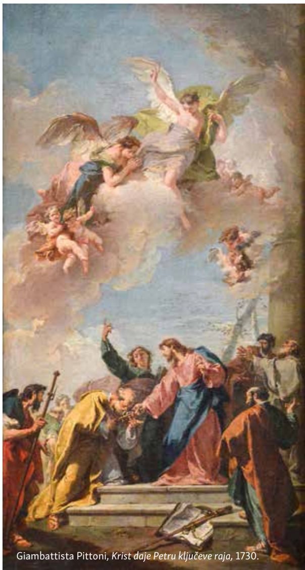
Giambattista Pittoni, Krist daje Petru ključeve raja , 1730.

Sve to dogodilo se nakon što je Isus rekao »Ti si Petar-Stijena i na toj stijeni sagrađiću Crkvu svoju«, što znači da Petar svoju službu u Crkvi može vršiti samo podržan