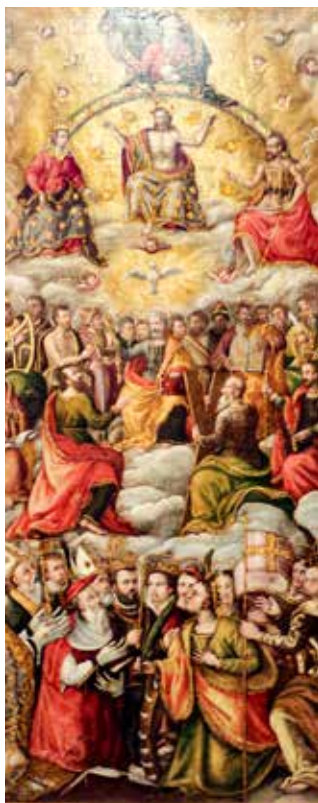
Giovanni Maria Baldassini, Slava svetih u raju , 1571.

je voda znak krštenja kojim su vjernici oprani i po kojoj oni postaju duhovnim žrtvenikom. Dakle, dok je u starom obredu bilo vidljivo da se škropljenjem crkva čisti i odjeljuje od svjetovnoga, ovdje se naglašava spomen krštenje. Ovaj obred zamjenjuje pokajnički čin.