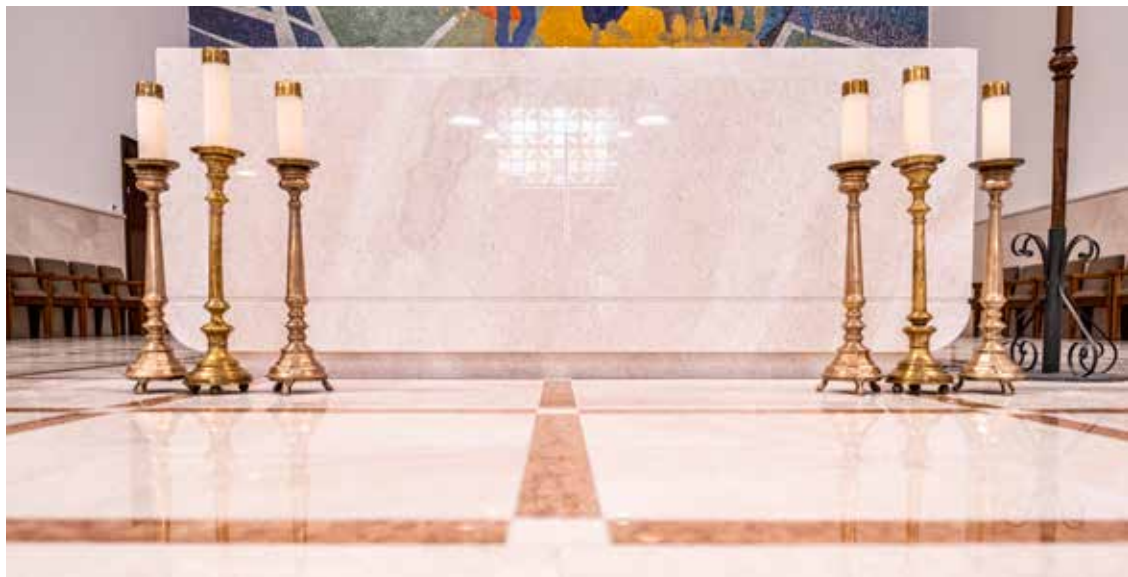
Oltar crkve Blažene Djevice Marije Pomoćnice – Zagreb, Knežija

koji projektira bila ponuđena. Nosači pak ili osnova na kojima leži ploča mogu se izraditi i iz drugog materijala, samo da je doličan i čvrst. Ukoliko postoji oltar u prezbiteriju koji je postojao prije Drugog vatikanskog koncila, on ne smije biti pokriven oltarnikom, tako da se na taj način istakne da je jedan jedini oltar za slavlje.