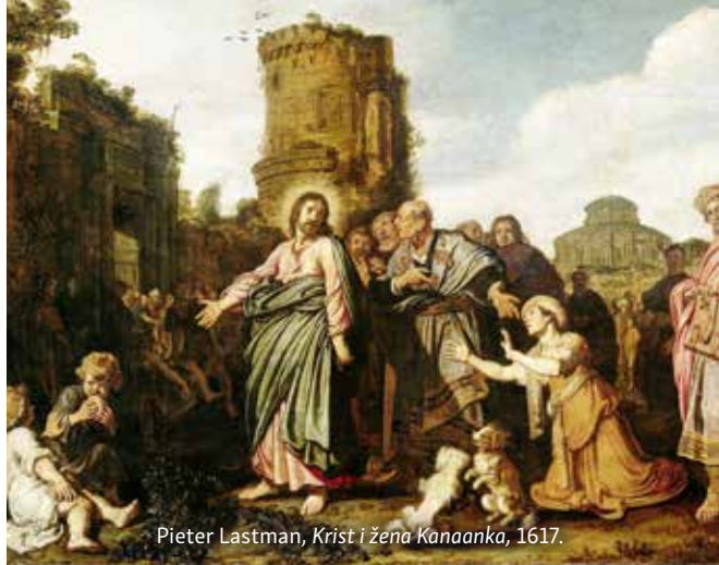
Pieter Lastman, Krist i žena Kanaanca , 1617.

Zbog toga bi krivo bilo promatrati blagoslove kojima je Bog blagoslovio druge ljude, pa im zavidjeti na dobru koje su primili. Bog jednako ljubi i njih i nas. Često se događa da ne primjećujemo ono dobro koje je Bog učinio nama. U svakodnevnom životu dobro je ponekad pogledati unazad i vidjeti što nam je Bog učinio, kakvim nas je