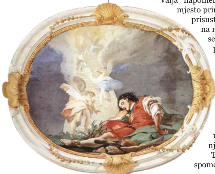
Giovanni Battista Tiepolo, Jakobov san , 1726.–1729.

Takav žrtvenik, koji je bio u funkciji spomena na susret s Bogom, izgledao je kao