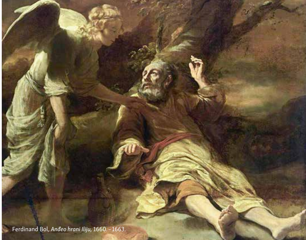
Ferdinand Bol, Andeo hrani Iliju , 1660. – 1663.

se dadnu poučiti njegovom istinom, čime se osposobljavaju za prihvaćanje dubine njegovih otajstava. Ako pažljivo razmatraju njegova otajstva i postaju učenici koji traže istinu, moći će potom i doći k njemu, svjesni da je Božji Sin, da je vidio Oca i da naviješta puninu njegova otajstva. Onaj tko s vjerom pristupa Božjoj objavi liječi se od vlastite sumnjičavosti, postavljajući dobar temelj na kojemu može graditi vlastiti život i ponašanje, za razliku od onih kojima je mrmljanje najvažnija životna aktivnost. Pozivajući na vjeru, Isus pokazuje da je ona najveći izraz slobodoumnosti, dok su mrmljanje i kritiziranje pokazatelj nesređenog unutarnjeg života i lošeg stanja duše. Zato, ako treba pokazati revolucionarnost, onda je treba pokazati vjerujući u Boga koji na tako revolucionaran način ljubi čovjeka i objavljuje mu se. Ako treba izraziti bunt, onda to treba odupirući se ljudskim niskim težnjama i neurednim nastojanjima, a ne osporavajući Boga i njegovu istinu.