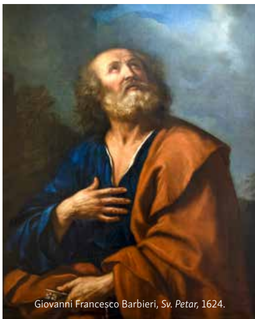
Giovanni Francesco Barbieri, Sv. Petar, 1624.

S. Kierkegaardu, poznatom kršćanskom filozofu, čini se kako je nama vjernicima glavni problem u tome što težimo imati pobjedničku Crkvu već ovdje na zemlji. Drugim riječima, na kršćanstvo gledamo kao na istinu u smislu rezultata, umjesto da ga gledamo kao istinu u smislu izbora pravog puta. Krist nije došao na zemlju da mu se divimo, da samo uzvišeno govorimo o njemu i filozofskom i teološkom relevantnošću zadivimo druge. To je sve potrebno, ali istovremeno i nedovoljno zato što prihvaćanje Krista podrazumijeva praksu, a ne samo teoriju. Ispravni život, a ne tek ispravno učenje. Njegovo mišljenje o onima koji imaju samo ispravno učenje ali su životom daleko od njega (»Narod ovaj štuje me samo usnama, ali srce je njegovo daleko od mene« Mt 15,9) odveć nam je poznato. Onaj koji uistinu slijedi Učitelja jest onaj koji teži biti što