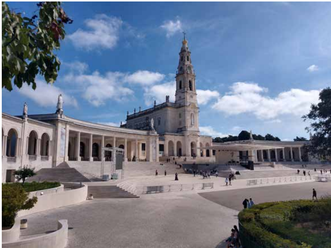
Marijansko svetište u Fatimi

posredovati svoju riječ, poruku, volju, naredbu. Da takve povijesne objave Boga u ograničenim stvorenijskim znakovima postoje, o tome svjedoči i Sveto Pismo. Imajući rečeno u vidu, Karl Rahner zaključuje: »Tko dakle niječe apsolutnu mogućnost posebnih objava, protivi se vjeri; tko poriče da se one ne mogu dogoditi i nakon vremena apostola, protivi se jednom teološki sigurnom nauku. No svatko se, ako želi biti kršćanin, mora pitati, živi li u stavu, koji je unaprijed takvim objavama Boga zatvoren, te vjeruje li i odobrava li vizionarska zbivanja u Pismu zato što je na njih naviknut, a ne zato što u njemu ne bi odmah izazvala racionalističko protivljenje, kada bi ih iznova susreo« (K. Rahner, Über Visionen und verwandte Erscheinungen , 183).