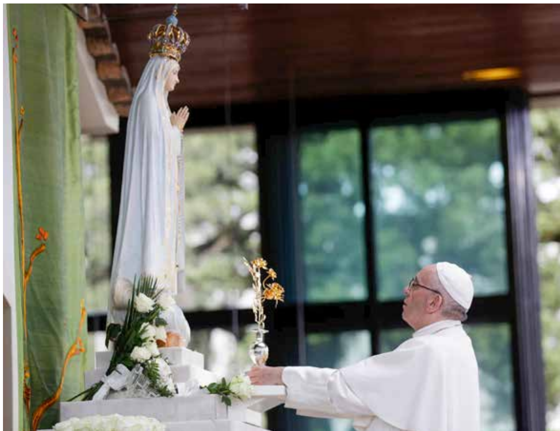
Papa Franjo moli ispred Gospina kipa u kapeli Ukazanja u Fatimi

da se iz nje na neki način izvode i narod k njoj vode, jer ih ona po svojoj naravi daleko nadvisuje» (SC, 13). Liturgija je vrhunac crkvenoga života, a liturgijsko slavlje jest okupljanje u vjeri zajednice koja moli i pozorna je na Božju riječ. Njezina je svrha prinositi Bogu žrtvu koju je na križu jedanput zauvijek prinio Krist, koja se uprisutnjuje svaki put kada Crkva slavi svetu misu, kako bi Bogu izrazila bogoštovlje i klanjala mu se u duhu i istini.