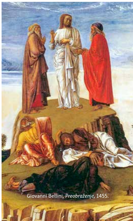
Giovanni Bellini, Preobraženje , 1455.

S veta Crkva dva puta u liturgijskoj godini razmatra o preobraženju Gospodinovu: na Drugu korizmenu nedjelju i na blagdan Preobraženja Gospodinova. Čitanja toga blagdana ističu kontemplativnu dimenziju. Prvo čitanje, apokaliptične naravi, pripovijeda kako je Danijel, u noćnim viđenjima, vidio onoga »koji na oblacima nebeskim dolazi kao Sin čovječji«, kojemu su predana »vlast, čast i kraljevstvo« (Dn 7,13-14). Drugo čitanje podsjeća na iskustvo očevidaca preobraženja, koji su čuli glas uzvišene Slave kako govori o Isusu: »Ovo je Sin moj, Ljubljeni moj, u njemu mi sva milina« (2Pt 1,17). Markovo evanđelje govori kako Petar, Jakov i Ivan, nakon vizije, »obazrevši se uokolo, nikoga uza se ne vidješe doli Isusa sama« (Mk 9,8). Ovo je izravan poziv za prelazak od prolaznog viđenja proslavljenoga Gospodina do stanja trajne kontemplacije, u kojem je moguće sve vidjeti u svjetlu njegove slave.