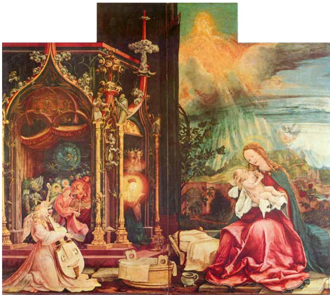
Mathias Grünewald, Kristovo rođenje, 1515.

toga duhovnoga fenomena« ( Norme, Predstavljanje ). Na drugom mjestu, tumačenje te kvalifikacije potkrepljuje se citatom Benedikta XVI. ( Verbum Domini , 14): »Crkveno odobrenje privatne objave u biti ukazuje na to da povezana poruka ne sadrži ništa što je u suprotnosti s vjerom i dobrim običajima; dopušteno ju je objaviti, a vjernici su ovlašteni prihvatiti je na razborit način. [...]« ( Norme , 22). Kvalifikacijom Nihil obstat se, dakle, ne utvrđuje »nadnaravnost« dotičnog fenomena niti se vjernike obvezuje da ga prihvate (usp. Norme , 13). Njome se poručuje da se prepoznaju znakovi djelovanja Duha »usred« određenog duhovnog iskustva, dopušta se vjernicima da određeni fenomen koriste kao duhovnu pomoć i autorizira se pastoralno djelovanje povezano s dotičnim fenomenom (usp. Norme , 17).