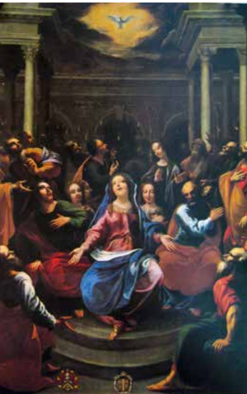
Georges Lallemand, Silazak Duha Svetoga, 1635.

»nadnaravnosti« ostaje kao opcija, ali u iznimnim slučajevima, kada sam Sveti Otac intervenira i ovlašćuje pokretanje istrage s tim ciljem (usp. Norme, Predstavljajnje ). S druge pak strane, Norme čine odmak od prevelike fokusiranosti samo na »čudesnost« neke pojave te kao redovno mjerilo postavljaju duhovne i pastoralne plodove nekoga fenomena – upravo ono što i jest pravi smisao privatnih objava. U prilog ovakvoj kvalifikaciji ide i povijest, koja pokazuje da mnoga svetišta nisu nikada dobila izjavu o nadnaravnosti događaja, ali je osjećaj vjere vjernika prepoznao djelovanje Duha i nisu se pojavila kritička pitanja koja bi zahtijevala službeni intervent crkvenih pastira (usp. Norme, Predstavljajnje ).