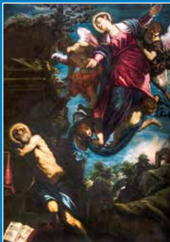
Jacopo Tintoretto, Jeronomovo viđenje Gospe, 1582. – 1583.