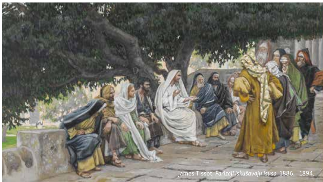
James Tissot, Farizeji iskušavaju Isusa , 1886. – 1894.

nutarnje duhovne i moralne čistoće, ali se kod pismoznanaca i farizeja dogodilo to da im su vanjska i unutarnja čistoća izgubile međusobnu povezanost. Štoviše, stječe se dojam da se iza njihove rigoroznosti u obdržavanju vanjske čistoće krije neku unutarnji nered koji oni žele licemjerno zamaskirati. U tom smislu Isus na njih primjenjuje riječi proroka Izaije »Ovaj me narod usnama časti, a srce mu je daleko od mene...« (Iz 29,13), i time im pokazuje koji dio tijela trebaju najprije očistiti. To je srce, koje se ovdje kao i mnogim ostalim mjestima u Svetom pismu ne odnosi na tjelesni organ, nego na središte čovjekova bića iz kojega može izvirati i dobro i zlo.