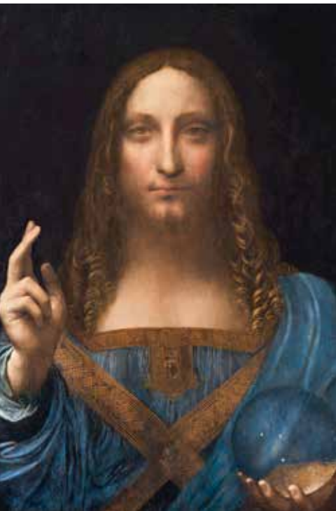
Leonardo da Vinci, Spasitelj svijeta, oko 1500.

biti otvoreni Božjem otajstvu i susretu s kršćanskom zajednicom što svaki vjernik treba živjeti i na osobnoj razini.