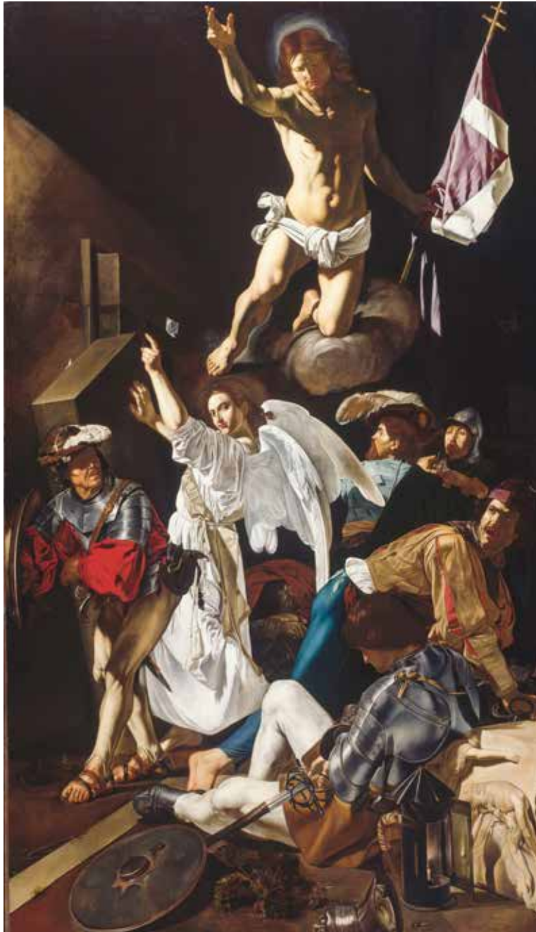
Francesco Buoneri, Uskrsnuće , 1619.

Uloga privatnih objava nije da poboljšaju ili upotpune konačnu Kristovu objavu, nego da pomognu da se u određenome povijesnom razdoblju Božja objava potpunije živi.