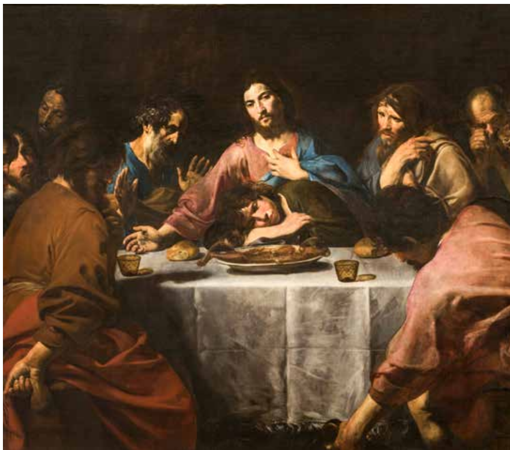
Valentin de Boulogne, Posljednja večera , 1625. – 1626.

renju nastojanja mudrosti. Sjedinjenje s njime u blagovanju euharistijske hrane doista je ostvarenje puta mudrosti u ovom zemaljskom životu. Istinska je, naime, mudrost u Isusu prepoznati Krista. No, to prepoznavanje treba biti prihvaćeno i potvrđeno vlastitim životom. To prihvaćanje ima i sasvim konkretne oznake i odjeke, od kojih ovdje ističemo one euharistijske. Prava je mudrost u Kristu prepoznati kruh života: »Ja sam kruh živi koji je s neba sišao. Tko bude jeo od ovoga kruha živjet će uvijek. Kruh koji ću ja dati tijelo je moje – za život svijeta,« (Iv 6, 51).