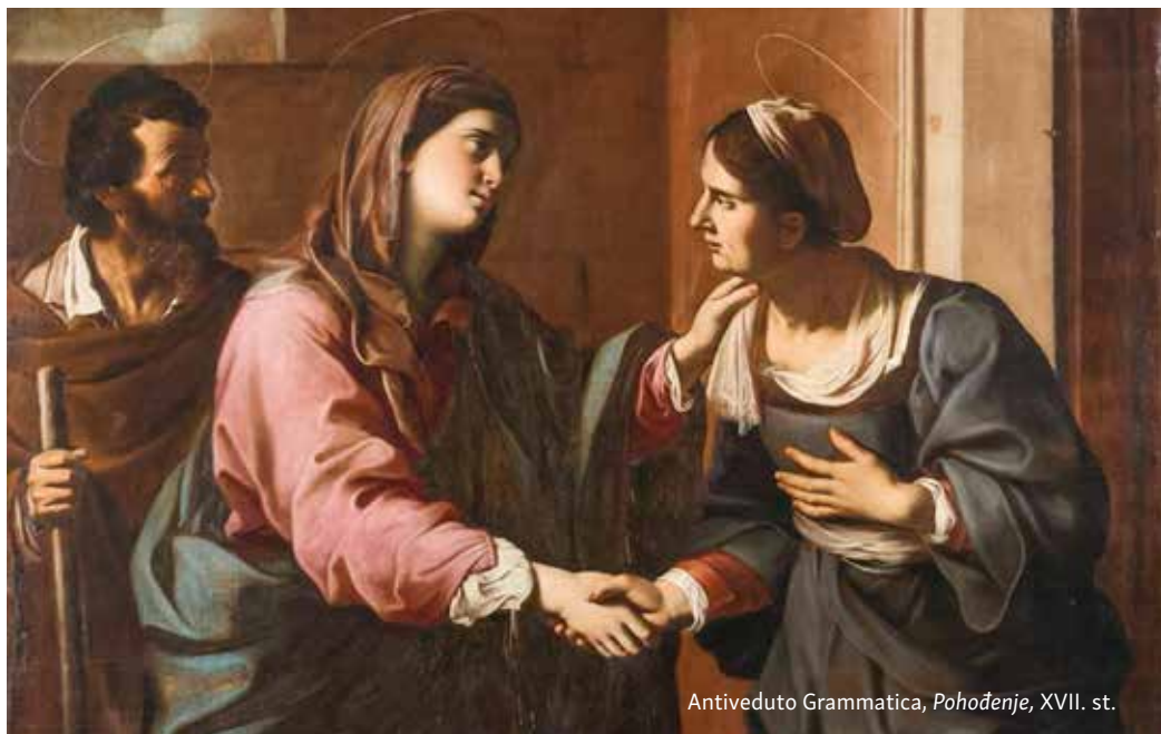
Antiveduto Grammatica, Pohodjenje , XVII. st.

sjajem ovoga svijeta, pohlepni, častohlepni, zavidni, umišljeni. O Čudesna, pomози nam da prestanemo sliniti za ovozemaljskim, da slinimo za tvojom čudesnom poniznošću.