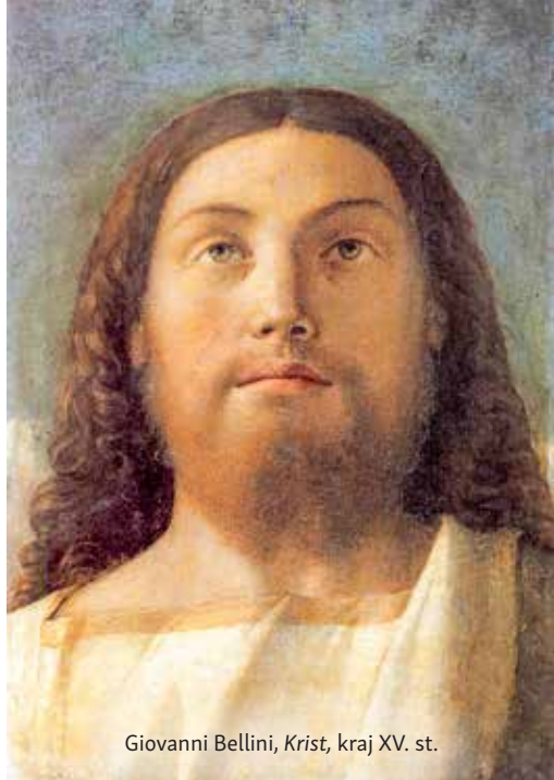
Giovanni Bellini, Krist, kraj XV. st.

Ovom je slikom genijalni slikar divno izrazio duboku čovjekovu težnju da traži istinu, istražujući sebe i svijet oko sebe, očiju okrenutih prema zemlji i uma otvorena za otajstvo. Otajstvo Preobraženja poziva nas da s poštovanjem pristupimo nedokučivoj tajni koju ljudska osoba krije u svom tijelu, kao što su nas učile stoljetna medicinska tradicija i profesionalna etika, te da svakoj osobi priznamo njezino neotuđivo dostojanstvo, da svratimo pozornost na pojedinačne ljude i njihove životne