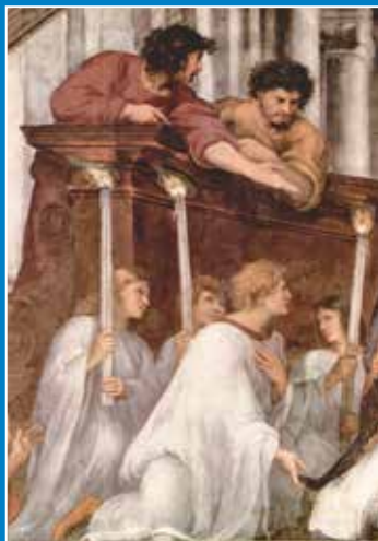
Raffaello Sanzio da Urbino, Akoliti (detalj), 1512.