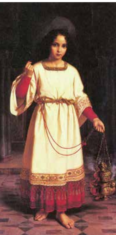
Abraham Solomon, Akolit (žena u službi kadioničara), 1842.

Paralelizam postavljenih službi. Ako u svakoj župi određeni broj naših laika postavimo u službe lektora, što će biti s ostalim vjernicima koji godinama čitaju čitanja u bogoslužju? Hoćemo li