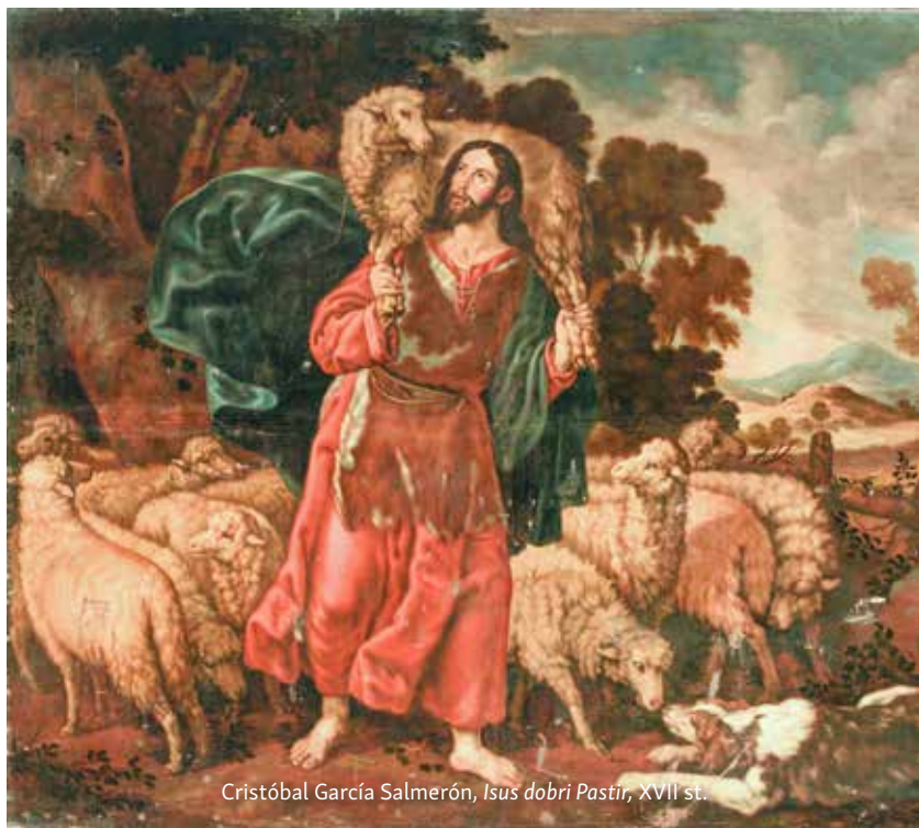
Cristóbal García Salmerón, Isus dobi Pastir , XVII st.

Tom svojom gestom dobrog pastira koji svojim naukom vodi svoje stado prema mjestu Božjeg počinaka i hrani ga dajući mu nebeski kruh rukama i po služenju svojih učenika, Isus pokazuje što za njega znači »samotno mjesto«, »u osami«. To je Božje srce ispunjeno ljubavlju prema čovjeku u kojem svaki čovjek može otkriti svoj identitet sina i kćeri, a time i svoj identitet brata i sestre.