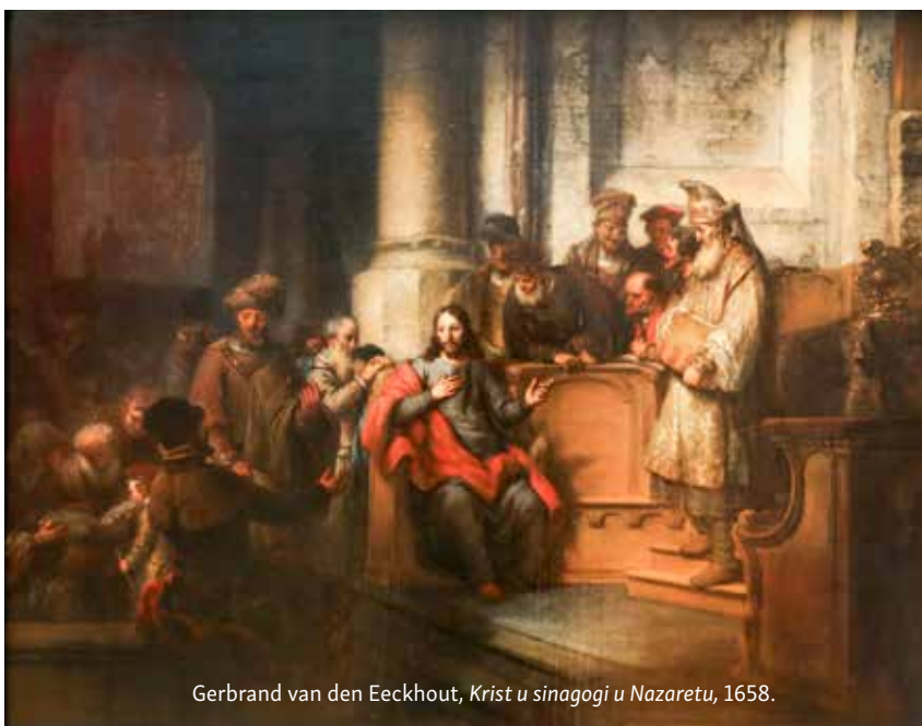
Gerbrand van den Eeckhout, Krist u sinagogi u Nazaretu , 1658.

Drugotnost o kojoj je ovdje riječ nije dakle ljudska različitost u odnosu na sve druge ljude, nego ona svoj izvor i uvir ima u transcendentnom, odnosno onostranom. Shvaćanje te iste onostranosti neće biti moguće ukoliko se čovjek vođen Duhom ne uputi prema otkrivanju nevidljivog svijeta. Svijeta koji se dohvaća ne tek razumom, nego prije svega dubokim nutarnjim životom duha. Tek tada svetac neće biti bez časti u svome selu, kraju ili zavičaju. Jer kako u njemu vidjeti uistinu sveca, ako ne otvarajući se poticajima Duha. Jer oči uistinu ne varaju, on jest Sin drvodjelje, znamo mu obitelj, a ipak je on snagom Boga nešto više.