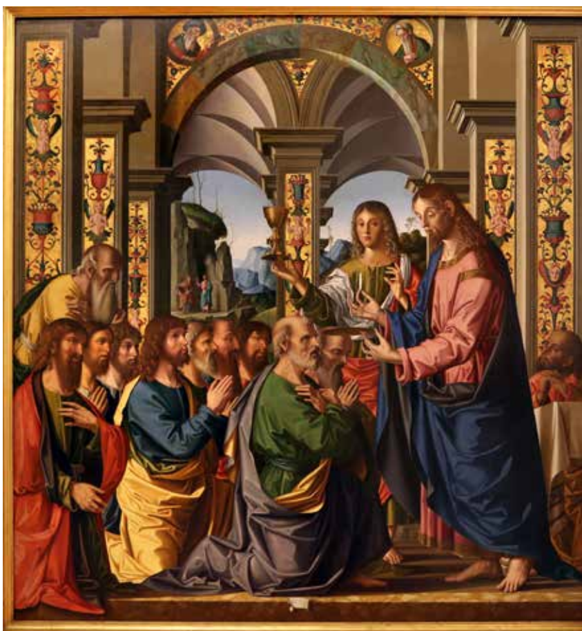
Marco Palmezzano, Pričest apostola , 1506.

Kada se zajednica vjernika okupi oko stola Riječi, kruha i vina, onda to čini s povjerenjem da u riječima, kruhu i vinu vidi živu prisutnost Života samoga. Isus koji je bio ubijen i uskrsnuo ostao je među svojim kao kruh od kojega oni žive i čiji život unose u svijet. Hrane se hranom za život vječni. Euharistija je sam Isus koji je s neba sišao i on je hrana za život svijeta. To više nije hrana kao mana ili kao umnoženi kruh kojim su ljudi tažili svoju tjelesnu glad i preživljavali u svijetu. Sada je to hrana za