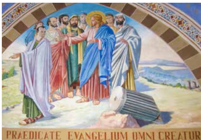
Lucibello Episcopio, Poslanje apostola , 1945.

Često je najlakše vjeru živjeti sam, u samoći svoje sobe. Najčešće i najzahtjevnije pak jest u krugu vlastite obitelji živjeti vjeru. Isus šalje po dvojicu svojih učenika. Grčka riječ za poslati jest apostelein (Mk 6,7: ἀποστέλλειν). Biti apostol Isusa Krista ne znači čast nego poslanje, trajna dinamika navješćaja Radosne vijesti, pri čemu su drugi korektiv i ispit našeg navješćaja. U srži kršćanina jest poslanje. Itekako je ovo aktualno i danas. Tko se dosađuje sa svojim poslanjem, pozivom, zanatom, ta osoba zaista nema niti volje niti snage ići među druge, biti »poslanik«. Onaj tko je oduševljen nečim ili nekim, radosno ide drugima. Možda nam je i poznata zgoda kada su razgovarali glumac u kazalištu i svećenik pri čemu je svećenik pitao glumca: »Pa kako je moguće da ljudi iz kazališta izlaze ozarena lica i pričaju još neko vrijeme o onome što su vidjeli i čuli?« Glumac je na to odgovorio svećeniku: »Jer se događa da