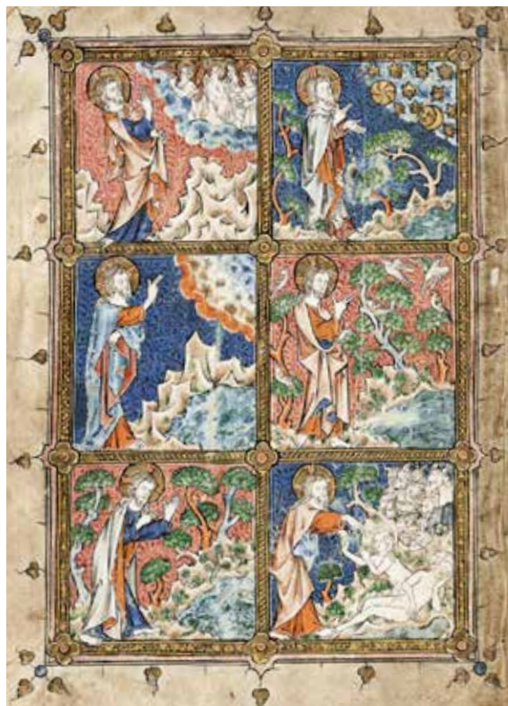
Michiel van der Borch, Stvaranje , 1332.

Nalazimo se na početku Svetoga Pisma unutar kojega pronalazimo mnoštvo izgovorenih Božjih Riječi. Netko bi mogao pomisliti da su Božje Riječi slične našim ljudskim naklapanjima,