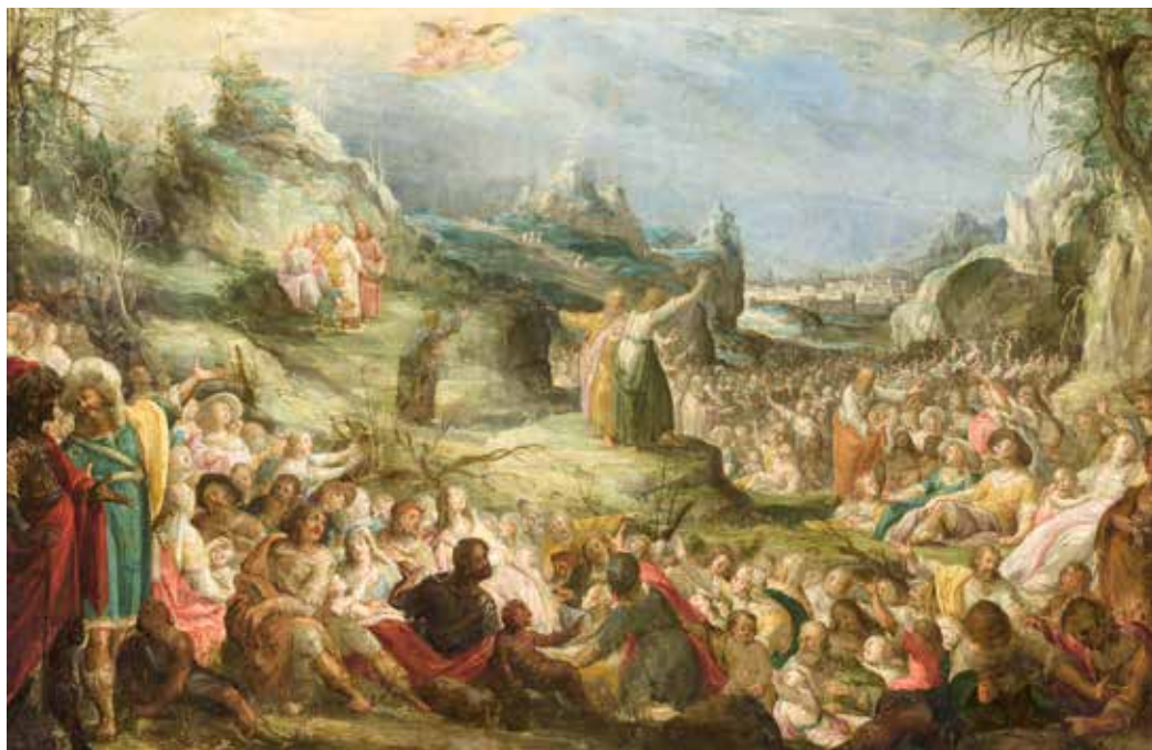
Vitus Heinrich, Čudesno umnažanje kruhova , 1640.

glad, ispuniti svaku prazninu. Naravno, evanđelist sve stavlja u vremensku blizinu najvažnijeg židovskog blagdana Pashe. Tu je prisutna i simbolika biblijskih brojeva, pet ječmenih kruhova i dvije ribice, broj sedam je simbol savršenstva i potpunosti, odnosno simbol stvaranja, ovdje konkretno simbol novog stvaranja. Trava na kojoj sjede slušatelji ukazuje na proljeće, kao i blizina Pashe, vrijeme rađanja novog života, vrijeme Uskrsa. Filip i Andrija ukazuju na materijalnu realnost, nedostaje hrane, premalo je novaca, samo dječak s pet ječmenih kruhova i dvije ribe, Isus čini veliki obrat kojim pokazuje da gospodari situacijom, da je on Bog, izvor života koji ispunja praznine i hrani čovjeka. On situaciju u kojoj nedostaje, odnosno nema ničega daje u obilju. Iz dva sirotinjska ječmena kruha i ribe, koje mu nesebično daje dječak, koji niti posjeduje niti privređuje, čini da bude dovoljno za sve i ostaje u obilju.