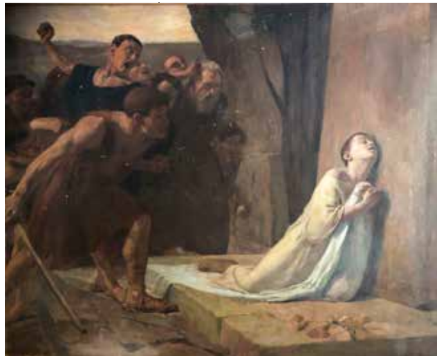
Achille-Eugène Godefroy, Mučeništvo svetoga Tarzicija , 1908.

Vjerojatno svjestan takvog shvaćanja službe akolita u predkoncilskom značenju, papa Franjo je 10. siječnja 2021. u Motupropriju » Spiritus Domini « odredio da se i žene mogu postaviti u službu lektora ili akolita. Ta odredba utemeljena je na promijeni članka 230 § 1 Zakonika kanonskog prava na načinu je izbačena riječ »muškarci« ( virī ). Početak toga paragrafa sada glasi: »Laici, koji imaju dob i vrline određene...«, tako da se postavljene službe lektora i akolita sada odnose i na žene.