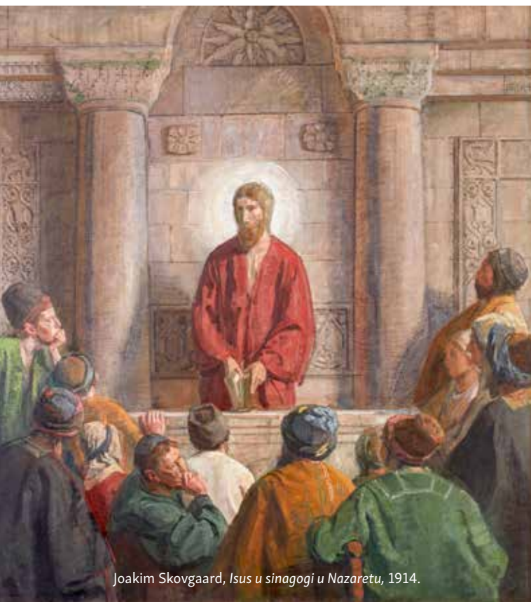
Joakim Skovgaard, Isus u sinagogi u Nazaretu , 1914.