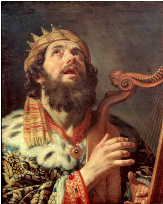
Gerard van Honthorst, Kralj David svira harfu, 1622.