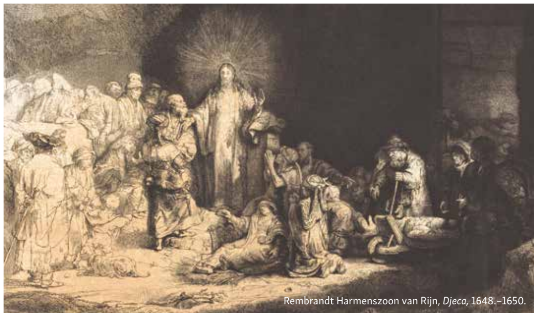
Rembrandt Harmenszoon van Rijn, Djeca , 1648.–1650.

Isus poziva k sebi sve koji su izmoreni i opterećeni i obećava da će ih odmoriti. Poziva uzeti na sebe njegov jaram i učiti od njega. Njegov poziv uvelike podsjeća poziv Mudrosti iz knjige Sirahove: »Pridite k meni, vi nepoučeni, u mojoj školi sjedite. Zašto da u tom oskudijevate, i da vam duše toliko žedaju? Otvorih svoja usta i rekoh: »Kupujte je bez novaca, podmetnite vrat svoj pod njen jaram i neka vam duše prihvate pouku. Tko je traži – blizu mu je, i čovjek odan nalazi je. Pogledajte očima svojim: kako sam se malo trudio, a mnogo spokoja stekao« (Sir 51,23-27). No za razliku od Mudrosti koja se obraća »nerazumnima« kako bi ih učinila mudrima kroz učenje, Isus se obraća onima koji su umorni od nepotrebnih tereta nametnutih različitim pismoznancima svih vremena (usp. 23,4). Njegov »jaram« – termin kojim su rabini opisivali poslušnost Tori – nije težak i ne sputava čovjeka, ne čini ga, drugim riječima, robom zakona i svih njegovih propisa, nego, sasvim suprotno, on je sladak , kao što je i njegov teret lagan . Isusov jaram je jaram koji ne ujarmljuje, a njegov teret ne opterećuje, jer »jaram ljubavi« nije teret koji treba nositi, nego su krila koja ustvari nose tebe!