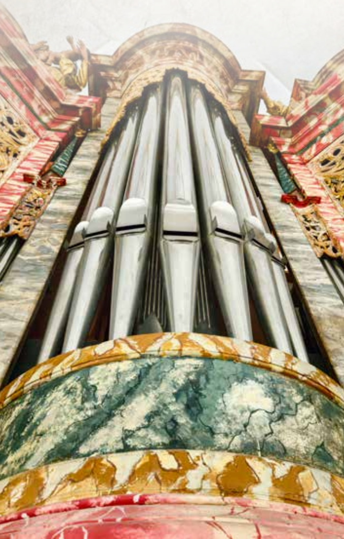
Orgulje u varaždinskoj katedrali, 1747., (obnovljene 1998.)

Zbog toga se ta sakralna glazba počela izvoditi u crkvi u obliku koncerta. Isto se