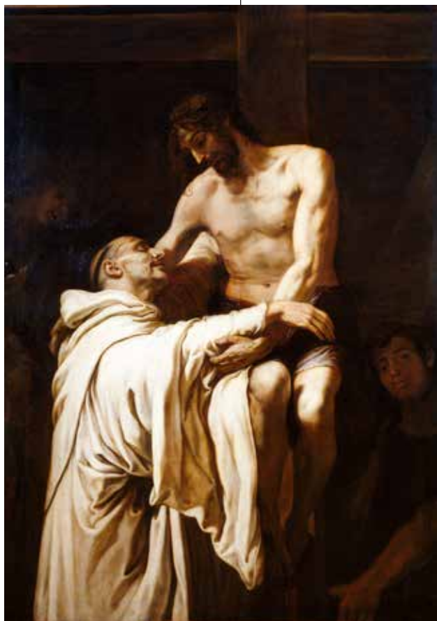
Francisco Ribalta, Krist grli sv. Bernarda iz Clairvauxa, 1625.-1627.

gdje anđeli i sveti kliču, pjevaju, hvale i slave Gospodina: »Pjevaju pjesmu Moj-sija, sluge Božjega, i pjesmu Jaganjčevu: Velika su i čudesna djela tvoja, Gospo-dine, Bože, Svevladaru!« (Otk 15,3) Zato će i sv. Augustin reći da u ovom životu još i recitiramo i pjevamo: recitiramo Božje riječi jer smo još u žalosti, uzdi-šemo i vapimo za vječnom domovinom; pjevamo Božje riječi, jer se već u našim srcima razlijeva pjesma vječne domo-vine. Iz svega rečenoga slijedi kakvo je pjevanje u Crkvi jedino dopušteno, a to je pjevanje ljubavi, ljubavi koja je razli-vena u srcima našim po Duhu Svetom i koja je odgovor na pjesmu ljubavi Isusa Krista, a po njemu na pjesmu Presve-toga Trojstva i svih svetih. Zato tekst, ali i boja, ton glasa treba biti boja glasa Isusa Krista. Jer, kršćani se prepoznaju i po boji i po tonu glasa. Netko ima takvu boju i frekvenciju glasa da sve zveči i ječi oko njega, para uši drugima svojim napadnim glasom. Zašto? Jer mu glas nije usklađen s pjesmom ljubavi Isusa Krista. Mnogi su teolozi nastojali opisati istinsko pjevanje u Crkvi, a time i tekst pjesama, kao i boju glasa. Jedan od ponajboljih opisa pruža nam sv. Bernard iz Clairvauxa ( Epistula