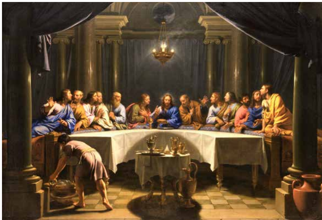
Jean Baptiste de Champaigne, Posljednja večera , 1678.

nema razlike između svetog crkvenog prostora i svjetovnog prostora onda je sve dopušteno, onda nema problema što izvodimo, a čini se da je danas sve više prisutno takvo shvaćanje.