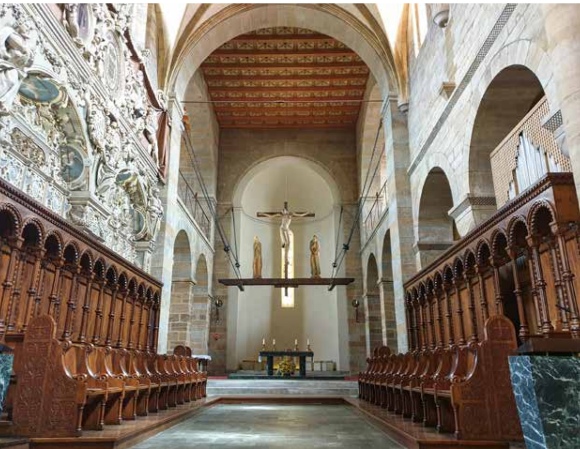
Pogled prema prezbitteriju bazilike Uznesenja Blažene Djevice Marije, Seckau, (Austrija)

Glazbenici i pjevači izbjegavati će zauzimanje prostora prezbitterija