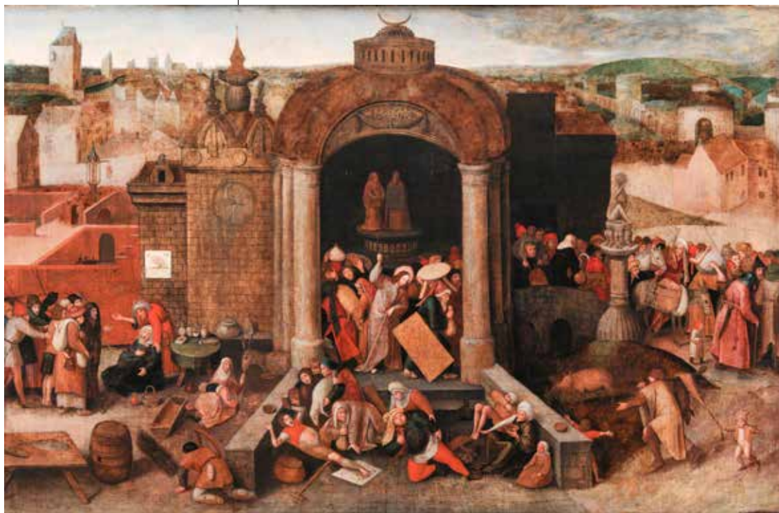
Pieter Brueghel stariji, Krist tjera trgovce iz hrama , 1569.

Da bi se problemi vezani za koncerate olakšali u pastoralnom djelovanju, Kongregacija za bogoštovlje i disciplinu sakramenata 1987. godine objavljuje dokument pod naslovom O koncertima u crkvama (De concentibus in ecclesiis) . Taj dokument doista je trebao olakšati tu problematiku svim upraviteljima katedrala, bazilika i crkva diljem svijeta glede davanja dozvola za održavanje koncerata. Kongregacija za bogoštovlje i disciplinu sakramenata želi im na ovaj način pomoći da donesu korisne pastoralne odluke pri čemu će imati na umu sociokulturalnu situaciju određenog ambijenta. Dokument prilazi problematici na objektivan način shvaćajući da je glazba važna pojava u svakoj civilizaciji. Ljudi ju žele slušati i u crkvama kako bi pomoću nje uzdizali svoj duh.