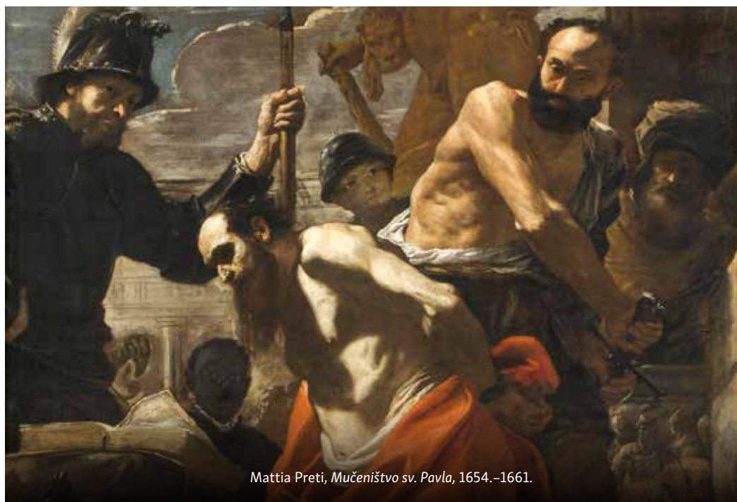
Mattia Preti, Mučeništvo sv. Pavla , 1654.–1661.

biti naš sudac i o njemu ovisi hoćemo li biti vječno sretni ili vječno nesretni.