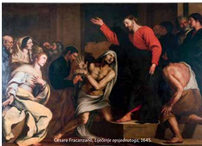
Cesare Fracanzano, Liječenje opsjednutoga , 1645.

Drugi zadatak koji Isus daje svojim radnicima jest liječenje bolesti i nemoći. Iznova je, dakle, na planu evanđeoski prikaz snage Isusove osobe u kojoj je nastupilo kraljevstvo Božje koje se manifestira kroz liječenje bolesti i nemoći. I to je element koji je važno uočiti. Nisu učenici i njihove sile oni koji liječe bolest i nemoć. Oni su posrednici snage uskrsloga Krista. Smatramo kako je to važno naglasiti zbog naravi društva u kojemu živimo. Društva koje je prečesto navezano na spektakularne manifestacije svetoga, koje doista često ne smjera na ono što je istinski bitno u kršćanstvu, a to je sam Krist. On je djelatan u sakramentima i u svemu što Crkva čini. Ipak valja pojasniti i još nešto. Naime, bolest shvaćena očima biblijskog pisca stanje je često nestabilnosti ljudske osobnosti u onoj mjeri u kojoj se ljudska nutrina i stanja duha protive stanju njegova tijela i obrnuto. Iz toga razloga je prvi nalog radnicima taj da vladaju nad nečistim dusima, a onda shodno tome slijedi i nalog da liječe bolest i nemoć. Očito je da evanđelist želi dovesti u korelaciju stanja nutrine sa stanjima bolesti tijela. Tema je to koja, čini nam se, postaje sve