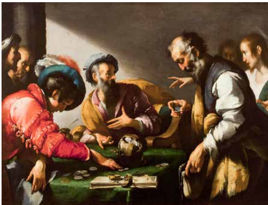
Bernardo Strozzi, Pozivanje svetog Mateja , oko 1622.

Isusov stav traži od nas da shvatimo kako Isusova ljubav koja je došla upravo zbog grešnika nadvladava farizejski moral. Isus se brine prvotno za siromašne, bolesne i grešnike. U Mateju vidimo da je potvrđeno Isusovo poslanje, njegov povlašten izbor za grešnike. Milosrđe je pravo Božje lice; Utjelovljena ljubav je kompendij Zakona i proroka. Sin Božji ne dolazi suditi. On je prijateljska Božja ruka koja se u svojoj ljubavi i