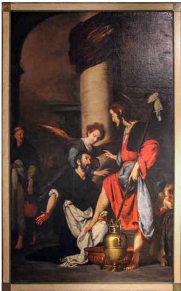
Bernardo Strozzi, Sv. Augustin pere Isusu noge, oko 1625.

I na koncu Isus dodaje da ni tako malo dobro djelo, kao što je dodati komu čašu hladne vode, neće ostati nenagrađeno. Pri tome on primatelj te čaše naziva »najmanjima«, a