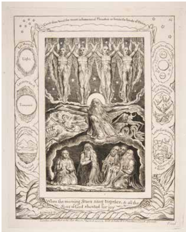
William Blake, Knjiga o Jobu , 1826.

da je sv. Augustin napisao da »pjevu oni koji ljube« – cantare amantis est , tko ne pjeva, potvrđuje ne samo da ne ljubi, nego da ne ljubi Božje riječi, ne ljubi Boga u njegovim riječima koje nisu ništa drugo negoli pjesma ljubavi. Tu pjesmu ljubavi osobito susrećemo u Pjesmi nad pjesmama . Ona se i zove »Pjesma« jer ljubav nije ništa drugo doli pjesma: »Cvijeće se po zemlji ukazuje, vrijeme pjevanja dođe i glas se grličin čuje.« (Pj 2,12) To je Pjesma jer se u njoj pjeva o ljubavi između Gospodina i Crkve, Gospodina i svake pojedine duše. Tko u riječima te Pjesme, kao i u svim riječima Sv. pisma, ne osjeća pjesmu ljubavi i tko ne želi pjevati, kao da na sve riječi, ta Božja glazbala, navlači pokrivala hladnoće, dosade i ispraznosti. Zato je pjevanje za nas vjernike odgovor na Božje pjevanje. Gospodin nam je dao svoje riječi kao pjesmu da ih pjevamo zajedno s njim, da pjevamo pjesmu ljubavi. I crkvena, sveta glazba u svojem izvornom i najboljem izričaju nije ništa drugo nego oslušivanje Božje pjesme u riječima, ona je izricanje i prericanje te iste pjesme u melodiju koja se potom razlijeva duboko u srce vjernika te rasplamsava osjećaj pobožnosti, kako su to doživjeli sv. Augustin i ovdje spomenuta pobožna redovnica. U suprotnom je, bez pjesme, Božja riječ mrtva, pretvorena u riječi ovoga svijeta, koje se ne pjevaju, koje ne izazivaju pjesmu, klicanje. A time je i vjera mrtva, jer je to vjera bez ljubavi, vjera koja više ne pobuđuje pjesmu. Isus