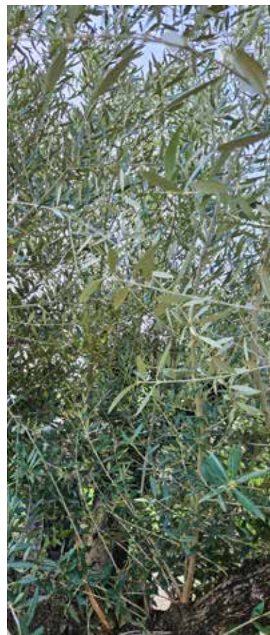
Ljekovito lišće masline

Uljem su isprva bili pomazani samo kraljevi ( 1Sam 10,1; 16,13; 1Kr 1,39; Ps 89,21). Nakon babilonskog progonstva (VI. st. pr. Kr.) pomazani su i svećenici. I proroci su imali pomazanje Duhom, ali to je općenito bilo duhovno, a ne ritualno. Iako proroci nikada nisu bili pomazani uljem u pravom smislu, ipak su nazvani »pomazanicima« ( Iz 61,1), jer su bili posvećeni i izabrani od Boga za određenu misiju ( Rivista Liturgica 37 (1989) 2-3, 271.). Njima je priopćen Duh Božji, koji ih je učinio sposobnima izvršiti zadatak za koji su bili određeni. Zaharija pod svojim perom ističe viđenje o dvije masline i njihovu dragocjenost ukazujući na kralja Zerubabela, koji je bio predstavnik vremenite moći, te velikog