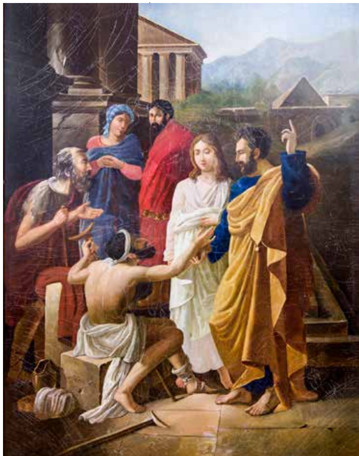
Théophile Gautier, Ozdravljene uzetoga, XIX. st.

No, postoji s druge strane i sazrijevanje, to jest rast »novog stvorenja«. Gestom polaganja ruku izražava se kontinuitet životnog procesa s primljenim sakramentom krštenja, u cilju razvoja novog stvorenja »u Kristu« do njegove punine, kao što Isusova Pasha ima svoje ispunjenje u silasku Duha Svetoga na Pedesetnicu.