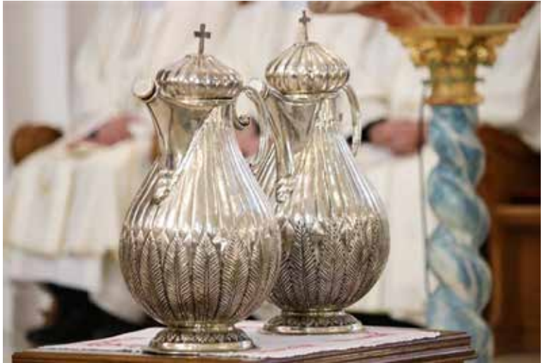
Vrčevi s uljima na misi posvete ulja

Vrlo je važno da vjernici sudjeluju u ovoj misi i da u njezinu slavlju prime sakrament euharistije. Prema tradiciji, Misa posvete ulja slavi se u četvrtak Velikoga tjedna. Ako se kler i narod teško skupe toga dana s biskupom, može se ovo slavlje pomaknuti na neki drugi dan, ali blizu Uskrsa, te uvijek treba uzeti vlastitu misu. Naime, nova krizma i novo katekumensko ulje moraju se koristiti u noći Vazmenog bdjenja za slavlje sakramenata kršćanske inicijacije. Trebalo bi slaviti samo jednu misu, s obzirom na njezinu važnost u životu biskupije, a slavlje bi trebalo biti u katedralnoj crkvi ili, iz pastoralnih razloga, u nekoj drugoj posebno uglednoj crkvi. ( Biskupski ceremonijal , 274-276). ■