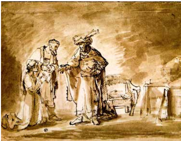
Rembrandt Harmenszoon van Rijn, Estera pred kraljem Ahasverom , oko 1655.

Također ukazuje na to da je Bog preuzeo osobu koju je on pozvao i koja je stoga posvećena (kralj, svećenik, prorok i mesija). Pomazanje simbolizira duhovno prodiranje u dušu čovjeka božanskom snagom. Prodirući u njega, Bog mu daje snagu i zaštitu da ispuni poslanje. Potvrđenik postaje Božjim vlasništvom. Kralj, prorok i svećenik, pomazani od Gospodina, njemu su u službi, stavljaju