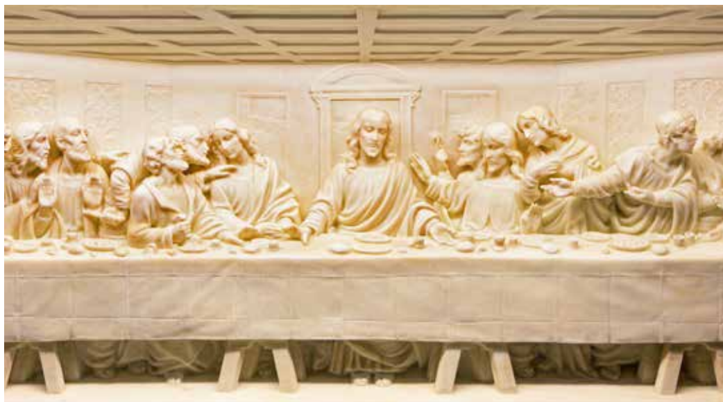
Mramorni reljef Posljednje večere na oltaru crkve svete Marije Pomoćnice u Rimu, XX. st.

života i jamstvo budućnosti. Bog se spustio i sjeo za stol njihova života, te ih hrani očekujući da tako žive da budu dostojni njegove prisutnosti. Zato ih je i poticao da gozbenim slavljem slave događaj spasenja koje je bilo u začetku njihove slobode dok ne dođe konačno oslobođenje.