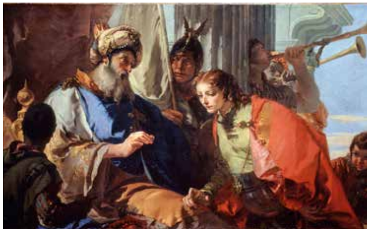
Giovanni Battista Tiepolo, Faraon daje prsten Josipu, 1734.

kao termin se javlja u općenitom smislu ( Izl 39,6; Tob 7,14; Jer 32,10 ) ili se spominje termin pečatni prsten ili pečatnjak kao znak autoriteta i vjerodostojnosti određene osobe poput kralja ili druge važne ličnosti ( Post 38,18.25; Izl 28,36; Sir 32,5 ). Najpoznatiji primjer je pečatni prsten kojega faraon daje Josipu, sinu Jakovljevu, da vrši vlast u njegovo ime ( Post 41,42 ). Također se spominje služba pečatnika, osobe zadužene za čuvanje pečata ( 2Sam 20,24 ). Mogu se zatim izdvojiti razni primjeri dokumenata koji imaju pečat kao pisma, isprave ili ugovori koji su zapečaćeni kraljevskim prstenom ( 1Kr 21,8 ) ili prstenom neke druge važne osobe ( Neh 10,1-2 ). Čovjek nešto zapečaćuje ( Sir 45,24 ) ili se može zapečatiti određena stvar ili predmet ( Tob 9,5; Jb 41,7 ) pečatnim prstenom ( Dn 6,18 ). Bog također ima vlast zapečatiti nešto u čovjekovu životu ili utisnuti biljeg ( Jb 14,17 ). Može zapečatiti viđenje ( Dn 8,26; Iz 29,11 ), objavu ( Iz 8,16 ), knjigu proročanstava ( Dn 12,4 ) ili riječi ( Dn 12,9 ). Na kraju, smrt je zapečaćena i iz nje nema povratka ( Mudr 2,5 ), slično je zapečaćen i udes ( Ps 81,16 ), a i na sam grijeh je stavljen pečat ( Dn 9,24 ).