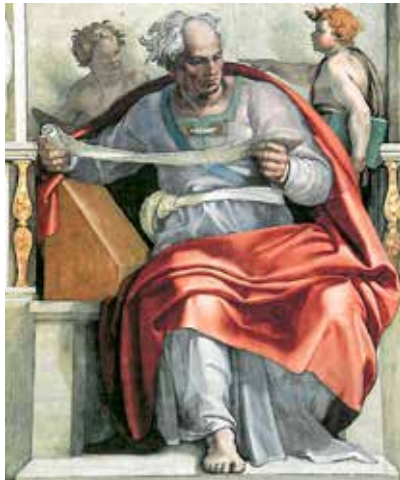
Michelangelo Buonarroti, Prorok Joel, 1508. – 1512.

Originalnost/izvornost »polaganje ruku/ruke« (ἐπιτίθημι τ. χεῖρα) proizlazi iz odnosa sa Starim Zavjetom. Nailazimo ga u Septuaginti kao prijevod samak yad . Biblijski egzegeti uočavaju važnost razlike upotrebe jednine i množine »ruku/ruke«. Polaganje ruke (samak yad) : ritualna gesta koju nailazimo u kontekstu žrtvovanja, kojom se prinositelj poistovjećuje s prinošenom žrtvom (Lev 1,4.10; 4,4.24.29.33). U množini polaganje ruku (samak yadin) označava prijenos nečega sa subjekta na primatelja, izvan bilo kakvog žrtvenog konteksta (Izl 29,10.; 15,19; Lev 3,2.8.13; 4,15; 8,14.18.22; 16,21; 24,14; Neh 8,10.12; 27,18.23; Pnz 34,9; 2Kr 29,23).