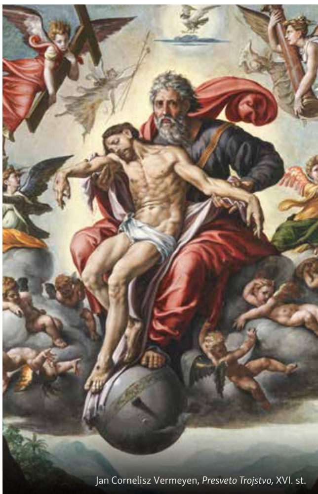
Jan Cornelisz Vermeyen, Presveto Trojstvo , XVI. st.

Petar u svojoj poslanici savjetuje da onaj tko trpi kao kršćanin, zbog vjere, slavi Boga zbog toga, neka se ne stidi, jer često nas uzrok i svrha patnje mogu zbuniti i