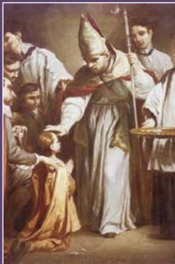
Giuseppe Maria Crespi, Sakrament sv. potvrde, 1712.