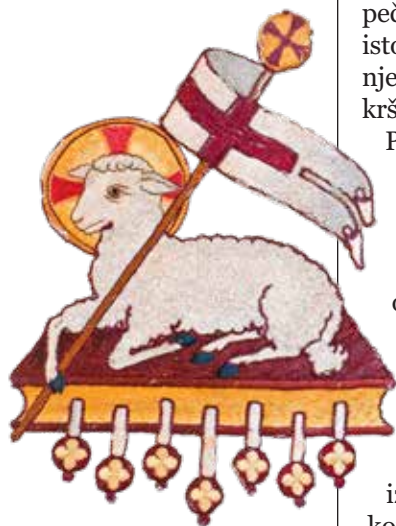
Detalj s misnice

Samo žrtvovani Jaganjac koji stoji uspravno, odnosno uskrsli Krist, može otvoriti ovu knjigu, otkriti njezin sadržaj, pokazati konačni smjer povijesti i ostvariti svoju pobjedu nad zlom i smrću.