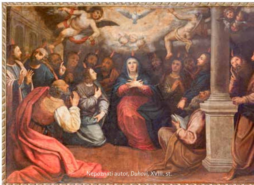
Nepoznati autor, Duhovi , XVIII. st.

Ljudi koji svakodnevno opraštaju jedni drugima i govore razumljivim jezikom o veličanstvenom Božjem djelovanju u sve-miru i prirodi, povijesti i društvu, postaju