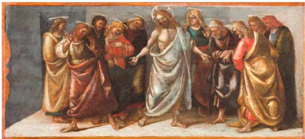
Luca Signorelli, Uskrsli Krist ukazuje se svojim učenicima , 1514.

njegova uskrsnuća. Takav zaključak bio bi upravo suprotan onomu što evanđelist Luka želi pokazati. Premda uskrslo tijelo nema potrebe za materijalnom hranom, a Isus ipak jede komad pečene ribe, to je evanđelistu argument za , a ne protiv povijesnosti Isusova uskrsnuća. On polazi od logike da tijelo uskrslog Isusa, kako smo istaknuli na početku, nadilazi zemaljske kategorije, ali isto tako može u njim i ući.