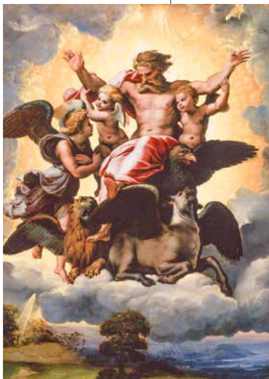
Raffaello Santi da Urbino, Ezekielova vizija, 1518.

antropomorfno, a Bog nije čovjek, pa je i to kod vjernih Židova zasigurno doprinijelo izričitosti zabrane. K tomu tu je i jasno profilirana želja za izbjegavanjem magijskih praksi u kojima su pogani zazivali imena svojih bogova pred njihovim likovnim prikazima.