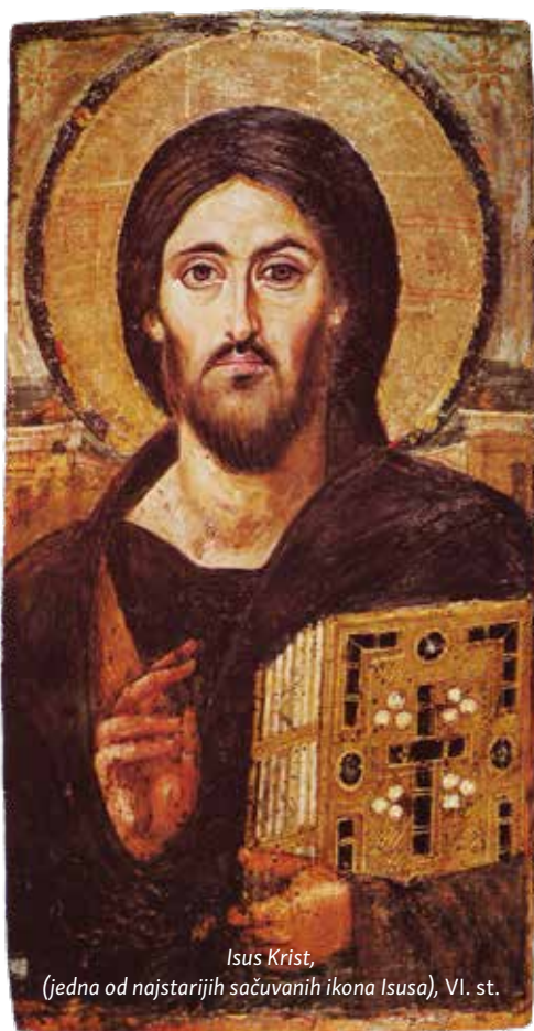
Isus Krist, (jedna od najstarijih sačuvanih ikona Isusa), VI. st.

S tvarnost umjetničkog stvaralaštva usko je povezana s činom gledanja. Svako umjetničko djelo u sebi sadrži jednostavnu imitaciju stvarnosti te uključuje rekonstrukciju osjećajnog subjekta. Djelo umjetnika je povezano s psihofiziološkim funkcijama vida.