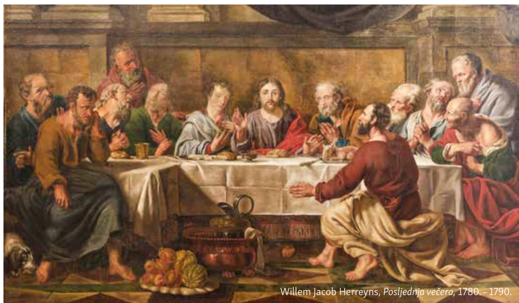
Willem Jacob Herreyns, Posljednja večera , 1780. – 1790.

muke i smrti jer se izrazom položiti život želi izraziti dragovoljno predanje svoga bića koje ide sve do radikalnog oplijenjenja samoga sebe što Krist i čini predanjem u smrt (usp. Fil 2,6-11).