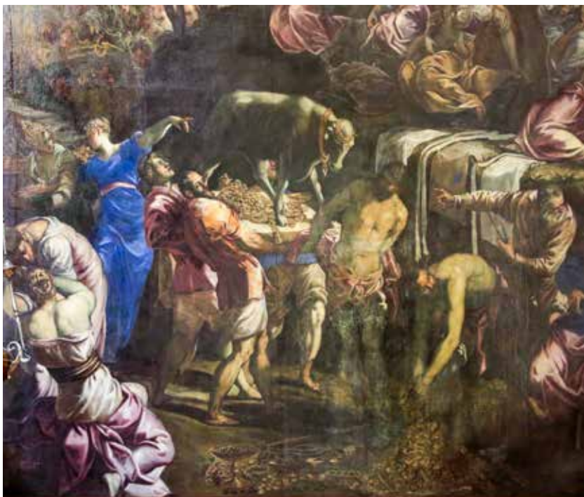
Jacopo Tintoretto, Klanjanje zlatnom teletu , 1562. – 1564.

4. Slike ovoga svijeta bude žudnju za ovim svijetom. Stvaraju, osobito danas, pohotu za ovim svijetom, za njegovim sjajem, a to