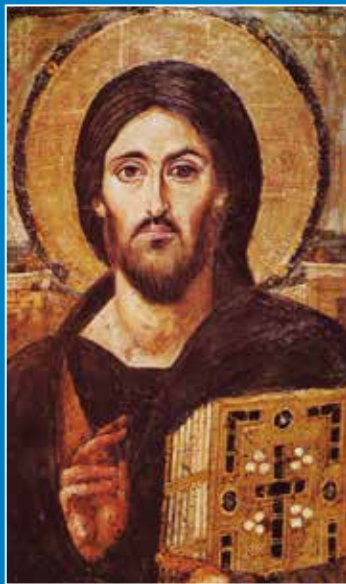
Nepoznati autor, Isus Krist , (jedna od najstarijih sačuvanih ikona Isusa), VI. st.