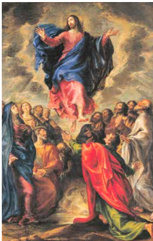
Francisco Camillo, Uzašašće , 1651.

Svetkovina Uzašašća govori nam i o drugačijem Kristovu prisustvu na zemlji. On više nije prisutan na tjelesan već na duhovan način. Krist koji je uzašao na nebo ostao je s nama zauvijek na očima nevidljiv način. On živi u Crkvi i po njoj nastavlja djelo spasenja. Stoga je jako važno posvijestiti sebi, ne samo teoretski već prožimajući time svoju cjelokupnu životnu praksu, ono što je papa Benedikt XVI. jednom naglasio, a to je da pored stvarne Isusove prisutnosti u Crkvi, u sakramentima, postoji i ona druga stvarna Isusova prisutnost u malenima, u