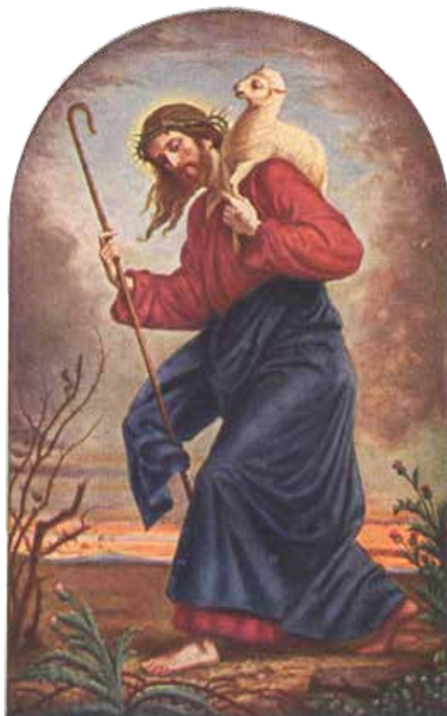
Josef Kehren, Dobri Pastir , 1872.

Isus ne želi ići skupiti sve raspršene ovce kako bi ih ogradio novom ogradom. Izvorno značenje na grčkom aulē (αὐλή) ne znači tor, nego ograda i Isus želi osloboditi od ograda koje su postavili lopovi i kradljivci i koji su htjeli iskoristiti ovce. Isus je iz ograde hrama sve rastjerao. Ograda institucionalne religije koja je propovijedala Boga trgovca zatvorila je ljude u njihovom poznavanju Boga i ograničila ih. Isus ih tjera van, ne kako bi ih ponovno zatvorio, nego oslobodio za novi odnos s Bogom gdje nema potrebe nešto Bogu dati kako bi Bog onda bio blagonaklon, jer Bog sve daje besplatno. Nakon što je oslobodio od krive religioznosti, Isus želi osloboditi i druge ovce koje se među drugim ogradama. Tako npr. ograde u kojima su zatvorene mnoge osobe koje su