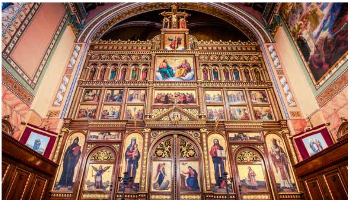
Ikonostas u župnoj crkvi sv. Ćirila i Metoda u Zagrebu

prilično zahvalnom, a i korisnom, likovni prikazi kršćanskih otajstava sve više ulaze u kršćansku umjetnost. Dovoljno je pogledati ono što je sačuvano od antičkih, odnosno kasno antičkih, pa i ranosrednjovjekovnih izvora, pogotovo crkvenih građevina. Bilo na istoku ili zapadu, u to doba nastaju i do danas u nekima su očuvani mnogi izvanredni mozaici. Povijest umjetnosti, pogotovo kršćanske može o razvoju oblika i likovnih prikaza Gospodina, Majke Božje i svih ostalih likova u kompozicijama reći mnogo više. U teološkom diskursu mogli bismo najjednostavnije zaključiti da od izvorne alegorije, čiji smisao ostaje, tijekom vremena, a i očito zahtjeva samoga bogoslužja, sve više se ujednačavaju likovni prikazi Krista, Blažene Djevice Marije, apostola i ostalih svetaca. Na taj način slikovni prikazi, slike, postaju dijelom liturgijske umjetnosti. Forme kojima se rečeni likovi prikazuju, na izvjestan način postaju stereotipni prikazi, koji se koriste čak i izvan liturgijske umjetnosti, praktično sve do danas. Kroz povijest će se razvijati različiti umjetnički izričaji i prikazi, pogotovo na zapadu, jer osim samih likovnih prikaza koji se rade u/na dvodimenzionalnom mediju, na zapadu su jako česte i skulpture, kipovi i reljefi. Kršćanski istok zadržava pretežno formu ikone i mozaika.