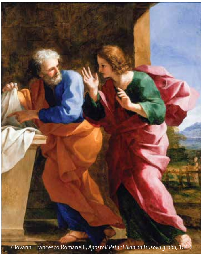
Giovanni Francesco Romanelli, Apostoli Petar i Ivan na Isusovu grobu , 1640.

Iako vrlo kraka rečenica i čestitka, njome se svjedoči vjera u Isusovo uskrsnuće, ali isto tako i drugima se želi da postignu uskrsnuće, da jednom o uskrsnuću mrtvih budu spašeni. Zato nas u tom kontekstu i upozorava blage uspomene kardinal Franjo Kuharić: »Koliko puta ponovljena čestitka! Nebrojeno puta u prošlosti, sadašnjosti, a bit će i u budućnosti ‘dok on ne dođe’ (usp. 1Kor 11, 26). Opasnost je da to postane uobičajena riječ i da izbljedi njezin tako potresan i tako bogat sadržaj. A radi se o