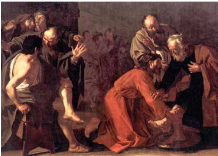
Dirck van Baburen, Isus pere noge apostolima , 1616.

praktično istu stvar Isus učiniti učenicima. Pranje nogu o kojemu govori evanđelje Mise večere Gospodnje, ali možda čak i ovo od Velikoga ponedjeljka alegorijski možemo promatrati kao oris krštenja, odnosno cjelokupne kršćanske inicijacije, kojom svaki kršćanin otajstveno proživljava i biva pritjelovljen mucu, smrti i uskrsnuću Kristovu ( Neka to izvrši za dan mog ukopa! ). Daljnje tumačenje alegorijskih elemenata nalazi se u euhološkim elementima. Zborna i darovna molitva Velikog ponedjeljka u deprekativnom dijelu najavljuju plodove muke Kristove za one koji proslavljaju Muku. Zaziv zborne kaže: ...daj da po mucu tvoga Jedinorođenca odahnemo . Darovna moli za plod muke: vječni život .