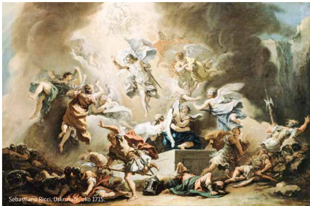
Sebastiano Ricci, Uskrsnuće , oko 1715.

Isusa Krista, našeg Spasitelja. Samo umrijevši zajedno s Kristom, možemo uskrsnuti zajedno s njime i zadobiti novi život. To je već sada moguće po krštenju, jer krštenjem dobivamo novi život. Liturgija vazmenoga bdjenja blagoslovom vode iskazuje čast vodi kojom nas Krist pere i preporuča, a kao vjernici obnavljamo krsna obećanja u duhu povezanosti s novokrštenicima. Ponovno se odričemo Sotone i svih djela njegovih te iskazujemo čvrstu želju da želimo prijanjati uz Boga i njegov plan spasenja. Potvrđujemo tako svoje čvrsto opredjeljenje za život po Evanđelju. I na kraju ovoga svetog Vazmenog bdjenja blagujemo Tijelo Isusovo pod prilikom kruha, postajemo jedno s njime, kušamo predokus buduće slave.