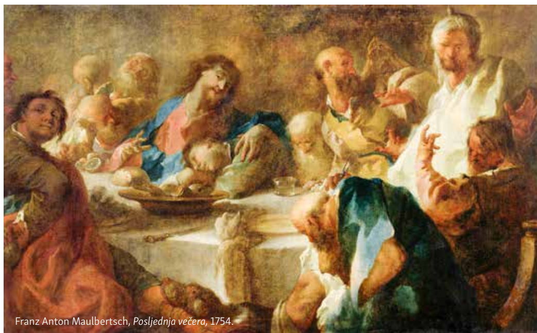
Franz Anton Maulbertsch, Posljednja večera , 1754.

osobnoga mira, nego je najprije poziv i poslanje. Pozvan sam da upoznam Isusa Krista, njegov nauk i njegova djela. Poslan sam da svojim životom budem Krist drugima.