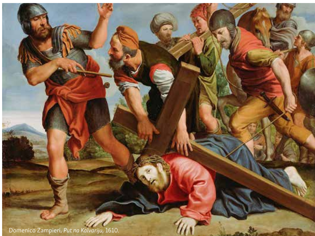
Domenico Zampieri, Put na Kalvariju , 1610.

lagan i lagodan, prizemljen i površan život. Istina nisu retorička pitanja poput Pilatova, već snažna želja da otkrijemo temelj života i da u posvemašnjoj dosljednosti živimo na tom temelju, pa ako treba da se poradi toga hrvamo s nedaćama i izazovima. Istina nije tek hrpa izgovorenih riječi ili par nesuvislih misli, već je sadržaj koji ispunja srce i dira dušu u svoj njezinoj snazi.