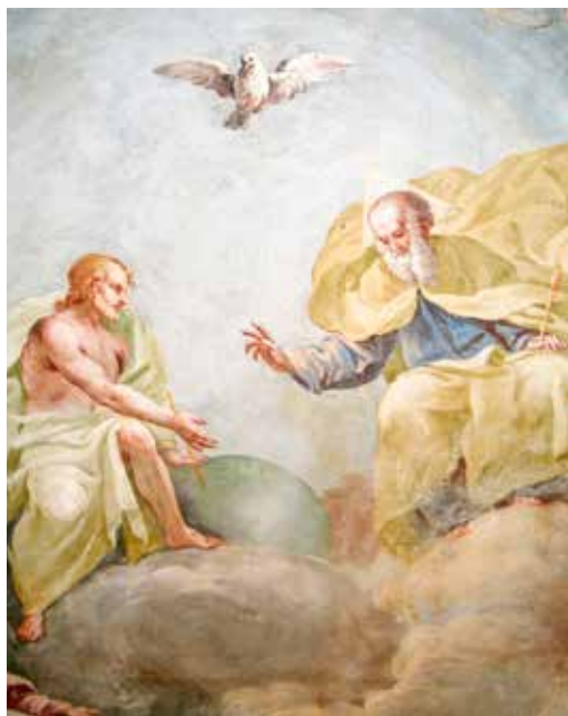
Luca Rossetti da Orta, Presveto Trojstvo , 1739.

jer je zajedno s Isusom suuskrsnulo i čitavo čovječanstvo.