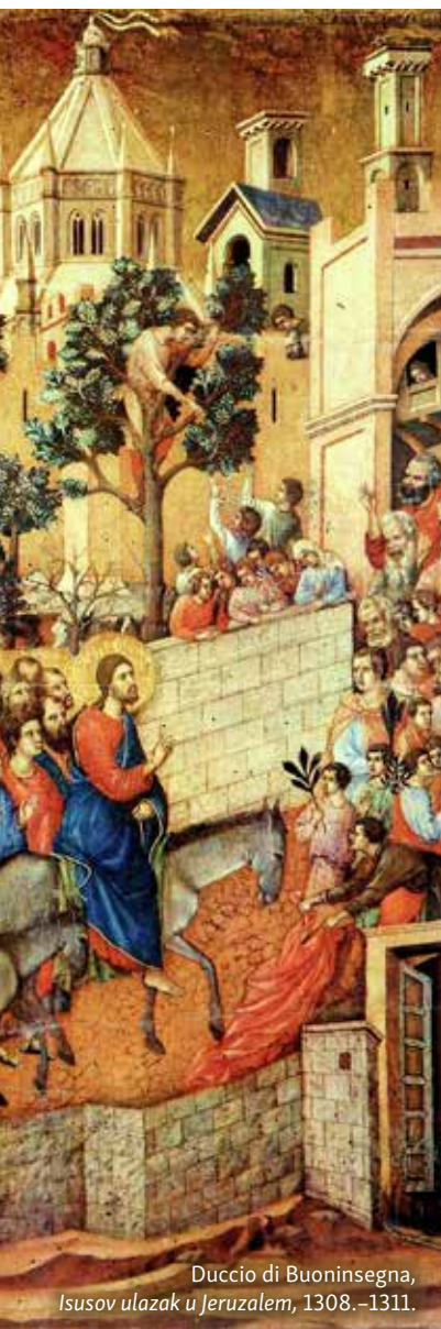
Duccio di Buoninsegna, Isusov ulazak u Jeruzalem, 1308.-1311.