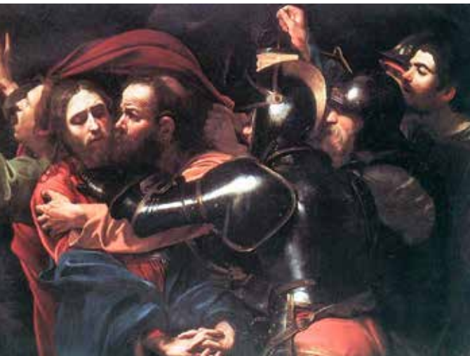
Michelangelo Merisi da Caravaggio, Judina izdaja Krista , 1603.

Evanđeoski izvještaj Velike srijede donosi nam tradicionalnu kronologiju: srijeda je naime u kršćanskoj pobožnoj tradiciji dan u koji je Juda izdao Isusa za trideset srebrnika.