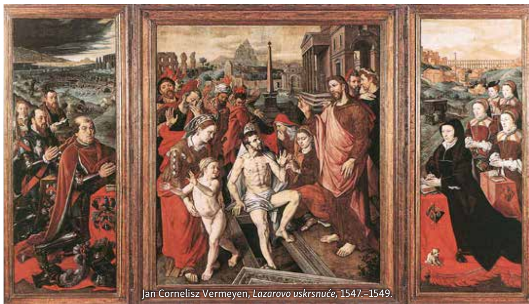
Jan Cornelisz Vermeyen, Lazarovo uskrsnuće , 1547.–1549.

Isus ne kaže da ima moć uskrsnuti mrtve. On kaže da je on uskrsnuće i život. Vjera u njega znači imati život bez obzira na prijetnju smrću. Vjera u njega daje život i onima koji umru. Upravo je to slučaj s Lazarom. On je umro, ali vjera u Isusa može učiniti da bude živ. Ovdje slutimo razlog Isusovog otezanja s odlaskom u Betaniju. Kao da je htio da sestre iskuse bratovu smrt kako bi mogle iskusi na koji je način Isus život i uskrsnuće. Ovo je ujedno i najснаžnija pouka o njegovoj smrti i uskrsnuću koji će vrlo brzo uslijediti. Marta u svom odgovoru više ne spominje brata. Njezina vjera nije vjera u mogućnost bratova povratak u život. Ona je posve usmjerena na Isusa. Ona vjeruje Isusu da je on Krist, Sin Božji, Mesija.