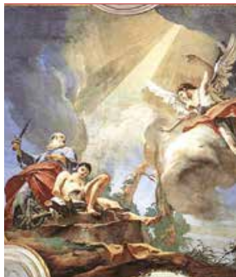
Giovanni Battista Tiepolo, Žrtvovanje Izaka, 1726.-1729.