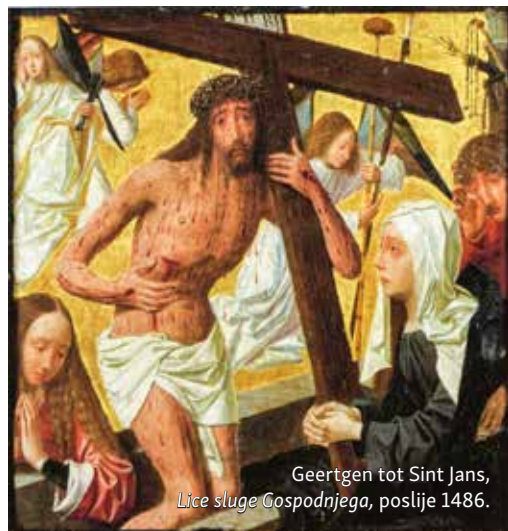
Geertgen tot Sint Jans, Lice sluge Gospodnjega, poslije 1486.

Ipak već u Starome zavjetu prorok Izaija promatra slugu Božjega kao onoga koji podnosi fizičke patnje, makar ih nije ničime zaslužio. U četvrtoj pjesmi o sluzi Gospodnjem (usp. Iz 52,13-53,12), što je čitamo kao prvo čitanje na obredima Velikoga petka, lice sluge Gospodnjega neljudski je iznakaženo, te obličjem više nije naličilo na čovjeka. Sluga Gospodnji podnosi tjelesne patnje, te prorok Izaija tumači da su njegove tjelesne patnje dio zastupničkog trpljenja za druge ljude. Ne samo da taj čovjek nije zgriješio i na neki način skrivio svoje patničke dane vlastitim ponašanjem, već se njegove patnje opisuju kao zastupničko trpljenje za druge: »Za naše je grijeha on proboden, za opačine naše satrt. Na njega pade kazna radi našega mira, njegovom se