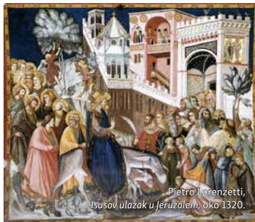
Pietro Lorenzetti, Isusov ulazak u Jeruzalem, oko 1320.

Ovo općeljudsko iskustvo prihvaćenosti i odbačenosti od strane dragih osoba, u vrlo kratkom vremenskom razdoblju, prošao je također naš Gospodin Isus Krist. Kod njegovog ulaska u Jeruzalem mnoštvo je klicalo: »Blagoslovljen koji dolazi u ime Gospodnje!«, prostirući svoje haljine po putu kojim je on hodio, da bi ga vrlo brzo nakon toga svjetina odbacila vičući: »Neka se razapne!«. Dok je postupanje mnoštva donekle razumljivo, jer se mase mogu manipulirati, ipak nas začuđuje ponašanje njegovih učenika koji su s Isusom živjeli gotovo tri godine. Jedan ga je od njegovih učenika izdao, drugi ga je u odlučnom