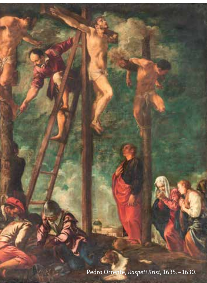
Pedro Orrente, Raspeti Krist , 1635. – 1630.

P okušat ću ovdje zapisati pet riječi pouke o otajstvu križa. Bit će to samo mala pojašnjenja velikoga otajstva, u nadi da ona ne će biti odveć daleko od istine.