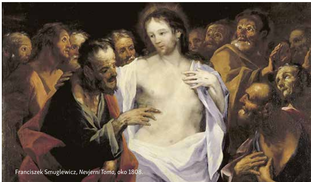
Franciszek Smuglewicz, Nevjerni Toma , oko 1808.

čovjeku i svim ljudima – ‘svjetla i snage da može odgovoriti svom uzvišenom pozivu’ « (Redemptor hominis, 14).