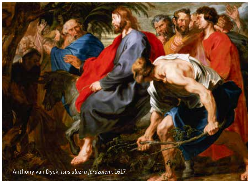
Anthony van Dyck, Isus ulazi u Jeruzalem , 1617.