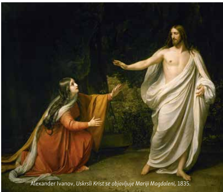
Alexander Ivanov, Uskrsli Krist se objavljuje Mariji Magdaleni , 1835.

Marko ovaj izvještaj ne završava oduševljenjem žena. Naprotiv! Unatoč tome što su sva njihova pitanja odgovorena one bježe od groba. Ispunjene su strahom i trepetom.