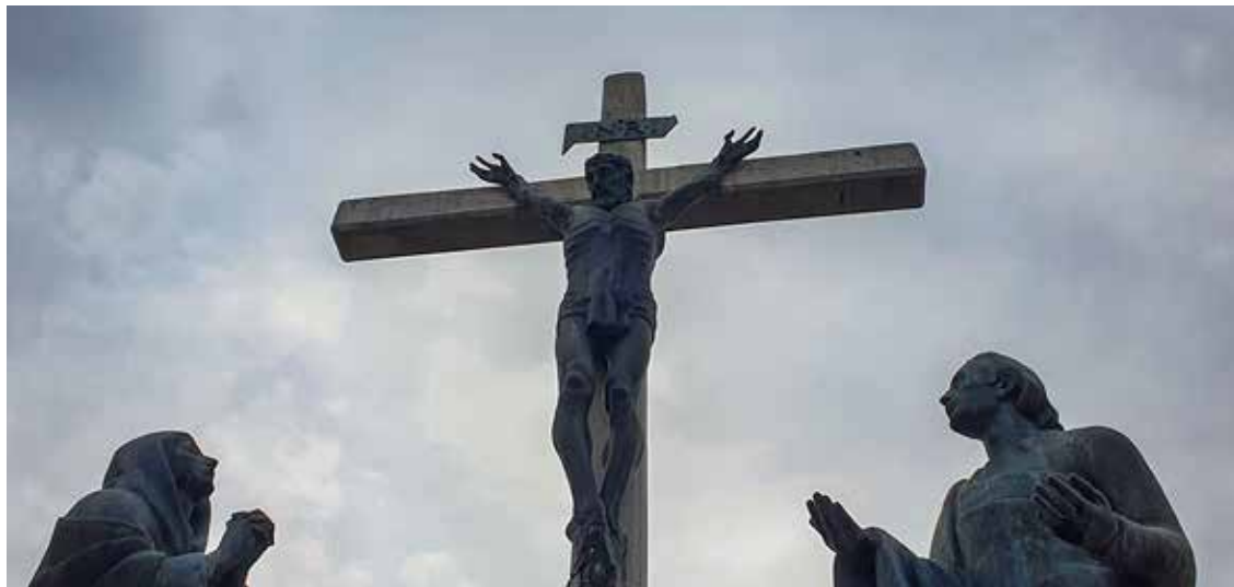
Ante Orlić, Isus umire na križu , 1977. (XII. postaja bistričke kalvarije)

Križ kao središnji simbol obuhvaća cjelokupni život kršćanina