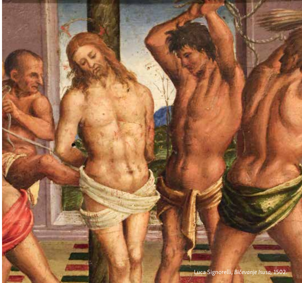
Luca Signorelli, Bičevanje Isusa, 1502.

napast svih nas malodušnost i pesimizam, a osobito u naše vrijeme kada se govori samo o problemima, o negativnim stvarima. Stoga na putu prema nebu moramo moliti za optimizam, za entuzijazam, sjećajući se obećanja koje je dobio Konstantin Veliki: » In hoc signo vinces! – U tom ćeš znaku pobijediti!« Jer svi smo mi pozvani na pobjedu, i to u znaku križa.