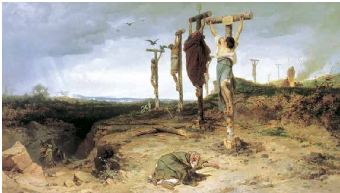
Fyodor Bronnikov, Raspeća na križevima u vrijeme Rimskog Carstva, 1878.

Božjim oprostjenjem. »Prođi gradom Jeruzalemom i znakom 'tau' obilježi čela sviju koji tuguju i plaču zbog gnusoba što se u njemu čine!« (Ez 9,4). Talmud, interpretirajući simbol i vrijednosti simbol 'tau', ovaj dio teksta tumači na sljedeći način: Na čelu pravednika bio je ispisan 'tau' plavim obilježjem, dok su bezbožnici nosili 'tau' krvavim znakom. 'Tau' se tako smatrao simbolom koji predstavlja život i smrt.