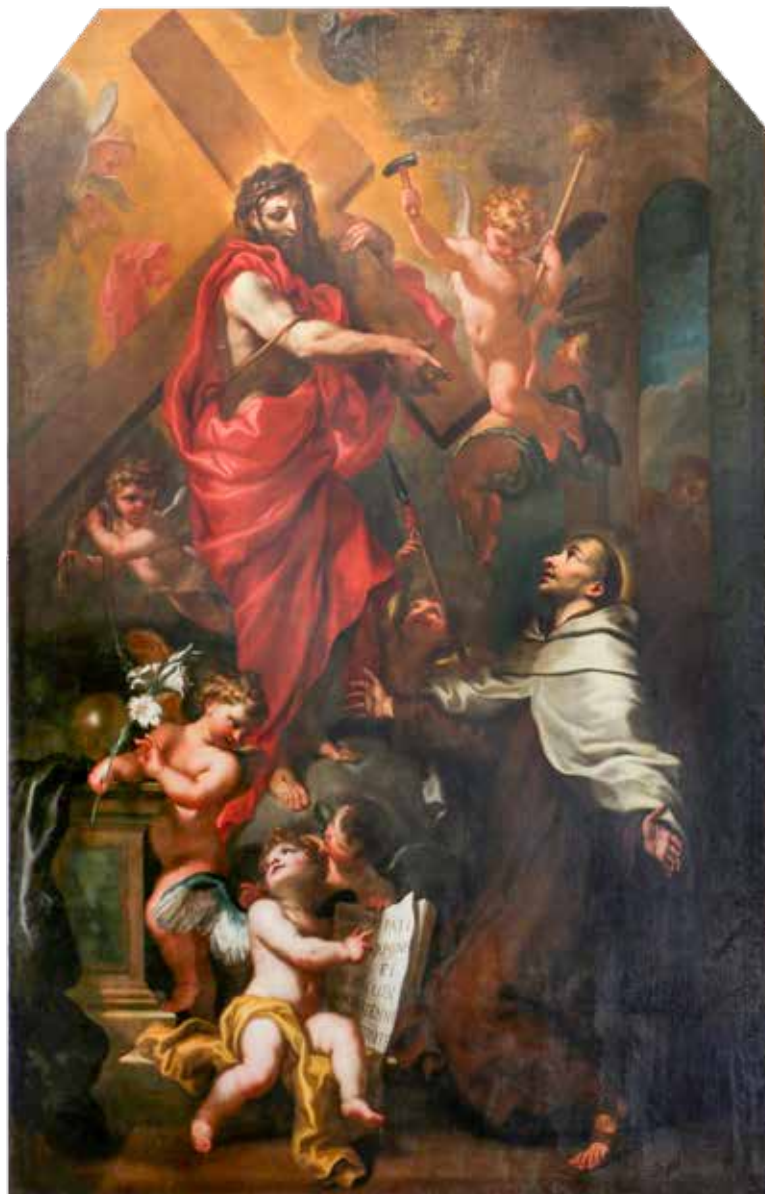
Domenico Piola, Isus se ukazuje sv. Ivanu od Križa, 1675.

od hrane preko medija pa do svakodnevnoga ulickavanja. Zato treba poljubiti križ, zagrliti ga te odlaziti svakoga dana u duhovno vježbalište, udarati svoje tijelo, da se očituje »uvijek umiranje Isusovo na tijelu«, da se tako na tom smrtnom tijelu može očitovati »život Isusov« (2Kor 4,10-11). Poljubi križ i razapni svoje tijelo da ono nalikuje Kristovu tijelu na križu. Gdje nema našega tijela, gdje je naše tijelo kao nešto nama tuđe, tu nema ni svijeta, ni njegovih ispraznosti. Ostaje samo Kristova ljubav u nama, postajemo tako duhovni, jer Duh počinje djelovati u nama: »Koji su Kristovi, razapeše tijelo sa strastima i požudama. Ako živimo po Duhu, po Duhu se i ravnajmo!« (Gal 5,24-25)