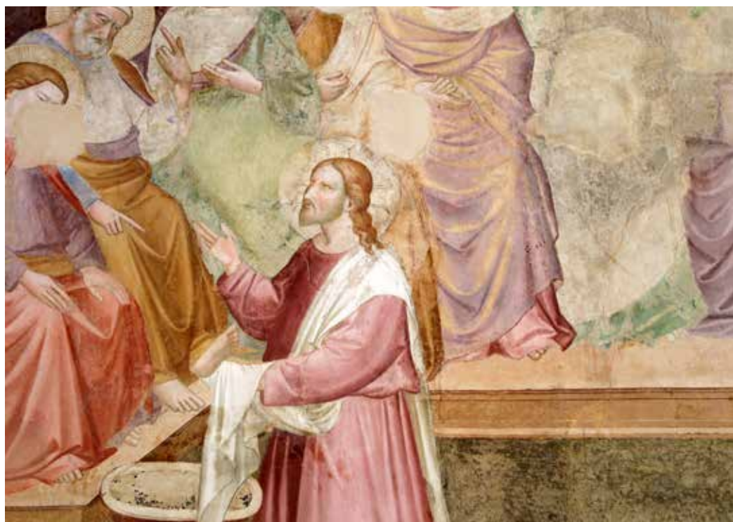
Niccolò Gerini, Pranje nogu , 1395.

nam ne omogućuje kretanje dalje i gledanje naprijed. Isus učenike oslobađa od posvećivanja pažnje onomu što ih nije dostojno i osposobljava ih i oslobađa za novost života.