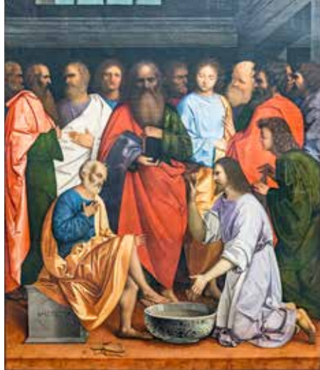
Anthony van Dyck, Pranje nogu , 1500.

je tijelo moje – za vas. Ovo činite meni na spomen.« Tako i čašu po večeri govoreći: »Ova čaša novi je Savez u mojoj krvi. Ovo činite kad god pijete, meni na spomen.« Doista, kad god jedete ovaj kruh i pijete čašu, smrt Gospodnju navješćujete dok on ne dođe.