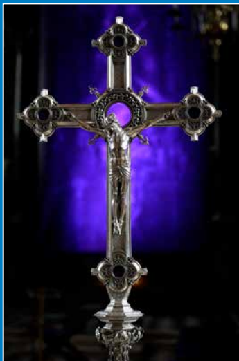
Procesijski križ u Bečkoj prvostolnici