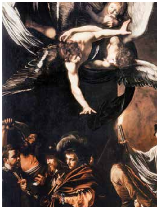
Michelangelo Merisi da Caravaggio, Tjesna djela milosrđa (žedna napojiti) , 1606.–1607.

Ova se nedjelja naziva i Gluha ( Glušnica ). Tjedan prije Cvjetnice u starini se nazivao tjedan Muke . U subotu prije Glušnice , prije I. večernje, bio je običaj da se prekrivaju slike i kipovi ljubičastim platnom sve do vazmenog bdjenja. Taj običaj vuče podrijetlo iz srednjega vijeka, kada se između oltara i vjernika razapinjalo veliko platno. Zašto? Dva su tumačenja: ljudi u ono vrijeme nisu imali kalendare, pa im je to bio