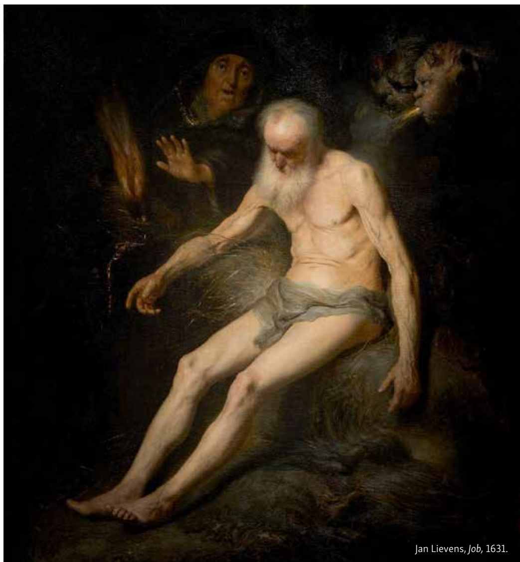
Jan Lievens, Job , 1631.

rečeno, postom smo upereni protiv crapule , sitosti ovdje na zemlji. Ne želimo biti siti ovdje, kako bismo se sitali Bogom. To naše sveto klaćenje, to svete lebdenje između nebesnika i zemnika kazuje nam da kršćanski post ima smisla samo ako se njime kršćanin trudi doći do Boga koji je iznad nas. Ljudi ne poste, jer nemaju Boga iznad sebe, a to znači da nemaju nikoga iznad sebe. Dakle, ljudi ne poste jer ne vjeruju u Boga. Ili pak poste, ali poste kako bi opet ostajali kod sebe, kako bi jačali svoj egoizam,