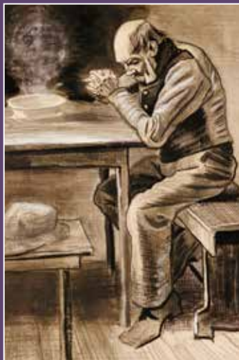
Vincent van Gogh, Molitva , 1882.