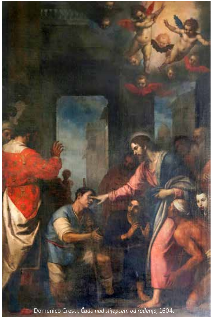
Domenico Cresti, Čudo nad slijepcem od rođenja, 1604.

Nakon što je rekao učenicima da slijepac od rođenja nije slijep zbog ničijega grijeha, Isus nastavlja: »nego je to zato da se na njemu očituju djela Božja.« (Iv 9,3b). Potom je on sam odmah očitovao djelo Božje učinivši ono što samo Bog može učiniti. Slijepcu od rođenja podario je vid. Oči mu je premazao blatom koje je načinio pljunuvši na zemlji, poslao ga da se opere u kupalištu Siloamu, i slijepac je progledao.