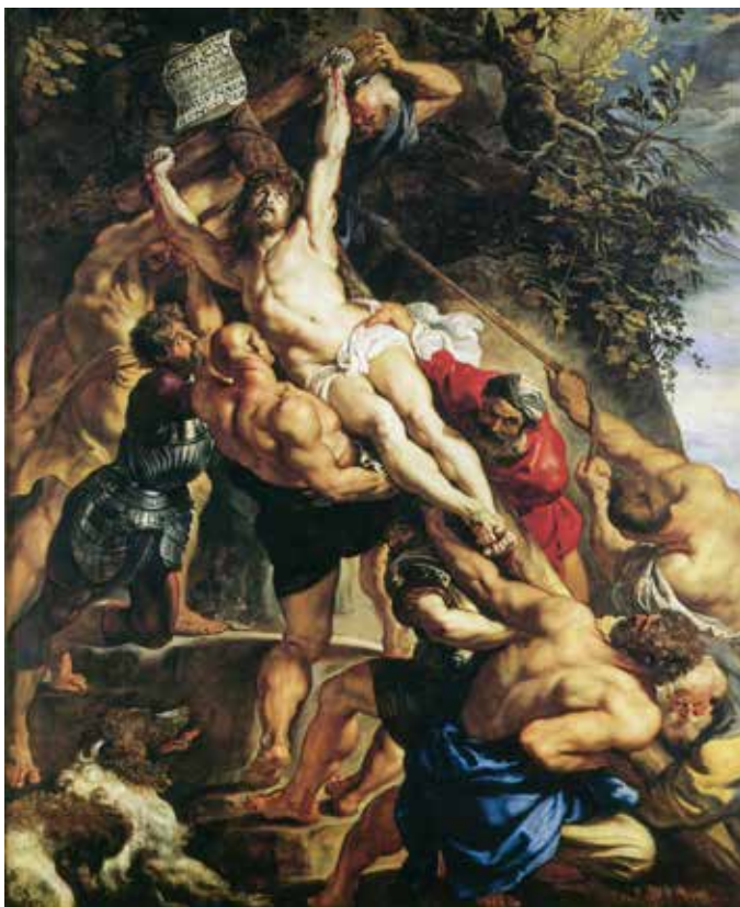
Peter Paul Rubens, Podizanje križa , oko 1610.

Posljednja rečenica današnjeg evanđelja nije još jedna usporedba s onim što smo čuli od starih i novim tumačenjem koje donosi Isus, nego jedan imperativ: »Budite savršeni kao što je savršen Otac vaš nebeski!« Taj imperativ proizlazi iz onoga što jesmo: stvoreni na sliku i priliku Božju, sinovi i kćeri nebeskog Oca, pozvani smo biti kao