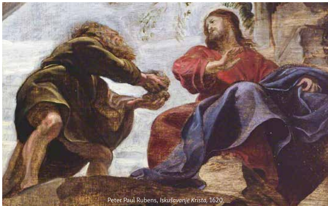
Peter Paul Rubens, Iskušavanje Krista , 1620.

borbe, gdje đavao ne pristupa kao protivnik Boga, nego maskiran u primamljive ponude, kojima čovjeka odvaja od Boga. Prva kušnja je izazivanje da Isus potvrdi svoje božanstvo pretvaranjem kamenja u kruh. On mu odgovara citatom iz Ponovljenog zakona (8,3) i pokazuje snagu Božje Riječi koja raskrinkava đavolsku zamku. Zatim ponovno kuša Isusovo božanstvo, tražeći od njega senzacionalno skakanje s vrha Hrama. Isus odgovara riječima iz Psalma 91,11-12, kako se ne smije iskušavati Boga. Kod treće kušnje napasnik je potpuno razotkriven, njegova skrivena namjera da se postavi na mjesto Boga, očituje se u pokazivanju svih kraljevstava svijeta i traži od Isusa da mu se ničice pokloni. Isus ponovno citira Sveto pismo, ( Pnz 6,13). Sotona je sada razgolićen, otkriven, pala je svaka njegova maska.