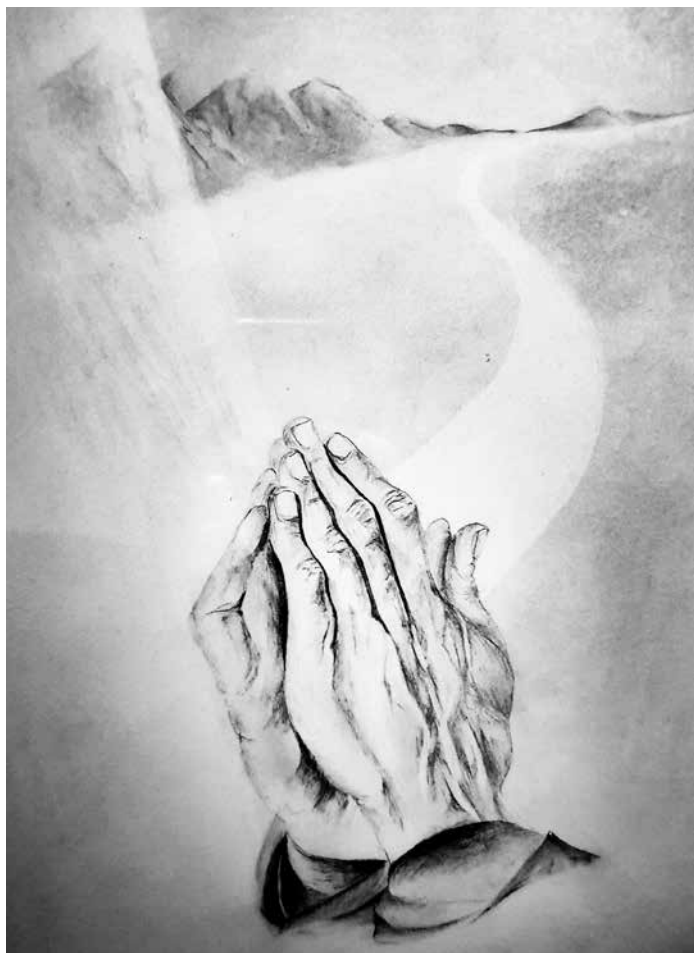
M. K., Molitva , 2005.

načinjen postom onda rađa dostojne plodove. Molitva ne dokida post, dapače, ona živi od posta. Ali vrijedi i obratno, odnosno, i post se oblikuje molitvom.