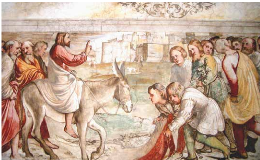
Girolamo Romani, Isusov ulazak u Jeruzalem , 1530.–1534.

kratka homilija. Slijedi ophod u crkvu. Pjevaju se antifone Židovska su djeca i psalmi te himan Slava, čast i hvala ti . Pri ulasku u crkvu pjeva se ulazna pjesma. Ako je imao plašt, svećenik ga skine i odjene misnicu. U misi se čita ili pjeva Muka prema ciklusi A, B ili C pri čemu nema svijeća ni kađenja, puk se ne pozdravlja, a evanđelistar se ne znamenjuje. Muka se može čitati po ulogama, a uloga se Kristova, ako je moguće, ostavlja svećeniku. Prikladno je da se Muka pjeva, kao što je u nas redovito običaj. Misa ima vlastito predslavlje.