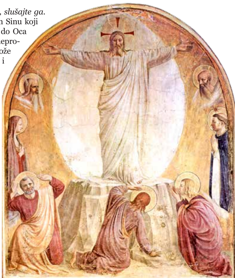
Beato Angelico, Preobraženje , 1440.

Želimo li iz svega do sada navedenoga izvući poruke za naš duhovni život onda ćemo reći slijedeće. Kao prvo vidimo da je uistinu važno u životu kršćana ne pobrkati dvije stvarnosti: materijalno i nematerijalno. Petar griješi jer u ono što je onostrano, odnosno Božje, želi uplesti ono što je isuviše ljudsko i materijalno što se očituje u pravljenju sjenica. S druge strane njegova je pogriješka i to što proslavljenost gleda kao nešto što je lišeno muke i smrti, a samim time nebo i istinsku duhovnost koja vodi do neba svodi na lijepi osjećaj koji se postiže bez osobnog trpljenja i suobličavanja muci i smrti Isusa Krista. Samim time i nama daje veliku lekciju koju ujedno potvrđuje istinitom i sam Isus u ovome evanđeoskom odlomku. Riječ je naravno o istini kršćanstva, a ona je da se do proslavljenosti (neba) dolazi tek kroz muku i smrt. Time se potvrđuje istinitost Isusove osobe. Jer ne treba zaboraviti da je evanđeoski tekst snažan upravo iz razloga što je pisan iz iskustva proživljene vjere u osobu Isusa Krista, a ne tek kao narativ koji se tek treba dogoditi. Evanđelje se dakle već obistinilo i njegovu snagu prenose nam biblijski pisci već stoljećima. Možda