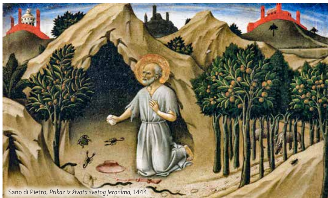
Sano di Pietro, Prikaz iz života svetog Jeronima, 1444.

prodaju i daju siromasima (Mt 19,21), žele biti potpuno siromašni kako bi bili potpuno bogati u njemu.