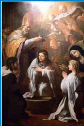
Luca Giordano, Krštenje sv. Augustina, XVII. st.