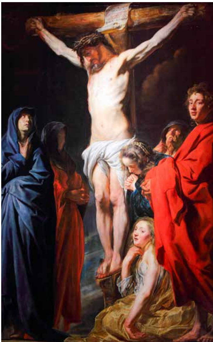
Jacob Jordaens, Isusovo raspeće , 1620.

Isusov radikalni način samozaborava, koji je očit u govor o pšeničnom zrnu, stoji u središtu odgovora na Božji govor, na Isusovo poslanje na zemlji. Ostavljanje svake egocentričnosti iza sebe, kojom želimo »sačuvati svoji život«, vodi prema oslobođenju, autentičnom smootkrivenju, odnosno prema otkriću Boga. Ovaj egzodus izlaženja iz samih sebe, otvara pogled na Isusa i čini čovjeka usmjerenim na Boži govor. Odmiče ga od površnosti i ugodnih privida, opsjednutošću vlastitim interesima, time upoznaje druge i u tim drugima njihove potrebe, od okrenutosti sebi, okreće se drugima, naposljetku ti drugi usmjeravaju ga na Boga. Time se prijelazi iz »Budi volja moja« u »Budi volja tvoja.« Duhovni put pojedinaca i bogotražitelja, onih u Crkvi ili izvan nje, nije više usmjeren na senzualnost, iluzije koje si stvaramo ili su nam nametnute, na duhovnu ugodu i plitak govor, nego Krista, koji pokazuje put slušanja Boga. Taj put svakoga će uplašiti, ali ostaje jedini put u kojem izlazimo iz egocentrizma suvremenosti i stajemo na Božji put. Patnja, bol i zlo nisu nestali, muka je i dalje dio svih života, smrt čeka svakoga, ali one sada ostaje vremenite i ograničene, a proslava Boga po čovjeku nova stvarnost za svakoga tko sluša i živi pogleda usmjerenog na Isusa. Ne samo Isusa koji lijepo govori, liječi, oprašta, ljubi, nego i Isusa uzdignuta na križ. Ostati samo na razini lijepo slike Isusa ostavlja čovjeka u egocentričnoj stvarnosti