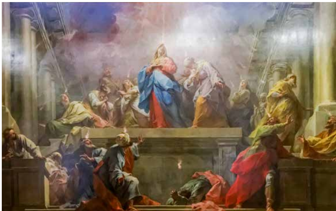
Jean Restout, Duhovi , 1732.

su ta slavlja organizirana upravo za katekumene ili novokrštenike. Potrebno je da vjernici župne zajednice koja je obogaćena novim članovima iskreno i svjesno pokazuju duh kršćanskog zajedništva te da ih prihvaćaju kao braću i sestre. U vremenu mistagogije novim članovima posebno je važno približiti važnost nedjeljne euharistije. Cilj katekumenata je puno sudjelovanje u euharistijskom slavlju. Stoga je prikladno da se kandidatima već za vrijeme katekumenata pomogne u praćenju i sudjelovanju u misi. Iako tada još ne mogu biti aktivni dionici euharistijskoga slavlja, ne priliči udaljavati ih nakon Službe riječi već ih uvoditi u nju i privikavati na buduće cjelovito sudjelovanje u njoj. Kod mise mogu biti molitelji koji će sa zajednicom vjernika sve više ulaziti u veliko otajstvo vjere i nedjeljnu Božju riječ da bi u razdoblju mistagogije mogli doživjeti puninu radosnog susreta s Kristom.