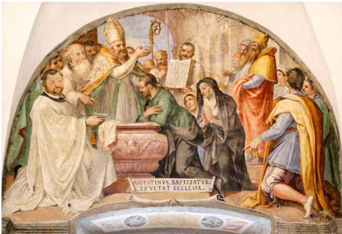
Bernardino Poccetti, Krštenje svetog Augustina, 1597.