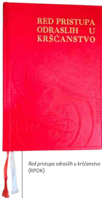
Red pristupa odraslih u kršćanstvo (RPOK)

Što bi trebalo učiniti da katekumenat i u nas potpuno zaživi, kako to traže crkveni dokumenti? Prethodne napomene RPOK-a na katekumenat gledaju kao na dulje razdoblje u kojoj se »pravnicima obogaćuju pastirskim odgojem i vježbaju prikladnom