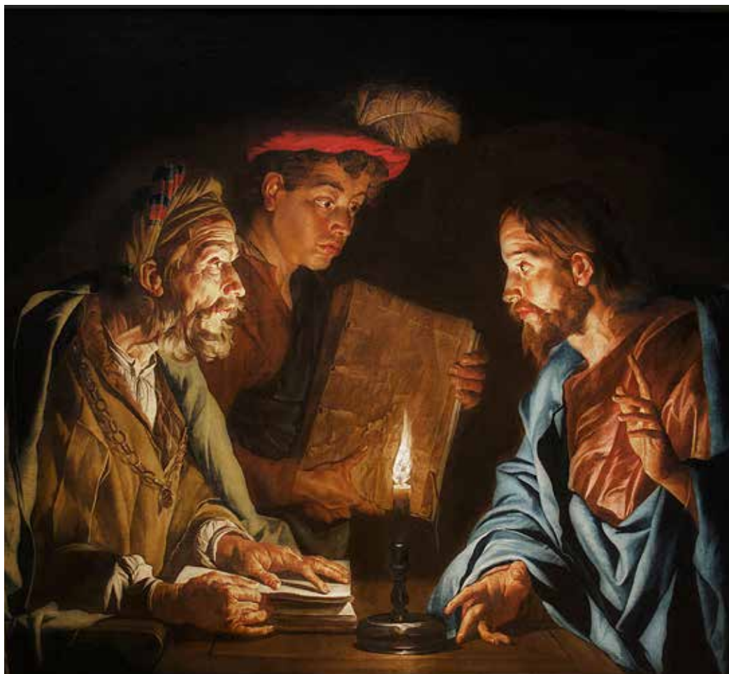
Matthias Stom, Isus i Nikodem , 1640. – 1650.

cjelovito ostvarivo pod prizmom Kristove svjetlosti. Budući da Isus dolazi u vidu spasenja, to je razotkrivanje poziv ljudima na duhovno i moralno sazrijevanje. Nakana je Kristova u konačnici samo jedna: spasenje čovjeka i svijeta. Upravo je zato važno Krista u vlastitome životu prepoznati i kao kriterij i mjerilo razlučivanja sebe i svih svojih postupaka budući da je tek u svjetlu Krista moguće istinski prepoznavati puteve dobra i ljubavi.