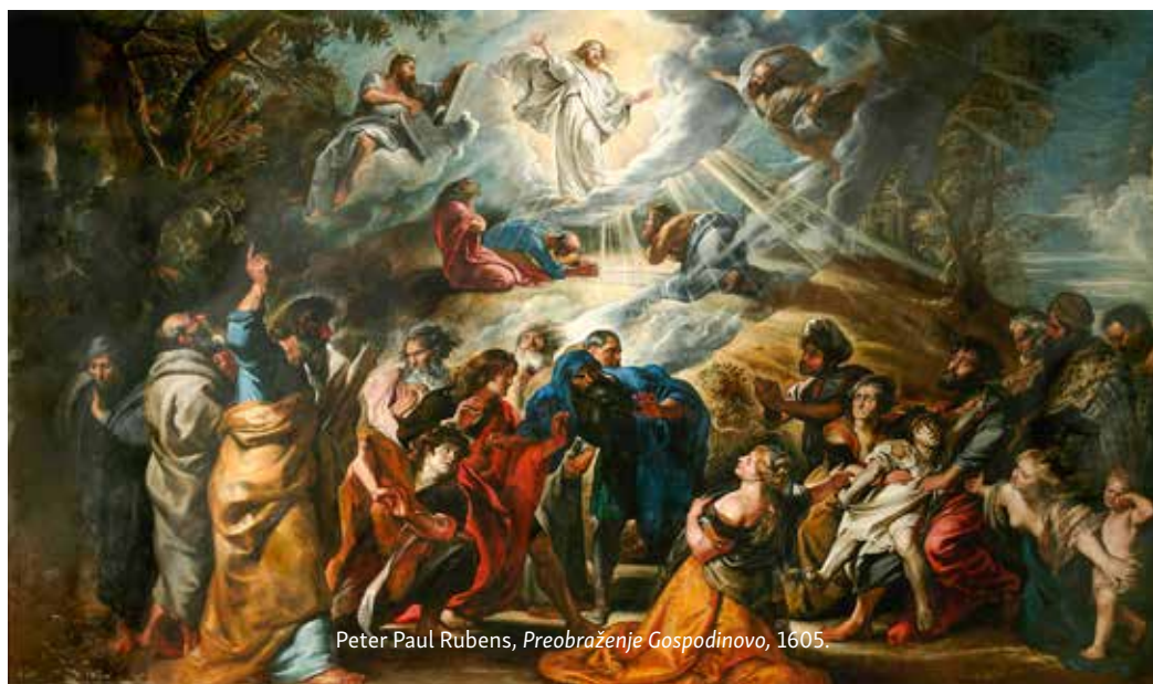
Peter Paul Rubens, Preobraženje Gospodinovo , 1605.

uklapa se u dugu povijest Božje brige za svoj narod i dovodi je do vrhunca.