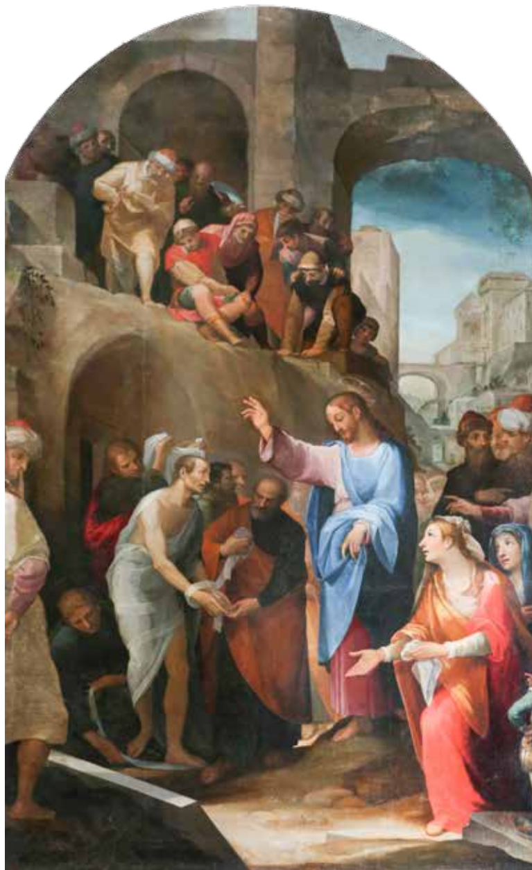
Alessandro Casolani i Vincenzo Rusticani, Lazarovo uskrsnuće , 1575.–1600.

[...] Crkva je ta koja pomaže katekumenima, ne samo voditelji. Ovaj prilično idealan način gledanja pretpostavlja živu župsku zajednicu koja ljubavlju, molitvom i primjerom pomaže katekumenima na njihovu putu.