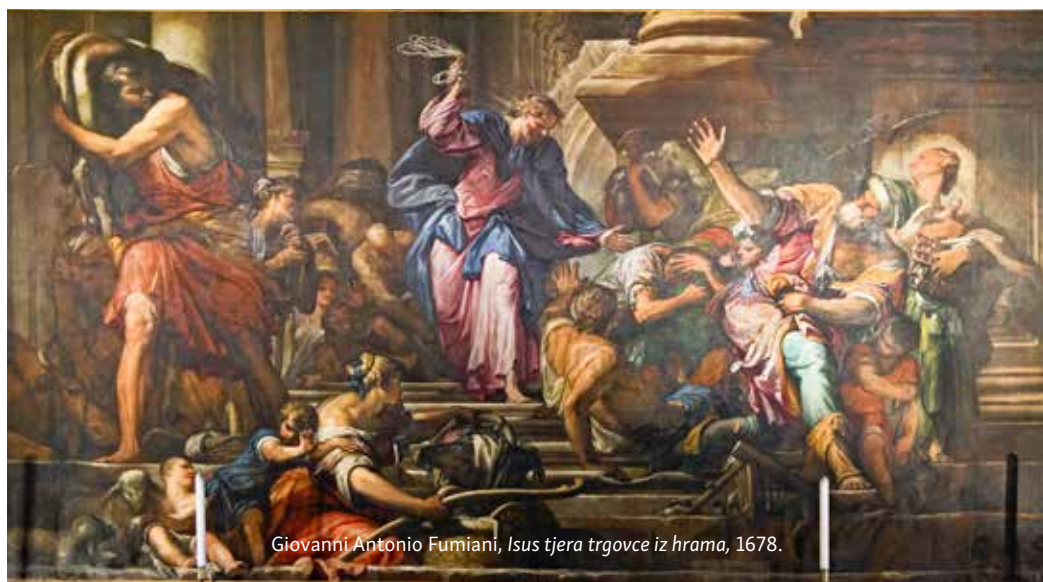
Giovanni Antonio Fumiani, Isus tjera trgovce iz hrama , 1678.

zgodno da tu mogu kupiti žrtvene životinje, umjesto da ih dovode od kuće. Putem su životinje mogle nastradati ili se obredno onečistiti, pa bi tako postale neprikladne za hramsku žrtvu. Mjenjači novca također su imali svoje mjesto u hramu, jer su se životinje namijenjene za žrtvovanje smjele kupiti samo čistim hramskim šekelom. Gledajući tako, možemo reći da su se trgovci i mjenjači nalazili u hramu sasvim opravdano i bili na usluzi ljudima.