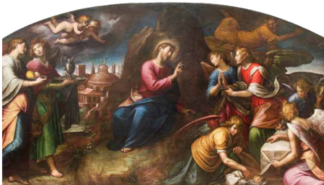
Guglielmo Caccia e Orsola Maddalena Caccia, Isusu u pustinji služe anđeli , XVII. st.

kušnjama mrmljajući protiv Boga i njegovog sluge Mojsija, nemajući povjerenja u Božju snagu i providnost te stvarajući sebi idola – zlatno tele, želeći imati Boga po vlastitoj volji. Nasuprot, Isus – sluga Božji – porazio je u pustinji Sotonu oduprijevši mu se i njegovim kušnjama te ga »svezao«, tako da mu može sada »opljeniti kuću« (usp. Mk 3,27: Nitko, dakako, ne može u kuću jakoga ući i opljeniti mu pokućstvo ako prije jakoga ne sveže. Tada će mu kuću opljeniti!«, usp. također: Lk 11,22) i osloboditi sve koje je Sotona držao svezane sponama grijeha.