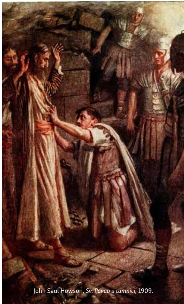
John Saul Howson, Sv. Pavao u tamnici , 1909.