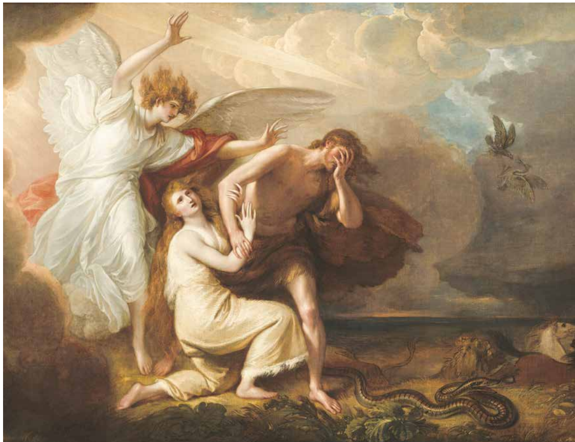
Benjamin West, Izgon Adama i Eve iz rajskog vrta, 1791.

posebnu povezanost s Bogom, onda možemo reći da je on prije svega obvezan njegovati svoj odnos s Bogom, kako u svojoj nutрини tako i u svome izražavanju prema vanjskome svijetu. Ako je, k tome, Krist sliku Božju u njemu obnovio i usavršio, onda je čovjek odgovoran da se na putu prema Bogu sve više suobličuje Kristu, njegovu životu i djelovanju.