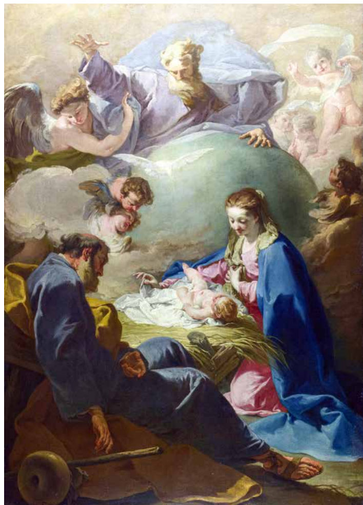
Giovanni Battista Pittoni, Rođenje s Bogom Ocem i Duhom Svetim , 1740.

koja proizlazi iz svakog posvećenja koje mijenja kruh i vino u Tijelo i Krv Gospodnju te preobražava svijet. »Misa je istodobno i nerazdruživo žrtveni spomen-čin u kojem se ovjekovječuje žrtva križa, i sveta gozba pričesti Tijelom i Krvlju Gospodnjom. No, sve je slavlje euharistijske žrtve usmjereno prema najdubljem jedinstvu vjernika s Kristom po pričesti. Pričestiti se znači primiti samoga Krista koji se prinio za nas. ...Kristova žrtva i žrtva euharistije samo su jedna žrtva: 'Jedna je naime te ista žrtva, isti koji je tada prinio sebe na križu prikazuje se sada po služenju svećenika; razlikuje se samo način prinošenja' (Denzinger, H., – Schönmetzer, A., Enchiridion Symbolorum definitionum et declarationum de rebus fidei et morum , 1743.). ...U ovoj božanskoj žrtvi koja se izvršuje u misi, sadržan je i nekrvno se žrtvuje isti onaj Krist koji je jedanput sama sebe na krvni način prikazao na žrtveniku križa [...] i ona je zaista žrtva zadovoljštine.«( Katekizam Katoličke Crkve , 1382.)