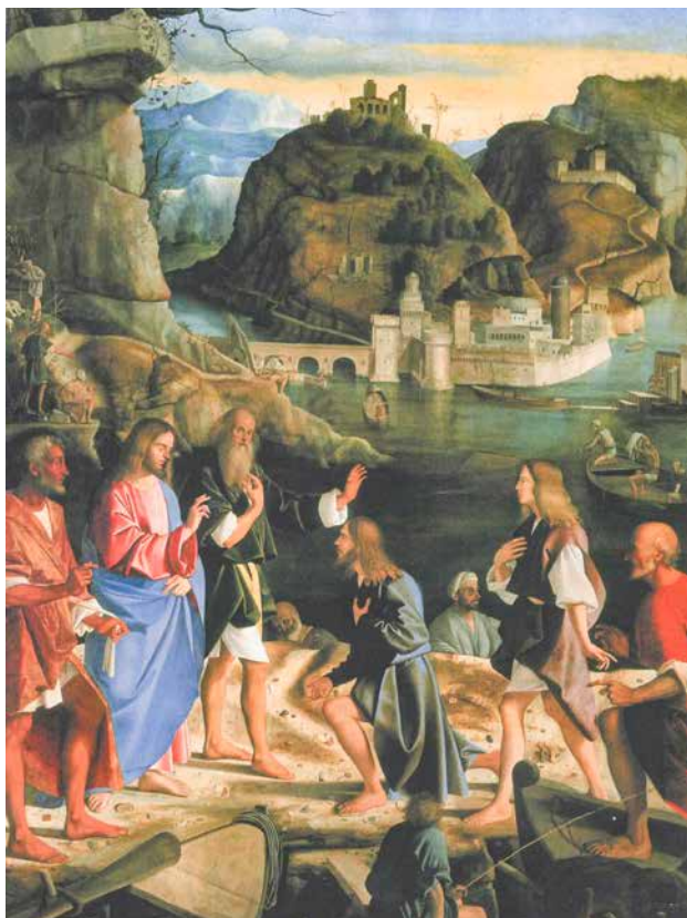
Marco Basaiti, Poziv prvih apostola, oko 1490.

Postoji, međutim, i drugi pristup, više dinamičkog karaktera, koji je prisutan u riječima današnjega Evanđelja: »i pođu za njim«. Slika »poći za Isusom« uključuje u sebi više od činjenice da Isus i učenici međusobno dijele ista uvjerenja, već oni dijele svakodnevnicu života. Isusovi učenici bili su s njim na putu, jeli su zajedno s njim, bili su prisutni kada je Isus činio čudesa i kada je propovijedao, sjedili su oko vatre zajedno s njime kada bi nekamo putovali i spavali su u blizini svojega učitelja. Oni su zapravo dijelili sudbinu života s Isusom Kristom, njihovim učiteljem. Ovaj pristup učenitvu mnogo je dinamičniji, jer se učenik ne može distancirati od učitelja nakon što je postupak intelektualnog poučavanja završio, već učenik dijeli svakidašnje životne situacije sa svojim učiteljem, što je prekrasno izraženo