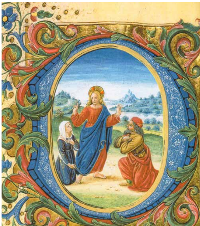
Attavante degli Attavanti, Isus opominje muža i ženu glede rastave , XVI. st.

Ako sam se na Misi prekrizio, onda ne mogu nakon nje prekriziti svoje bližnje na način da ih ubijamo (pobačaj, eutanazija) ili da im govorimo »Glupane!« ili