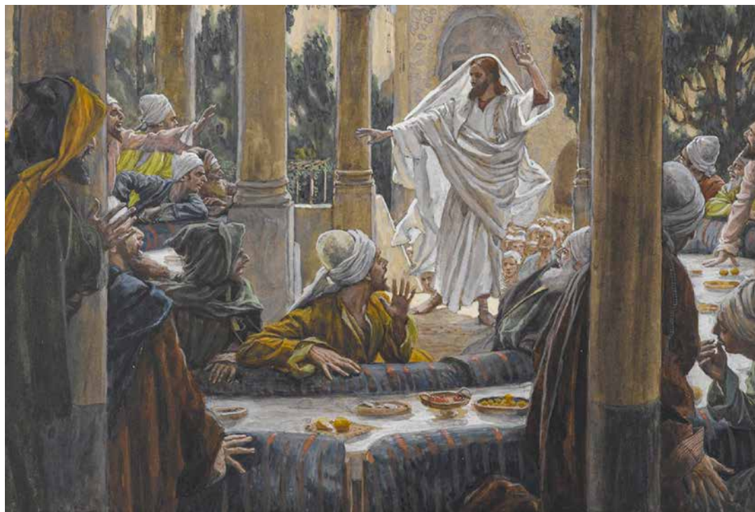
James Tissot, Krist prekorava farizeje, 1886.-1896.