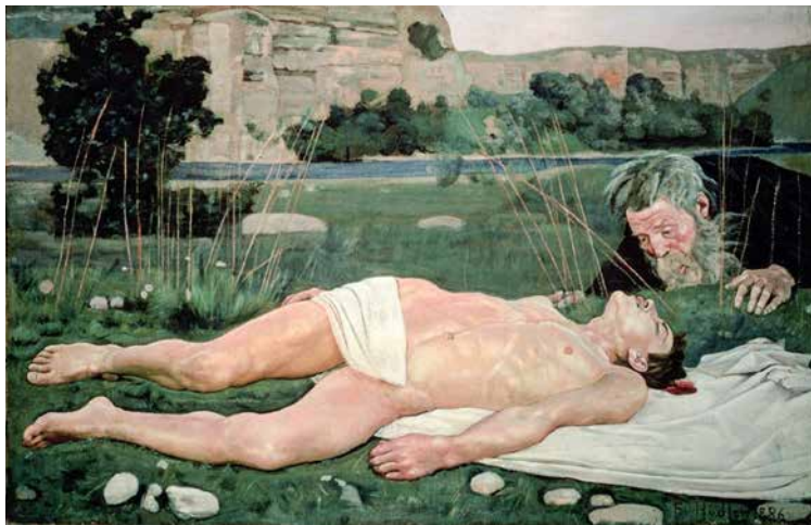
Ferdinand Hodler, Milosrdni Samarijanac , 1886.

Jonas je, na tragu Kanta, formulirao novi »imperativ« kao mjerilo za prikladno odgovorno djelovanje u suvremenom svijetu: »Djeluj tako, da su posljedice tvoga djelovanja u skladu s permanencijom pravoga ljudskoga života na zemlji.«