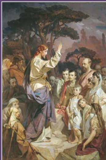
Ivan Makarov, Govor na gori , 1889.