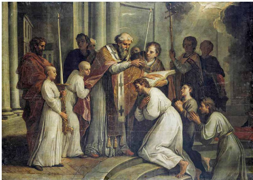
Louis de Boullogne (ml.), Krštenje sv. Augustina, 1695.

otpuštaju. Samo oni koji prođu taj prvi ispit ulaze u katekumenat. Nakon trogodišnje pripreme ispituje se ne njihovo vjersko znanje, nego njihov život: »jesu li pobožno živjeli u vremenu svog katekumenata, poštujući udovice, posjećujući bolesnike, čineći dobra djela?« A zadnju bi provjeru prije krštenja provodio sâm biskup.