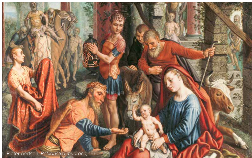
Pieter Aertsen, Poklonstvo mudraca , 1560.

poslušni njegovoj zapovjedi i kreću na put poklonstva novorođenom kralju.