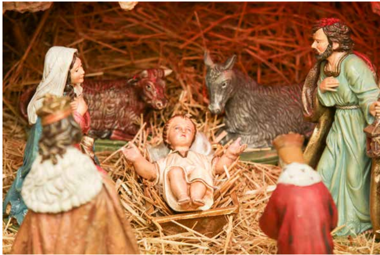
Detalj jaslica u varaždinskoj katedrali