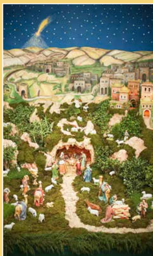
Božićne jaslje u varaždinskoj katedrali