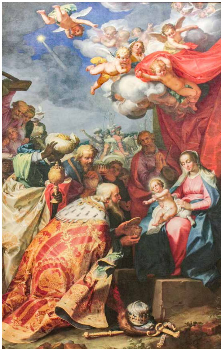
Abraham Bloemaert, Klanjanje mudraca , 1622. – 1624.

usp. ŽV 13/2019.), spomenuo je sjećanja na djetinjstvo i radost iščekivanja pravljenja jaslca. Iako papa izričito ne spominje bor, možemo na temelju njegova pisma proširiti naše razmišljanje i na tradiciju kićenja bora. Redovito su te dvije stvarnosti povezane zajedničkom pripravom i realizacijom. U okviru spomenutoga sjećanja moguće je iskristalizirati radost iščekivanja s jedne strane i s druge pravljenje jaslca i kićenje bora kao ispunjenje toga iščekivanja. Papa spominje djetinjstvo, što daje naslutiti da je naglasak na djeci. Ipak, u spomenutoj pripravi, djeca ništa ne čine bez starijih, roditelja i starije braće i sestara. Svi iščekuju, kako reče papa. A radost iščekivanja djeci je ne samo prirodna, već im je za Božić, i ne samo za Božić, prenijeta od starijih. Sve je odjek pripreve koja vrhunac ima u otajstvu proslave Gospodnjega rođenja. Samo iščekivanje pravljenja jaslca i kićenja bora postalo je jednako tako dio običaja, koji je u mnogim kršćanskim obiteljima dobio i obredne orise. Ti čini naglašeni su svojom izvanrednošću, jer se kao i blagdani i otajstva koja Crkva slave, događaju samo jednom u godini; dakle ne često. Time dobivaju izvanrednost. Znak jaslca i oki-