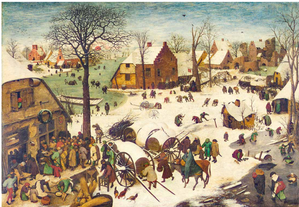
Pieter Bruegel St., Popis stanovništva u Betlehemu, 1566.

U današnjem misalu prva se božićna misa službeno zove misa bdjenja . Slavi se navečer 24. prosinca. Logika je jasna: kao što sve velike svetkovine (Uskrs, sv. Petar i Pavao, sv. Ivan Krstitelj, Velika Gospa) imaju svoju misu bdjenja, tako i Božić, makar ima i misu polnoćku. U praksi je ova misa posljednjih godina postala tzv. »mala polnoćka« za djecu i starije osobe. Svaka od četiri mise ima svoje obrasce molitava i čitanja. Međutim, u važećem lekcionaru prije mise polnoćke stoji napomena: »U misama koje se slave na Božić rabe se sljedeći obrasci, no iz pastoralnih se razloga mogu izabrati tekstovi iz jedne od triju misa koje pojedinačnoj zajednici bolje odgovaraju«. Na polnoćki se čitaju prekrasna čitanja: Iz 9,1-3.5-6 (»Narod koji je u tmni hodio svjetlost vidje veliku«), Tit 2,11-14 (»Pojavila se milost Božja«) i Lk 2,1-14 (»Izađe naredba cara Augusta...«). Jutarnja božićna misa – zornica naziva se i pastirska jer se u njoj navješćuje evanđelje koje govori o poklonu pastira. U dnevnoj se misi čita Iz 52,7-10 (Glasonoša koji naviješta mir i sreću), Heb 1,1-6 (»Više puta i na više načina...«) te Iv 1,1-18 (»U početku bijaše Riječ«).