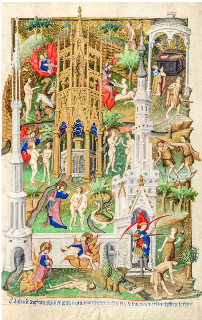
Bedford Master, Priča o Adamu i Evi, 1415. – 1430.