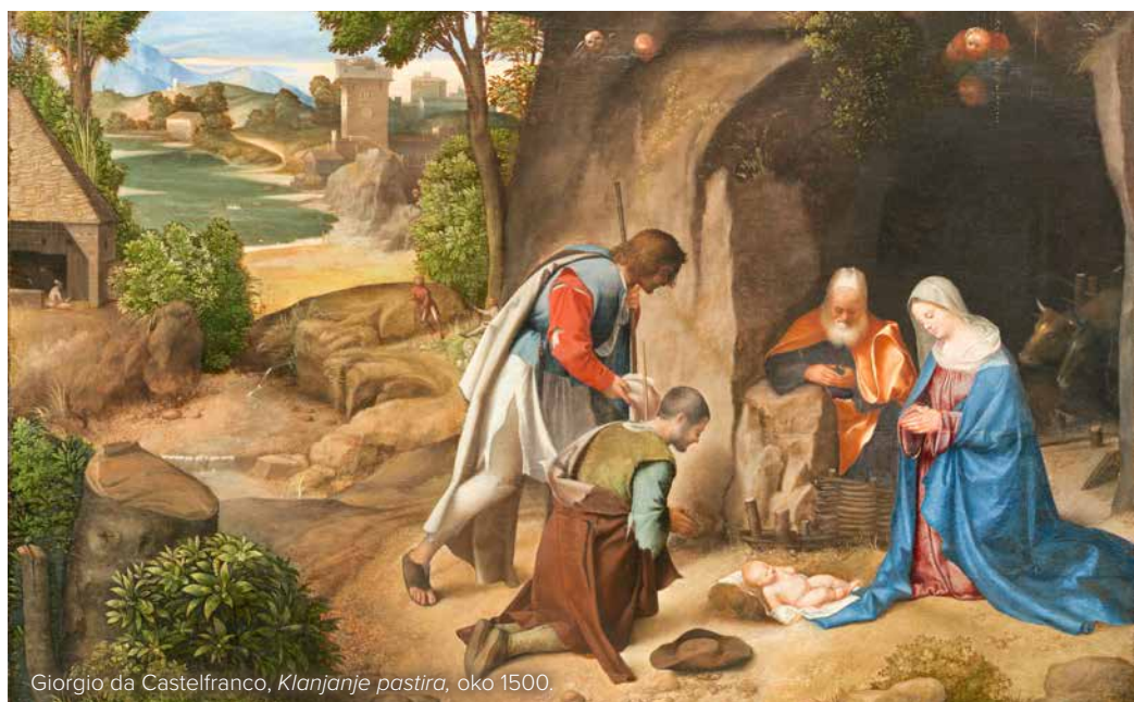
Giorgio da Castelfranco, Klanjanje pastira , oko 1500.

utječemo, a današnja Crkva 1964. kada ju je papa Pavao VI. proglasio Majkom Crkve.