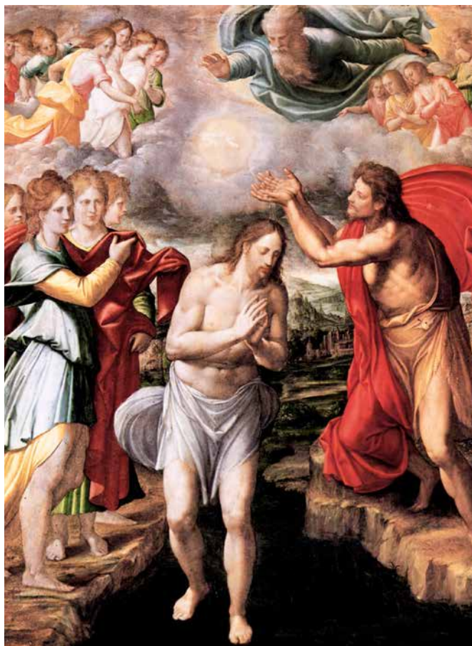
Juan Fernández, Krštenje Kristovo , 1568.

Kada se vjernici saberu oko Riječi i oltara Gospodnjega i slušaju Matejev izvještaj o Isusovu krštenju na Jordanu, neizbježno se susreću sa sobom i svojim krštenjem. Najveći dio vjernika je kršten u ranoj životnoj dobi pa im krštenje nije dio njihova pamćenja. No, većina njih zna da je u jednom životnom trenutku trebala usvojiti ono što su dobili na krštenju i odlučiti se za Krista svojom voljom te tako prihvatiti ono što su dobili na temelju volje svojih roditelja. Jedan dio vjernika