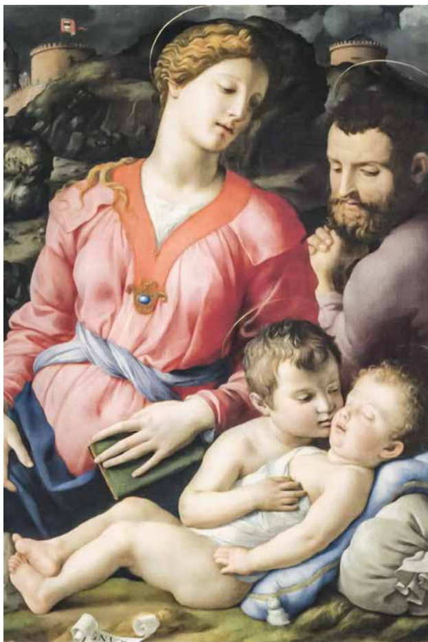
Agnolo Bronzino, Sveta Obitelj , 1530.–1548.

Zato nikakva zaštita djeci nije u tome da ostanu bez roditelja, to jest da im se oduzmu roditelji, kako se to čini u suvremenom društvu, već da roditelji, otac i majka,