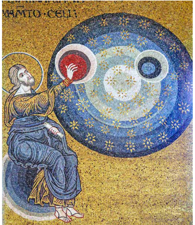
Nepoznati autor, Stvaranje svijeta , mozaik u katedrali u Monreale, oko 1180.

Kasnije se i dnevna misa slavila u bazilici Svete Marije Velike tako da je ona postala »božićna« bazilika. Kad se rimska liturgija proširila po čitavom Zapadu, ove su se četiri mise počele slaviti i izvan Rima.