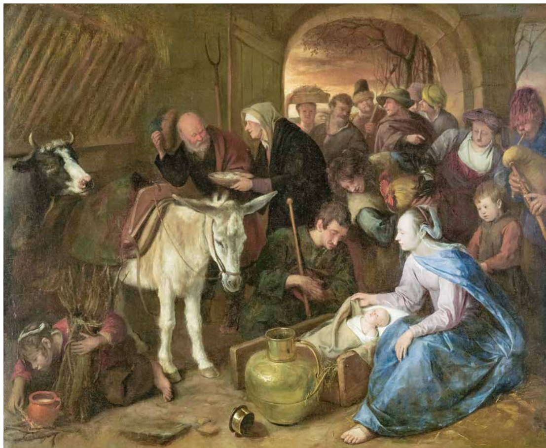
Jan Havickszoon Steen, Klanjanje pastira , 1660.–1679.

Gospodin.« (Ps 34,9) Jer, prvo dolazi okus, a potom gledanje, prvo kušanje, zatim spoznaja: »Hajdemo dakle do Betlehema. Pogledajmo što se to dogodilo.« (Lk 2,15) Jer, znanje o Bogu bez kušanja Boga bljutavo je, kako god ono bilo uzvišeno i veliko. Da se Gospodin nije spustio k nama, da nije navlažio našu ljudsku narav svojom božanskom naravi, da nam vlagom svoje ljubavi nije navlažio srca, smekšao i proširio um, nikada ne bismo znali tko je Bog. U tom smislu s pravom piše Petar Krizolog da »znanje dolazi iz vlažnosti«. Prorok Izaija zbog toga Božju rosu naziva »rosom svjetlosti«. Jer, Božja je rosa rosa istine, spoznaje, ona rastjeruje svaku tamu neznanja, zablude.