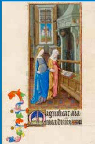
Braća Limbourg, Pohod Blažene Djevice Marije (Časoslov vojvode od Berryja), 1413. – 1416.