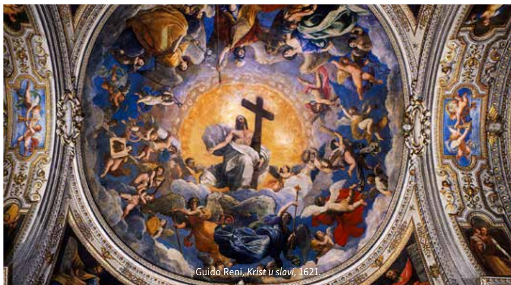
Guido Reni, Krist u slavi , 1621.

je graditi na inteligenciji, bogatstvu, slavi, prijateljstvu... ali i oni su se pokazali nepouzdanima. Konačno, na čemu treba graditi svoj život? Koji je to temelj tako pouzdan i čvrst da bi jamčio sigurnost i uspjeh? Bog je pravi temelj, on je 'stijena vječna'. Njegove zapovijedi su temelj na kojima se gradi kuća života, kuća uspjeha. Samo s Bogom sve postaje dobro, trajno, izgrađujuće za nas i nadahnjujuće za druge.