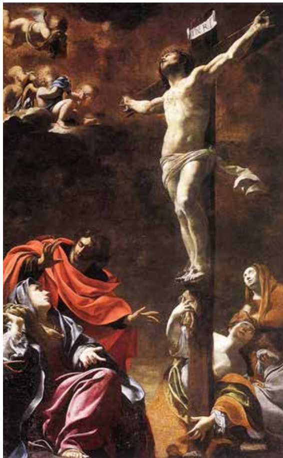
Simon Vouet, Isus na križu , 1621.

Liturgijske odredbe predviđaju različite liturgijske geste tijekom zajedničke molitve časoslova. Zajednica stoji dok se izgovara uvod u službu i uvodni reci svakoga časa, dok se moli ili pjeva himan, dok se moli ili pjeva evanđeoski hvalospjev, dok se izgovaraju prošnje, Molitva Gospodnja i zaključna molitva. Čitanja zajednica sluša sjedeći, osim čitanja Evanđelja. Dok se mole ili pjevaju psalmi i drugi hvalospjevi sa svojim antifonama, zajednica sjedi ili može stajati, ako je to u nekom kraju običaj. Znak križa čini cijela zajednica na početku svakoga časa kod uvodnog retka i na početku evanđeoskih hvalospjeva, a znak križa na usnama čini se na početku Pozivnika.