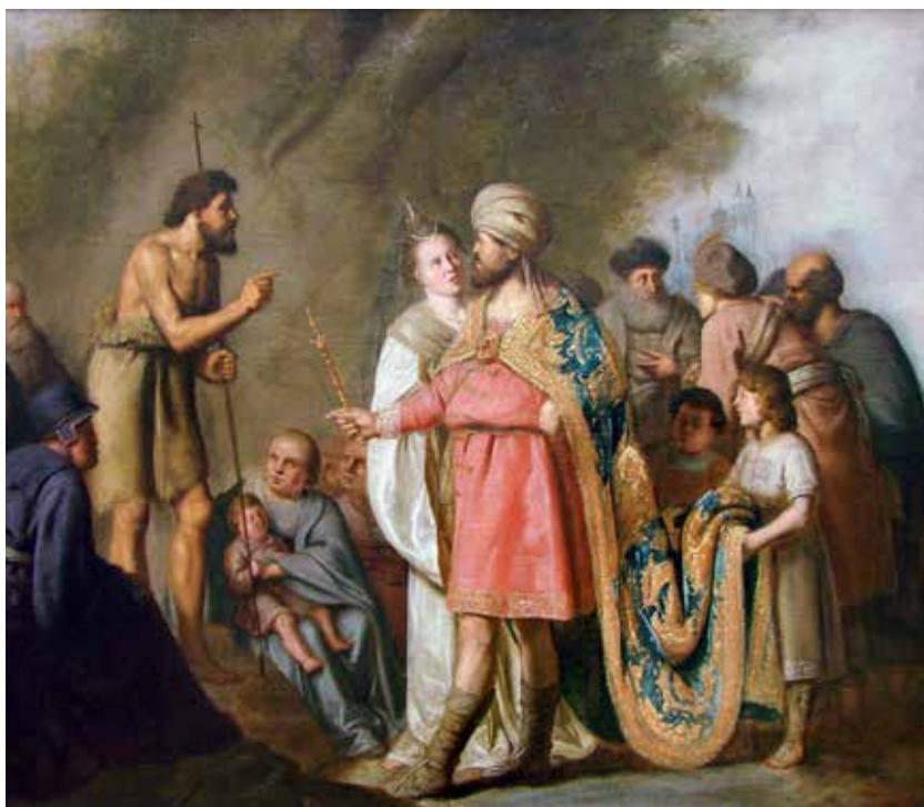
Pieter de Grebber, Ivan Krstitelj i Herod Antipa , 1640.

Kada promatramo važne svjetske događaje, bilo na političkoj, zabavnoj ili kulturnoj razini, može biti da se osjećamo kao mali i beznačajni pijun. Koliko god se trudili, dobro znamo da je naša životna priča u usporedbi s velikim likovima, VIP osobama ( Very Important Person ) povijesti uvijek premalena i beznačajna. Prečesto mislimo da je za Boga naš životni put nebitna stvar i da bi možda trebao učiniti senzacionalne i velike geste samo odabirom velikih i moćnih kako bi se sve promijenili i da njegovo Kraljevstvo pobijedi. Ali Evanđelje nam pokazuje drugačiji put. Bog bira upravo sporedne ceste, najmanje uličice, najmanje vidljiva mjesta za ulazak u povijest i najnezatnije VIP osobe. Bog putuje često bez GPS-a, koristi duže i zavojitije ceste da bi sišao u ljudsku povijest, baš kao što je učinio s Marijom, Ivanom Krstiteljem, galilejskim