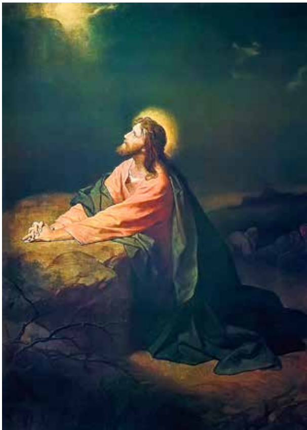
Heinrich Hofmann, Krist u molitvi , 1886.

Konstitucija o liturgiji Sacrosanctum Concilium Drugoga vaticanskog koncila u 4. poglavlju donijela je nekoliko važnih načela koja su uvrštena u obnovljeni Božanski časoslov nakon koncila (usp. SC br. 83-101). Konstitucija ističe da Krist svoju svećeničku službu nastavlja upravo po Crkvi, koja ne samo slavljenjem euharistije nego i na druge načine, posebice moljenjem časoslova,