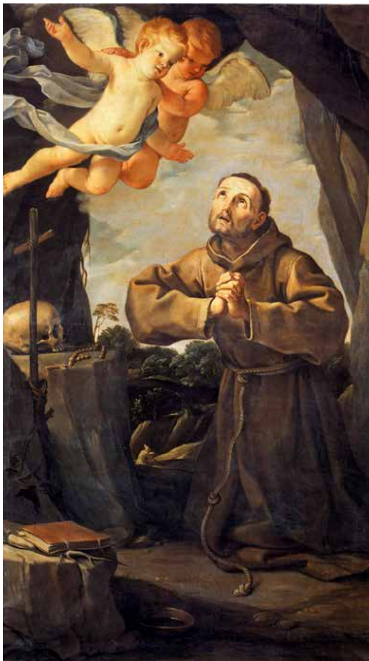
Guido Reni, Sveti Franjo Asiški u molitvi , 1631.

Ona je dvostruki prekid: prekid ispraznoga traganja za ispraznim znanjem ovoga svijeta protiv znatiželje, ali ona je prekid i od korisnoga znanja ovoga svijeta protiv znanja ovoga svijeta. Jer i korisno znanje ovoga svijeta u usporedbi s nebeskim znanjem,