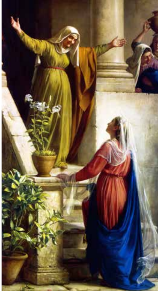
Carl Heinrich Bloch, Pohod Blažene Djevice Marije , 1866.

Isus je gladan i žedan ( Mt 4,2; 21,18; Iv 4,7; 19,28 ), podložan je umoru ( Iv 4,6 ), sklapa prijateljstva, plače nad Lazarom ( Iv 11,35 ), suosjeća s mnoštvom ( Mt 10,36 ) ili je pun radosti pred ostvarenjima Očeve ljubavi ( Lk 10,21 ). Prilazi ljudima sa šokantnom jednostavnošću i autoritetom: grješnici, bolesnici, sakati, hromi, slijepi, odbačeni, marginalizirani, nebitni, neprimijećeni, otkazani, isključeni, oni koji pate, u njemu nalaze razumijevanje koje traže i, u isto vrijeme, snažnu privlačnost koja ih obraća. On se dan za danom odlučuje za poslanje