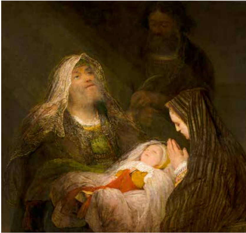
Aert de Gelder, Starac Šimun , 1700. - 1710.

Od sredine 4. st. u Palestini, Antiohiji, Carigradu i u drugim značajnijim središtima ima puno svjedočanstava o tome kako su se vjernici sastajali dvaput dnevno na molitvu. U Jutarnjoj i Večernjoj uz čitanja i homiliju pjevali su se psalmi i biblijski hvalospjevi, molila se sveopća molitva, a nakon zaključne molitve biskup bi udijelio blagoslov. Večernja je k tome započinjala bogoslužjem paljenja svjetla, s kađenjem (kao u vazmenom bdjenju). Osim toga vjernici su povremeno bili pozivani i na noćna bdjenja uoči nekih značajnijih blagdana. Ponegdje su se ovakva bdjenja održavala uoči svake nedjelje.