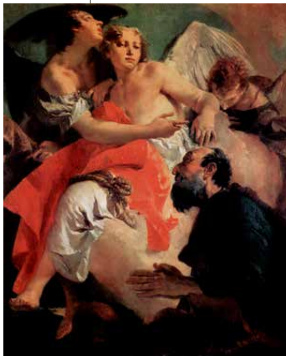
Giovanni Battista Tiepolo, Abraham i trojica anđela , 1732.

5. Tako s Jutarnjim hvalama treba započeti dan, a to znači da se dan započinje mišlju na nebesko vrijeme. Molitva Jutarnjih hvala znači da čovjekova prva kretnja i tijela i duha treba biti misao na Boga, odnosno osmijeh na licu zbog misli na Boga, mišlju da smo već sada vjerom u nebeskom vremenu. Sveto je vrijeme osobito molitva Trećega časa, tj. u 9 sati. Ako već ne može zbog posla, vjernik si treba barem kratkom mišlju navući duhovni plašt, nakratko se povući ad intima k Bogu te ući u sjenu spram blještavila ovoga svijeta. I pritom, u molitvi Trećega časa, misliti na to da nas je Bog stvorio i otkupio te u tim trenucima, ako išta drugo, barem bljesnuti kratkom zahvalnošću Gospodinu na tim čudesnim darovima. A možda i kratko zavapiti, ako već ne možemo moliti zbog posla psalme, »čisto srce stvori mi, Bože«, ili pokoji zaziv iz himna Duhu Svetomu. Šesti čas još je svetiji, a to je podne. Opet vjernik treba barem nakratko bljesnuti, ali ovaj put bljesnuti iznutra kajanjem, duhovnim plačem, sjećajući se Kristove muke na križu. Podne je osobito sveto vrijeme, kojim se preobražava