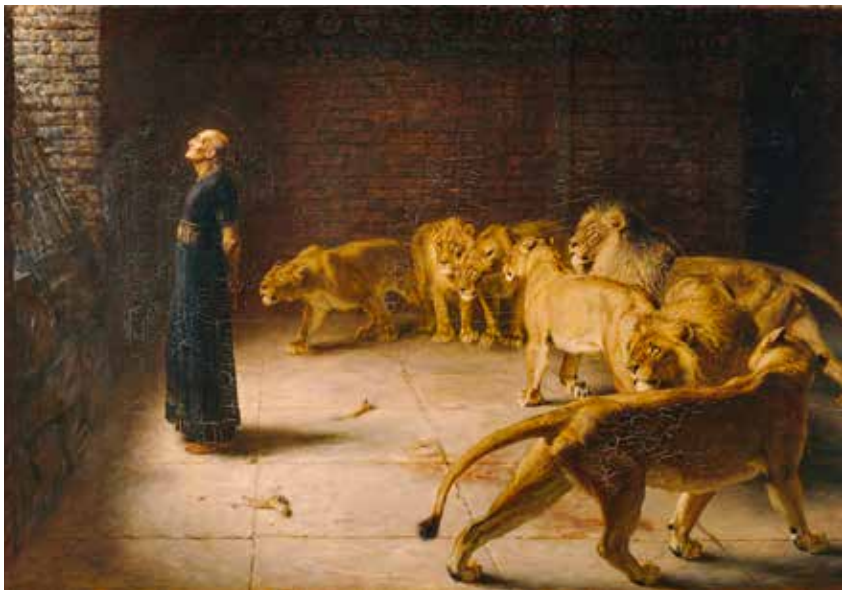
Briton Rivière, Prorok Daniel, 1890.

8. Nažalost, u ovom razmatranju nismo se mogli dotaknuti jedne važne teme za molitvu Božanskoga časoslova, a to su psalmi. To ćemo ostaviti za neku drugu prigodu. No, samo jedan poticaj za kraj. Čitamo u proroka Daniela da je molio kod otvorenoga prozora ( fenestris apertis , Dn 6,11). Gesta je jako važna jer naznačuje otvorenost prozora duše prema Gospodinu. Stoga, gdje god i kad god možete, a da nitko ne zna za razlog, otvorite prozor u svete časove, barem nakratko, da bljesnete molitvom. Pokrijte dušu molitvenim plaštem i zamahnite ju prema Gospodinu, da postanete ‘drugi čovjek’, čovjek preobražen nebeskim vremenom, a to je vrijeme ponizne božanske ljubavi. Prozori su duše istinski bili otvoreni u molitvi, ako nakon molitve budemo kao sv. Franjo: »Takav mora biti da se na povratku od molite drugima pokaže takvim siromaškom i grješnikom kao da nije primio nikakvu novu milost.« (II., 99) Teško ćemo mi, grješnici, potpuno postati molitvom, poput sv. Franje ( totus oratio factus ), ali budimo iz dana u dan barem malkoc gorljiviji molitelji ( orans ). ■