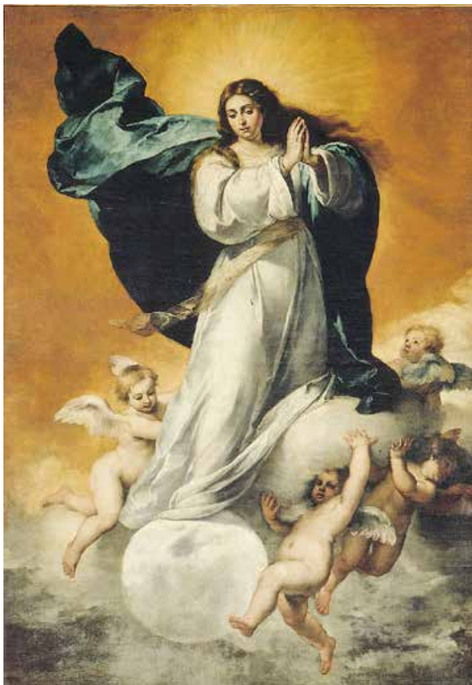
Jusepe de Ribera, Bezgrješno začeće , 1635.

Otkupljenje koje je Mariju učinilo bezgrješnom još je uvijek tu da ukloni grijeh, strukture zla koje je grijeh stvorio, ali i da ukloni neuspjeh i bescilnost suvremenog čovjeka. Nauk o Bezgrješnom začeću podrazumijeva univerzalnost istočnog grijeha, ali također odražava i posvješćuje