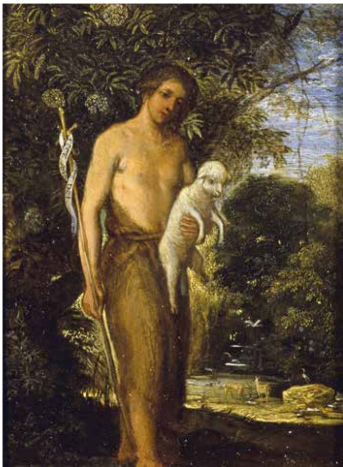
Adam Elsheimer, Sveti Ivan Krstitelj , 1605.

Kada vjernici na nedjeljnom sastanku slušaju Lukin izvještaj o Kristovu preteči