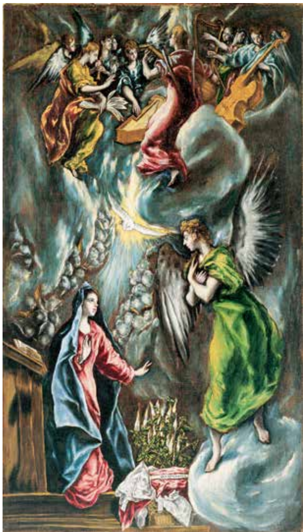
El Greco, Navještenje , 1597.–1600.

Božje obećanje Davidu počinje se ostvarivati u anđeoskom pozdravu Mariji i njezinom »da« Bogu. Ona pažljivo sluša, promišlja, pita i na kraju odgovara izražavajući svoju spremnost postati majka Sina Božjega. Marija nije površna ni brzopleta, niti samo djelomično prihvaća Božju propoziciju. Ona je svjesna toga da je samo »nezatna službenica« Gospodnja (usp. Lk 1,48), no zna da će je odsad zvati blaženom svi naraštaji jer »velika mi djela učini Sve-silni!« (Lk 1,49). I već danas, u toj svetoj božićnoj noći, držat će na svojim rukama Sina Svevišnjega i spasitelja svijeta kojega je ona rodila. Bog je ispunio svoje obećanje i nastanio se zauvijek među ljudima, no ne u rukotvorinama ljudskih ruku nego postaviši