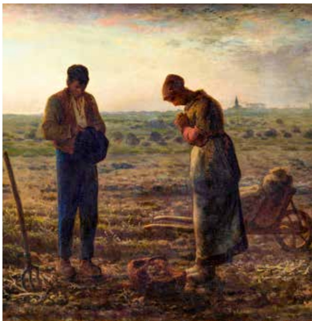
Jean-François Millet, Molitva Anđeo Gospodnji , 1857. – 1859.