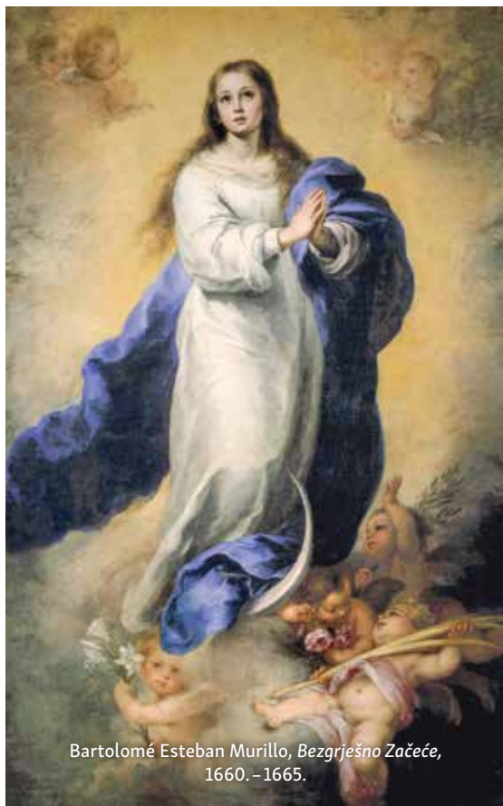
Bartolomé Esteban Murillo, Bezgrešno Začeće , 1660.–1665.

Crkva suučestvuje na određeni način u slavnom životu nebeske Crkve te, u mjeri kojom u tome sudjeluje, postaje sveta i bezgrešna pred Bogom.