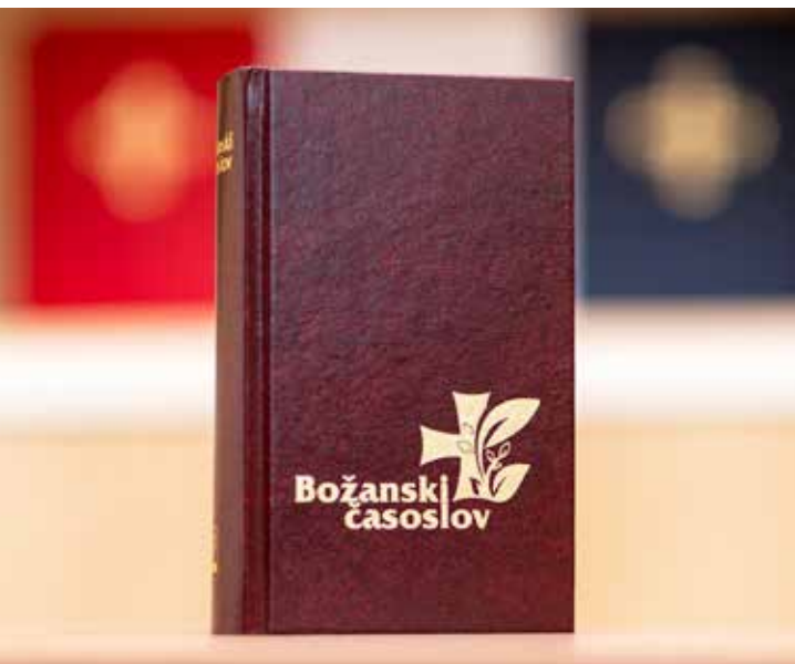
Božanski časoslov za Božji puk

same naravi Crkve (usp. OULČ 9). Kao što za vjernika obaveza molitve prvotno proizlazi iz sakramenta krsta, tako i za kleričke i redovničke osobe to prvotno proizlazi iz sakramenta reda i redovničkog zavjetovanja. Koncilska obnova je željela vratiti ranokršćansku dimenziju shvaćanja molitve što proizlazi iz same naravi življenja vjere, dok je s druge strane manje naglašavala strogo pravni aspekt molitve časoslova, u čemu su dominirali mnogobrojni manuali moralne teologije predkoncilskog vremena.