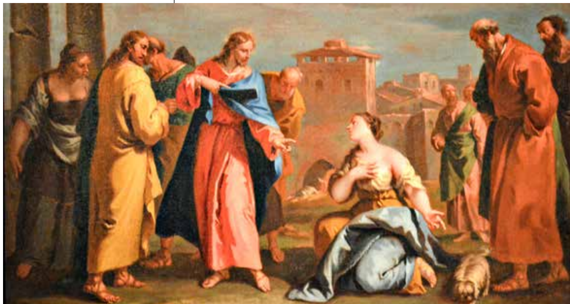
Sebastiano Ricci, Krist i žena Kanaanke, 1726. – 1729.