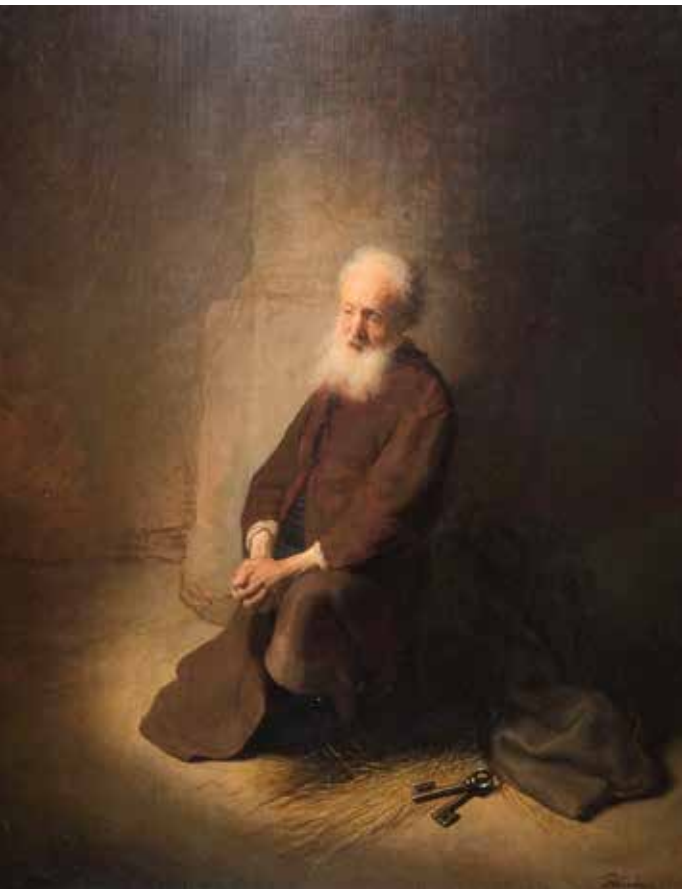
Rembrandt Harmenszoon van Rijn, Sv. Petar u tamnici , 1631.

U Djelima apostolskim nalazimo također podatke o molitvi u određene sate. Silazak Duha Svetoga na Pedeseticu dogodio se o trećem satu dana kada su apostoli bili okupljeni na molitvu (usp. Dj , 2,1-15). Petar je o šestom satu molio na krovu (usp. Dj 10,9), a Petar i Ivan uzlazili su u Hram na molitvu o devetom satu dana (usp. Dj 3,1). Prvi kršćani nisu molili samo danju nego i noću. Pavao i Sila su tako molili o ponoći pjevajući hvalu Bogu (usp. Dj 16,25). Zajedničke molitve postepeno su prešle u redosljed određenih časova i odgovaraju molitvenim vremenima za ono što kasnije dobiva naziv božanska služba , posebno za treći, šesti i deveti čas. Molitva Crkve postaje molitva hvale i prošnje s Kristom i molitva Crkve Kristu.