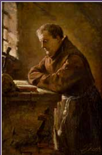
Andrzej Bronisław Grabowski, Redovnik u molitvi , 1865.