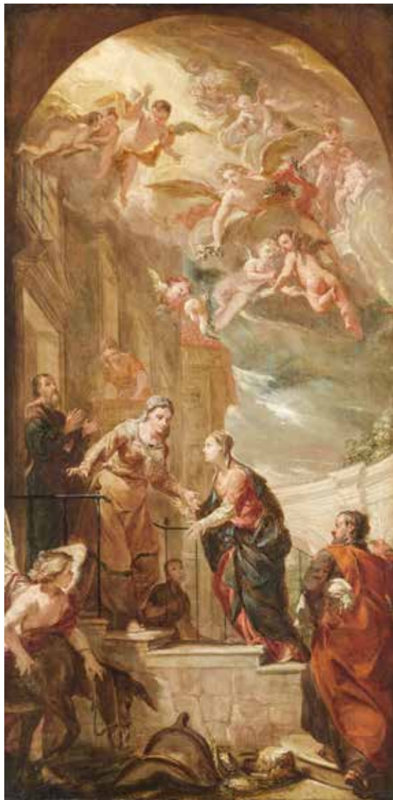
Antonio Bellucci, Pohodjenje , 1700.

Molitva liturgije časova ili časoslova ispunjavanje je Kristova poziva da kršćani mole jedni za druge, za Crkvu i za cijeli svijet. Ova dnevna molitva je najizvrsnija molitva Crkve jer je biblijska, objektivna i tradicionalna. Tradicionalna je jer je odraz bogate tradicije kroz cijelu povijest kršćanstva. Biblijska je zato što se isti elementi koji su činili molitvu za ranu Crkvu nastavljaju u liturgiji časova: sjećanje na Božja djela, molitva za Božje vodstvo, potvrđivanje saveza s Bogom u Kristu i molitva za ispunjenje Božjeg plana spasenja. Liturgija časova je objektivna, budući da ima za cilj susresti Boga po Isusu u Duhu. Bog nam govori i Crkva mu odgovara, a ova molitva može donijeti ravnotežu drugim oblicima molitve. Može izvući vjernike iz subjektivnosti, brige samo za sebe i za one koji su im blizu. Uvlači u duhovne vrijednosti i povezuje s cijelom Crkvom i cijelim svijetom. Liturgija časova je istinska meditacija koja nam pruža okvir koji nas oblikuje kao kršćane, koji nas hrani i omogućuje da ostvarimo naše kršćansko poslanje u svijetu. ■