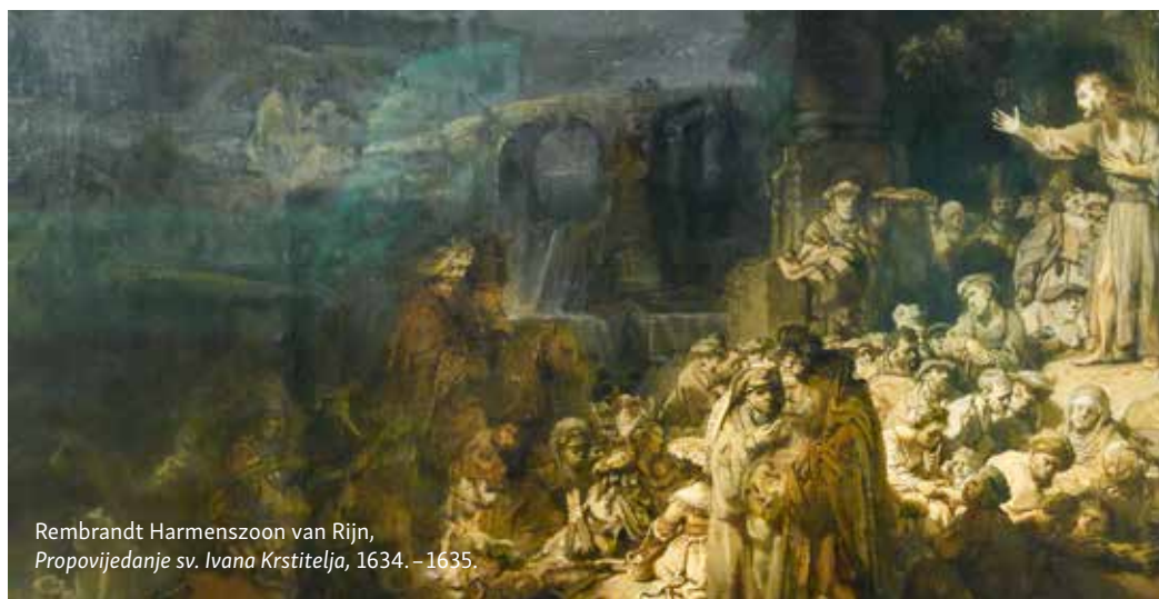
Rembrandt Harmenszoon van Rijn, Propovijedanje sv. Ivana Krstitelja, 1634. - 1635.

brežuljak spustiti, sve krivudavo izravnati i sve hrpavo izgladiti sadrži duhovnu i moralnu poruku koja se sastoji u tome da Božji dolazak u naš život ne donosi željenoga ploda, ako se za taj događaj ne pripremamo, a priprava se sastoji u tome da Božje zapovijedi slušamo i vršimo.