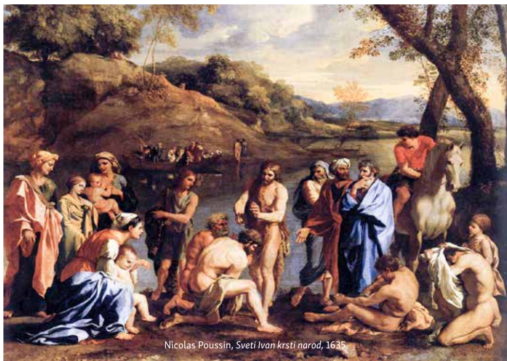
Nicolas Poussin, Sveti Ivan krsti narod, 1635.

požrtvovnost. Tijekom došašća vrlo lako se može zaboraviti smisao cijelog ovog vremena i usmjeriti se na »ja« i »mi«, uživati u sretnim trenutcima i ugodi okruženja koje potiče dobro raspoloženje i osjećaj sreće, a da se potpuno izgubi smisao hoda prema Božiću, a samim time i samog Božića. Poruka proroka Izaije i Ivana Krstitelja u današnjim čitanjima, kao i Marijin »Veliča«, koji je umjesto otpjevanog psalma, upućuju da se radost ostvaruje onda kada smo kao pojedinci ili skupine upućeni na Boga. Ovakva upućenost otvara prostor radosti, pred kojom nestaje prolazna sreća, a samim time usmjerenost vjernika se s »ja« i »mi« okreće prema drugima kojima se želi donijeti Krista - svjetlo u tamu teške svakodnevice i nadu u beznađe.