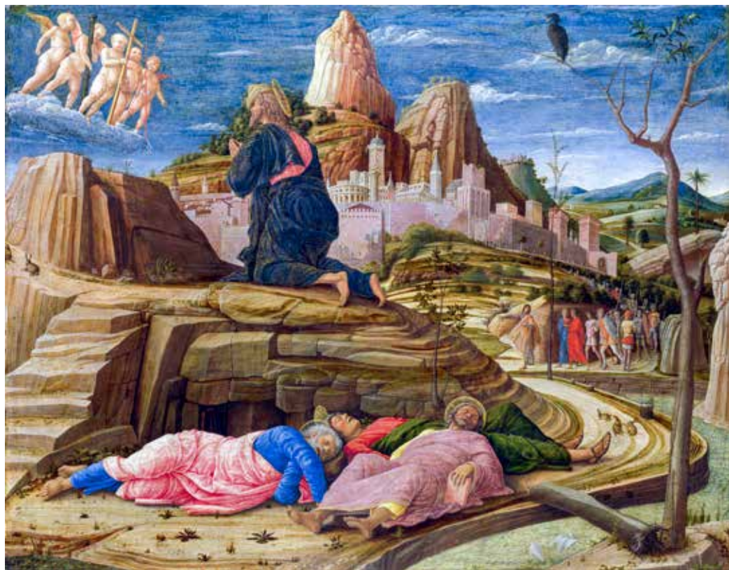
Andrea Mantegna, Agonija u Getsemanskom vrtu , 1458. – 1460.

takvom pospanošću? Isus neprestano poziva i potiče, a ipak tolika srca i toliki životi ostaju zatvoreni za njegov zov. Treba se zapitati zašto tako lijepa i poticajna poruka evanđelja toliko puta nailazi na tako slabi ili na nikakav odgovor? Ne bi li u tome smislu Došašće aktivnim vjernicima trebalo poslužiti i za preispitivanje načina na koji svjedoče vlastitu vjernost Kristu? Traženje odgovora na ovo pitanje zasigurno je dio bdjenja Došašća.