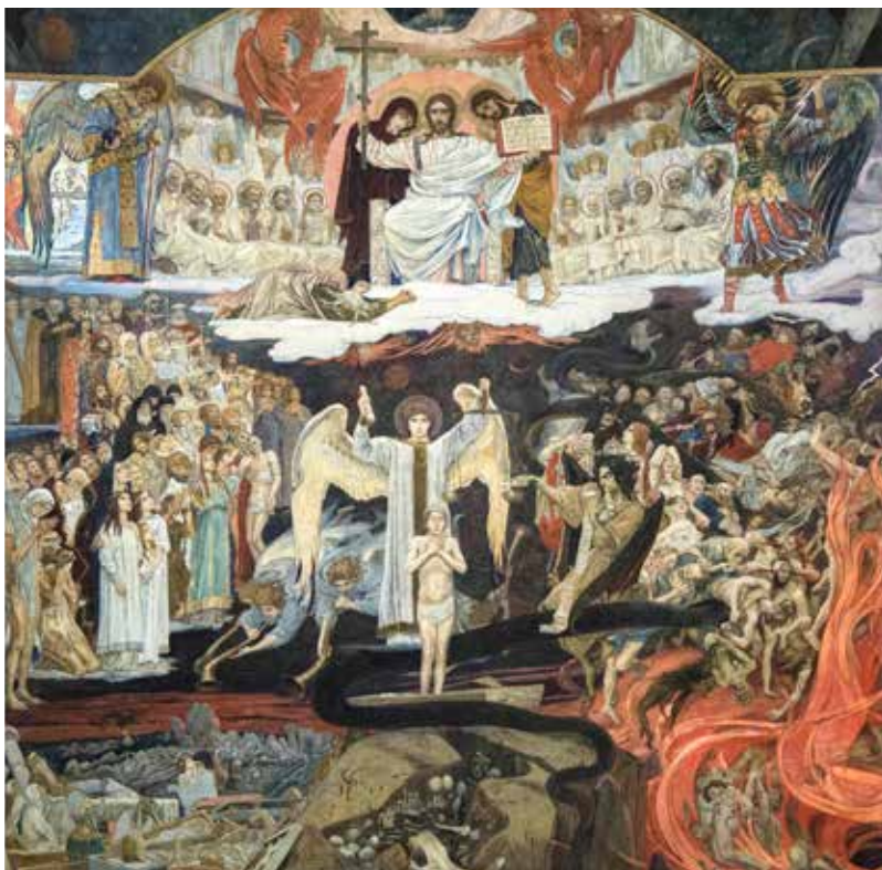
Viktor Michailowitsch Wasnezow, Posljednji sud , 1904.

Stoga neznanje o tom danu i času, koji ipak sigurno dolazi, ima svrhu da nas potakne na stalnu na budnost i pripravnost za Kristov dolazak, a ne da se uljuljamo u iluzornu sigurnost trenutka u kojem živimo, kao da će onomu danu umaknuti. Da bi istaknuo kako je neznanje o onom danu doista potrebno da bismo u svom naraštaju živjeli budni, Isus kaže kako o tom danu i času ne znaju ne samo ljudi i anđeli nego čak ni Sin. Taj dan i čas poznat je samo Ocu. To nam može zvučati pomalo neobično jer bismo očekivali da Sin zna sve što i Otac.