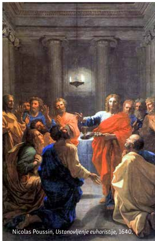
Nicolas Poussin, Ustanovljenje euharistije , 1640.

S druge strane, laici nisu pasivni promatrači, već su pozvani na djelatno udioništvo, čime obogaćuju i doprinose slavlju na svoj način. Njihova uloga, iako se ponekad može činiti neznatnom, ima iznimno značenje jer pokazuje suradnju svih vjernika u životu i poslanju Crkve. S voljnošću za služenje, laici postaju živi izraz ljubavi prema Bogu i bližnjima. Vjernici su stoga pozvani s radošću prihvatiti bilo koju službu ili zadatak koji im zajednica povjeri tijekom liturgijskog slavlja. To služenje ne treba doživljavati kao teret, već kao priliku da aktivno doprinesu slavljenju Boga i izgradnji Crkve.