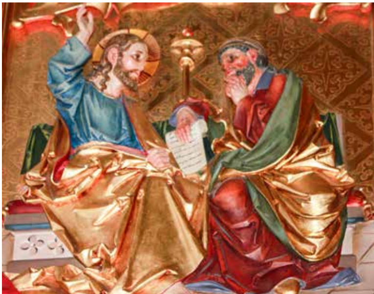
Josef Bachleitner, Isus i pismoznamac , 1909.

Ljubav prema sebi ne sastoji se u snažnim osjećajima i emocijama, već u prihvaćanju sebe sa svime što nam pripada i što čini našu osobu, sa svojim mogućnostima