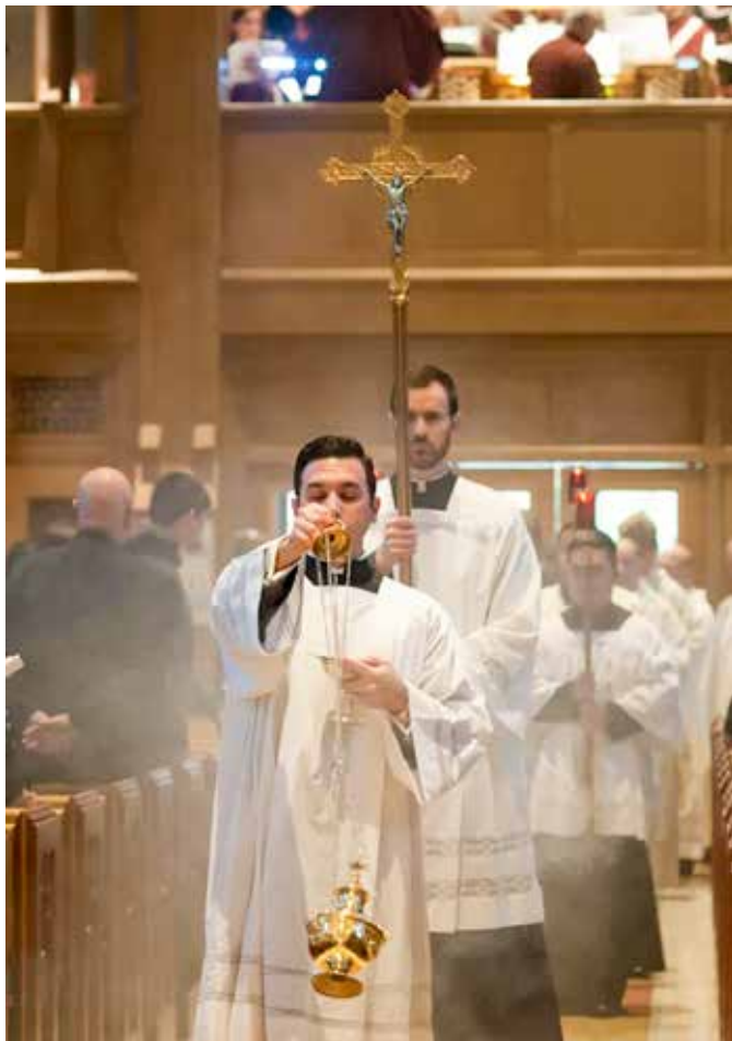
Akolit nosi križ između dvojice služitelja sa svijećama

Svaka služba, bilo da je riječ o čitanju, pjevanju, služenju pri oltaru, dijeljenju pričesti ili bilo kojem drugom obliku udioništva, predstavlja način kako laici postaju dionici tijela Kristova. Njihovo služenje prilika je za duhovni rast i svjedočanstvo Kristove prisutnosti, dok pridonose skladnom slavlju koje proslavlja Boga i jača zajedništvo među braćom i sestrama u vjeri ( Opća uredba Rimskog misala 97).