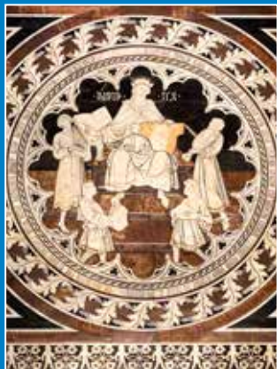
Domenico di Niccolò, Psalmist David , XV. st. (katedrala u Sieni)