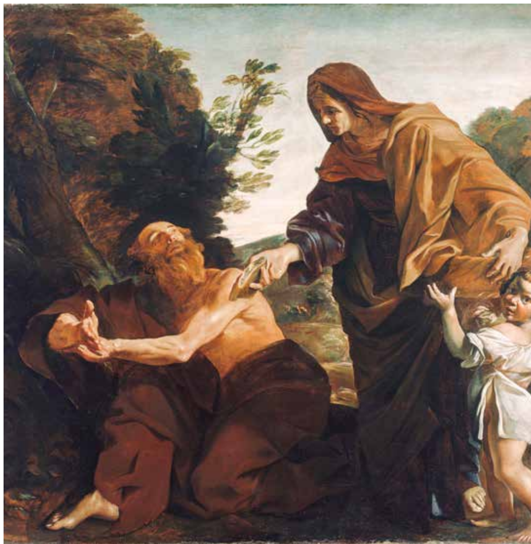
Giovanni Lanfranco, Ilija prima kruh od udovice iz Sarfate , 1621. – 1624.

ali jasno usvajaju i ispravan način štovanja materijalnih mjesta kulta i pobožnosti.