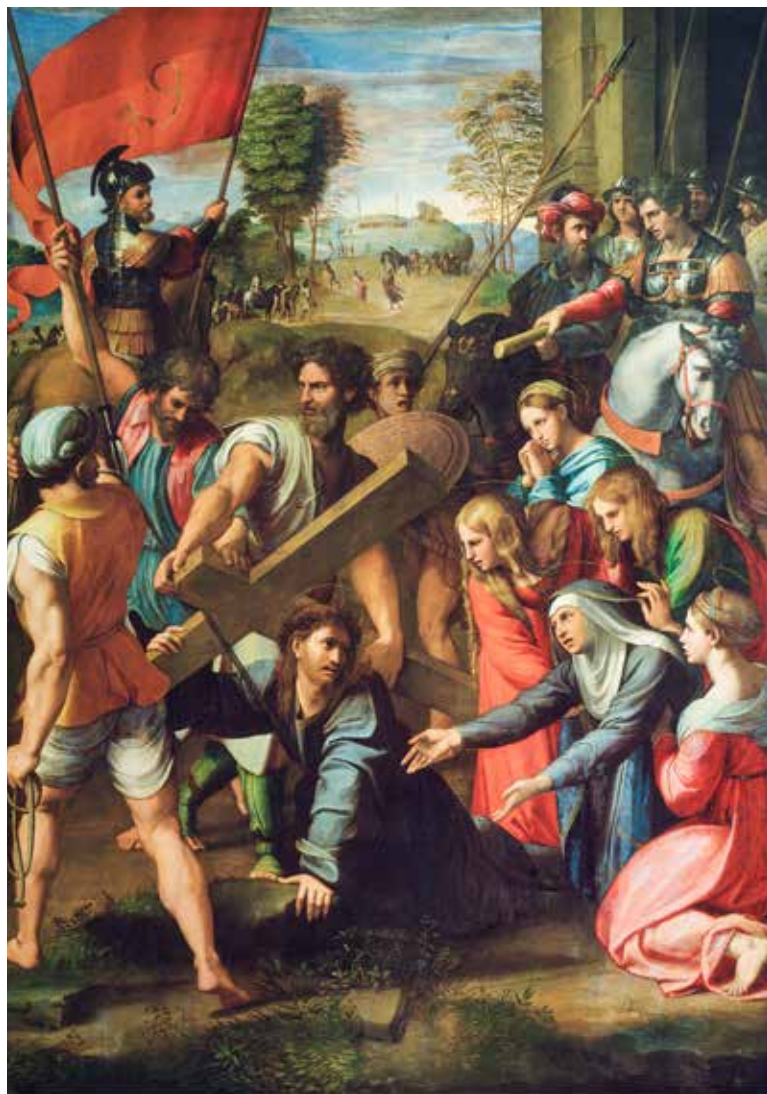
Raffaello Sanzio, Krist pada pod križem, 1517.

Pouke učenicima o služanju nužno su povezane sa shvaćanjem Isusovog života kao služanja drugima, te Isus samoga sebe daje kao primjer u služanju dok o tome poučava svoje učenike.