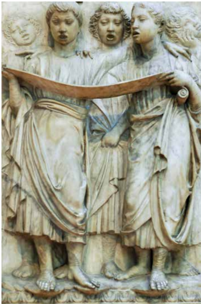
Luca della Robbia, Pjevanje psalma 150 ( Laudate Dominum ), 1438.

postavljenog čitača, naviještanje čitanja povjerava se drugim laicima koji su prikladni i dobro pripremljeni za tu službu, kako bi vjernici mogli iskusiti milinu i snagu Svetoga pisma ( OURM 101). Čitač je odgovoran za pripremu vjernika koji također mogu čitati Sveto pismo u liturgiji.