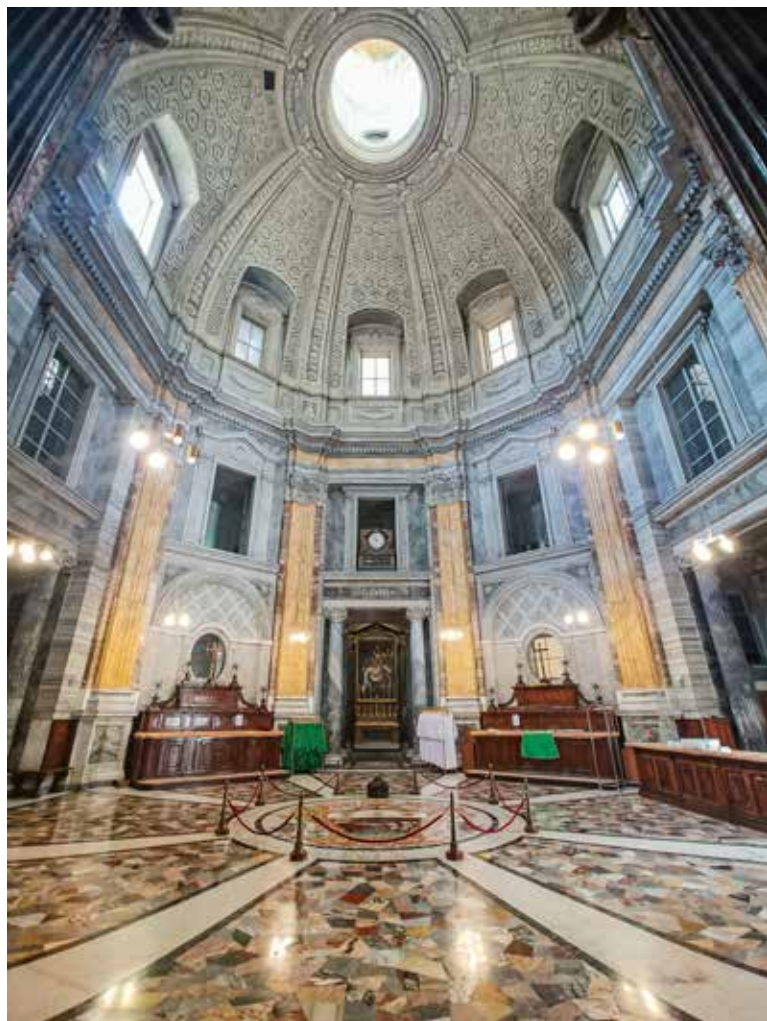
Sakristija bazilike sv. Petra u Vatikanu

Pohvalno je da se već prije samoga slavlja obdržava šutnja u crkvi, u sakristiji i njima bližim mjestima.