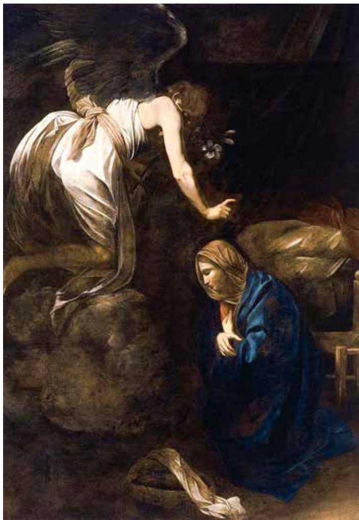
Michelangelo Merisi da Caravaggio, Navještenje, 1608.–1610.

tvrde životopisci, u gramatičkim izrazima. Plotin je to činio da čovjeka obrati od vanjštine prema nutrini, prema mišljenju, prema božanskom. I ta dva primjera pokazuju da su ponizni govornici i pisci uvijek šutljivi govornici, šutljivi propovjednici, šutljivi pisci, jer su oni samo poslužitelji Riječi. Njihove šutljive riječi nalikuju onomu nečujnomu čekiću iz židovskoga hrama, po kojem snažno odjekuje Riječ, Isus Krist. Tko ne služi Riječi, buči riječima, pametuje, koristi raskošne izraze, želi impresionirati izvanjskim, sobom, a time samo zaglušuje glas božanske Riječi. Ah, zato danas mnoge propovijedi, mnogi teološki tekstovi, nalikuju cimbalu što zveči i mjedi što ječi.