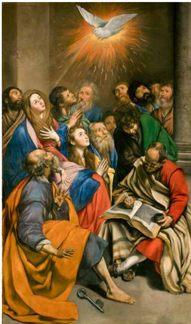
Juan Bautista Maíno, Silazak Duha Svetoga, 1612.-1614.

Šutnja je dakle, u OURM 45 predstavljena s tri gledišta: šutnja sabiranja ili pripreve, šutnja slušanja i meditacije te šutnja slavljenja i molitve. Šutnja mijenja svoje značenje i karakter ovisno o kontekstu u kojemu se nalazi. Naime, OURM 45 navodi spomenuta tri gledišta apostrofirajući da njezina priroda ovisi o trenutku u kojem se odvija u pojedinim slavljinama.