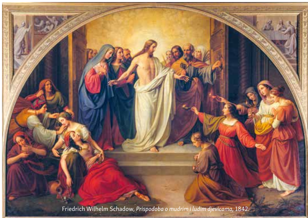
Friedrich Wilhelm Schadow, Prispodoba o mudrim i ludim djevicama , 1842.

ulja jer ulje za svjetiljku se vrlo vjerojatno niti ne kupuje materijalnim sredstvima već životom u vjeri koji ozbiljno računa na Kristov dar ulja koje potpomaže naše živote. I to je evanđelistu jako važno prikazati. Iz tog razloga na vrlo odrješit način prikazuje mudre djevice kao one koje ne dopuštaju dijeljenje ulja drugima u trenutku Kristova dolaska. Putokaz je to za promišljanje o našoj vjeri jer se i u našim životima često događa da živimo od ulja drugih. Od žara vjere drugih ljudi, a ne svoje vjere. Ponekada ih gledamo te stojimo zapanjeni jasnoćom njihova sjaja vjere. Jer vjernička svjetiljka uvijek obasjava i tmine onih koji doduše ne vjeruju u punoj mjeri, no vole se ogrijati na žaru vjerničkog plamena.