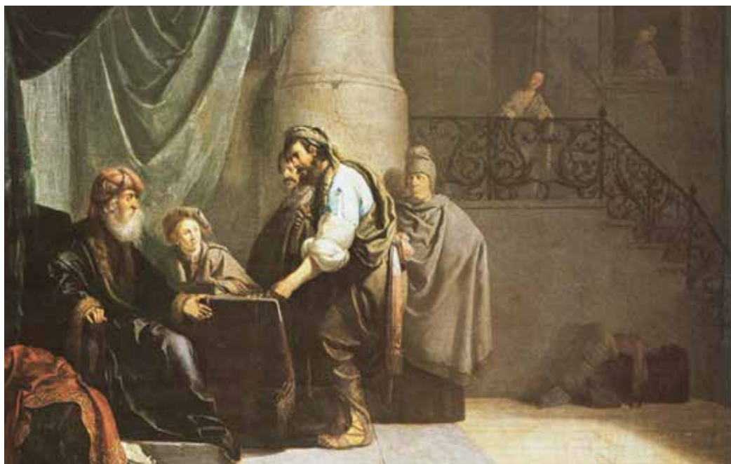
Willem de Poorter, Prispodoba o talentima , XVII. st.