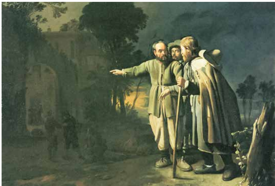
Michiel Sweerts, Putnika primiti (tjelesno djelo milosrđa) , 1646. – 1649.

donosi ispunjenje starozavjetnog proroštva iz prvog čitanja u kojem Bog obećava trud i brigu za svoj narod. Krist kao pastir i Krist kao kralj svojim primjerom služenja i ljubavi pokazuje svakom vjerniku put kojim mora proći u izgradnji vlastite kršćanske autentičnosti. Isus navodi da je u svakoj od situacija navedenih u evanđeoskom ulomku on bio prisutan pa je svaka gesta učinjena u korist najmanjemu od braće zapravo bila usmjerena prema njemu.