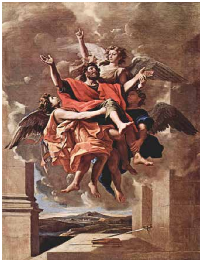
Nicolas Poussin, Uznesenje svetog Pavla , 1649. – 1650.

3. No, budući da su riječi Riječi, Isusa Krista, toliko zapaljive, nalikuju rasplamtjelu ognju te jednostavno ne možemo izdržati, a da ne progovorimo, poput proroka Jeremije: »Al' tad mi u srcu