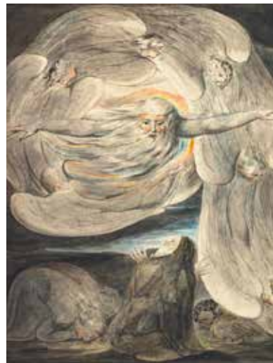
William Blake, Bog govori Jobu , 1804.

Kada čovjek jednom zašuti izvana, to jest kada nema podražaja našim vanjskim osjetilima, tada do izražaja dolazi čovjekov unutarnji svijet. Sve ono što smo nekada potisnuli glasnom glazbom, ili bučnim društvom, prekomjernim bavljenjima na društvenim mrežama, ili obilnim jelom i pićem, a u moderno vrijeme i različitim opijatima, sve to polako izlazi na površinu našega života poput mjehurića zraka što burkaju kroz vodu, ne bi li se kako domogli površine. Teško je utonuti u tu unutarnju šutnju, jer je najprije potrebno dozvoliti nutринi našega bića da oslobodi i otpusti prošle terete života, koji ponekad poput bubnjeva glasno iznutra bubnjaju i onemogućavaju nam uspostaviti iskreni kontakt s drugim ljudima, a jednako tako i s Bogom. Čovjek tone u tu unutarnju šutnju iskrenim priznavanjem svojih pogrešaka i grijeha, najprije Bogu, a onda sebi i drugim ljudima koje smo povrijedili. Ponekad se čini jednostavnim u ispovijedi priznati svoju grješnost Bogu, pa možda i zatražiti oprostnje od drugih ljudi koje smo povrijedili. Sve nas to uvodi u tišinu našega srca. Ali ponekad je teže oprostiti samima sebi, i prestati govoriti: »Kako se to meni moglo dogoditi?« Ljudi koji su to spremni učiniti, to zapravo čine Božjom snagom i Božjom ljubavlju, jer ljubav koju su doživjeli u Božjem oprostjenju djeluje