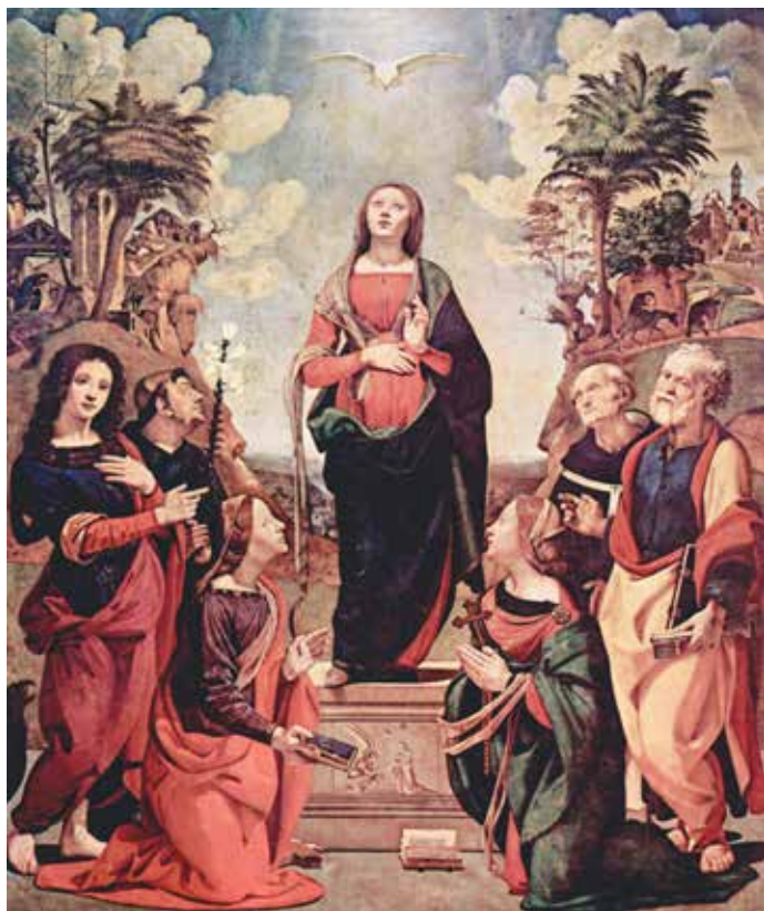
Piero di Cosimo, Utjelovljenje Kristovo , 1505.

liturgijsku šutnju. Sve što je razmatrano kasnije u kontekstu liturgijske šutnje razmatrano je samo i isključivo zahvaljujući ovom doprinosu.