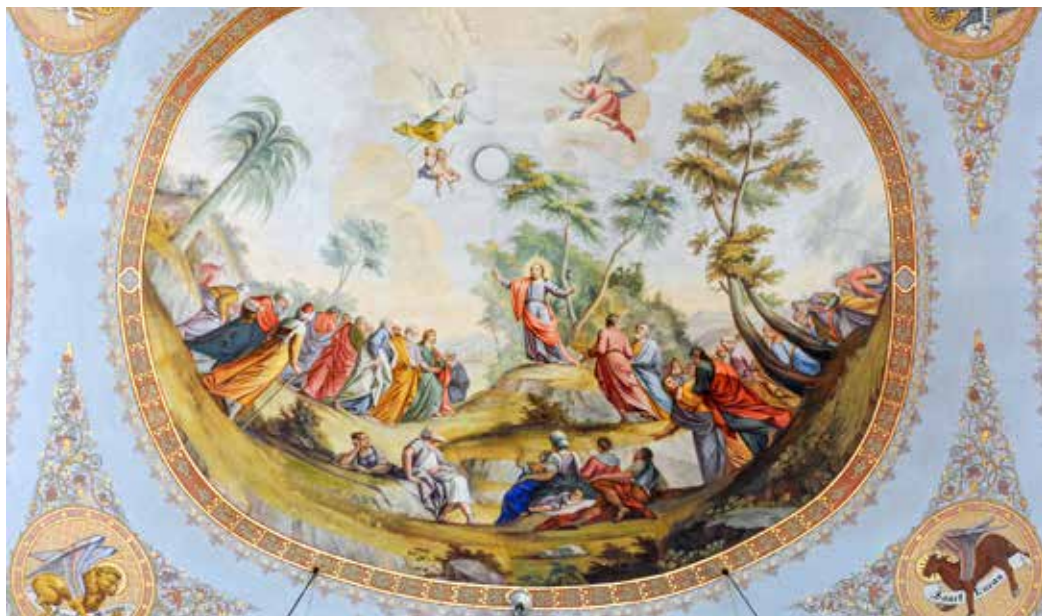
Franz Xaver Kirchebner, Govor na gori , XVIII. st.

primiti vijenac.« A kao poticaj na ustrajnost ističemo i Isusovu riječ iz Lukina Evanđelja: »Blago slugama koje Gospodar, kada dođe, nađe budne.«