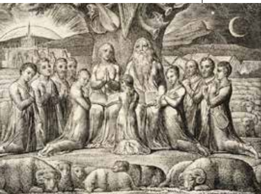
William Blake, Job i njegova obitelj , 1826.

Jednoga dana sve se počelo mijenjati, jer se Jobu počelo oduzimati sve ono što je imao (usp. Job 1,13-22). To se oduzimanje dobara događalo takvom brzinom, da slikoviti opis Knjige o Jobu prikazuje kako glasnici dolaze i javljaju loše vijesti o gubicima, nadovezujući se jedan glasnik na drugoga. Job je izgubio volove, magarice i sluge, ovce i pastire, deve i služinčad i svu svoju djecu u samo jednome danu i najjednom je utonuo u izvanjsku šutnju, jer je svako izvanjsko slavlje zamuknulo. Osim toga izgubio je i zdravlje, te bolestan sjeda u prah i pepeo, žaleći za svime što je izgubio i žalujući nad onime što mu se dogodilo (usp. Job 2,7-10). Živeći u svojoj zemaljskoj stvarnosti, nije on ni slutio za Božji plan i njegove odluke, kao i događaje koji su se zbivali u nebeskim visinama,