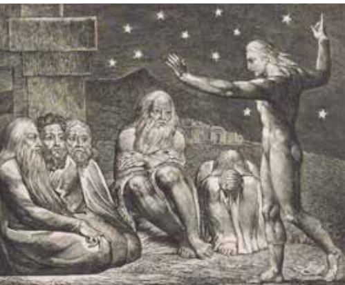
William Blake, Elihuov gnjev , 1826.

Job više ne ulazi u rasprave s ljudima, već traži odgovor od Boga samoga (usp. Job 30,20; 31,35). Kao da se ta njegova unutarnja buka stišava, te nastupa Jobova unutarnja šutnja u potrazi za Božjim odgovorom. Doista, u strukturi Knjige o Jobu on više ne govori, već Elihu preuzima riječ (vidi 4 Elihuova govora u Job 32-37), dok Job šuti. Jobova vanjska i unutarnja šutnja učinile su ga spremnim slušati i čuti Božji odgovor (usp. Job 38,1-42,8). Kada Bog odgovara Jobu, ne otkriva mu sve ono što se događalo na zasjedanju »Božanskoga sabora« u njegove dvije sjednice, gdje se odlučilo staviti Joba na kušnju. Neki Božji planovi i dalje ostaju tajnoviti i skriveni, kako Jobu tako i svima nama smrtnicima, a mi ih zovemo Božja providnost ili Božji promisao (usp. Job 42,3). Bog odgovara Jobu u dva govora i razotkriva mu se u stvorenome redu stvarnosti. Mi ćemo pitati, pa nije li i prije Job čuo taj govor, jer Bog neprestano govori u stvorenjima i preko svojih stvorenja? Da, Bog govori, ali Job nije čuo, jer su izvanjska i unutarnja buka preplavile njegov život. Tek kada je sve izgubio i u prahu i pepelu sjeo na zemlju, tek kada je zašutjela njegova nutrina i kada je prestao tražiti krivnju i odgovornost za svoje stanje i žaliti za prošlim vremenima i događajima, postao je sposoban čuti Božji glas u svemu stvorenome.