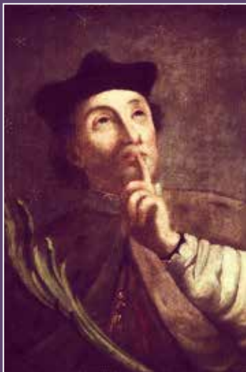
Nepoznati autor, Sveti Ivan Nepomuk, XVIII. / XIX. st.