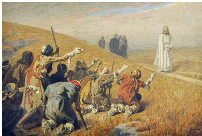
Gebhard Fugel, Isus i gubavci , oko 1920.

Zahvalnost jest nutarnji čovjekov stav gdje pojedinac priznaje da ono što se dogodilo u njegovom životu nije bilo ostvareno vlastitom zaslugom nego mu je bilo darovano, bilo od drugih ljudi ili od Boga. U srcu takvoga čovjeka javlja se stav zahvalnosti kao odgovor na primljeno dobročinstvo. Zahvalnost je općeljudska vrednota ili karakteristika, što u središte stavlja drugu osobu koja je čovjeku učinila određeno dobročinstvo. Biti nezahvalan zapravo znači ne odati priznanje drugome koji mi je pomogao ili mi nešto darovao. Nezahvalnost jest veliko nepoštivanje drugoga čovjeka, jer takav stav uopće ne primjećuje dobro djelo što ga je druga osoba učinila meni. Stoga razumijemo Isusovo pitanje u današnjem Evanđelju: »A gdje su ona devetorica?«. Desetero gubavaca je ozdravilo Isusovim posredovanjem, ali samo je jedan