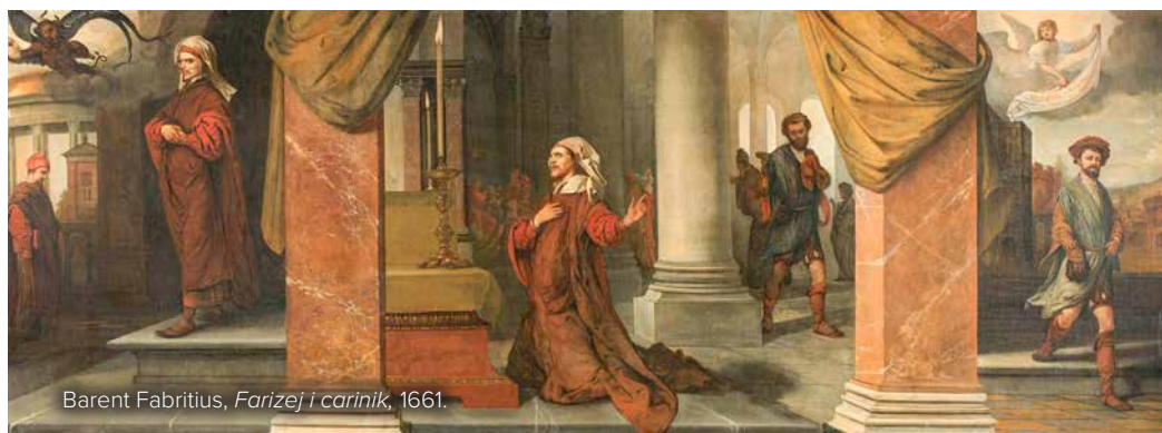
Barent Fabritius, Farizej i carinik , 1661.

nego svatko za sebe. Znamo da nam Biblija predstavlja jeruzalemski hram ne samo kao sveto mjesto Božje prisutnosti na zemlji, nego i kao zajednički dom čitavoga Božjega naroda, koji se u njemu okuplja kao jedna obitelj. Još i više, prorok Izaija govori o hramu kao domu molitve za sve narode ( Iz 56,7 ), a na to podsjeća i sam Isus kada iz hrama izgoni trgovce koji su ga pretvorili u 'pećinu razbojničku' ( Mt 21,13; Mk 11,17 ). Međutim, farizej i carinik ne ponašaju se u hramu kao članovi iste obitelji ni na kakvoj razini. Oni su obojica u istoj kući, ali međusobno ne ostvaruju nikakvo zajedništvo. To dovodi do logične posljedice da tu dvojicu molitelja ni ne promatramo kao ljude koji su se susreli da zajedno slave Boga, nego ih uspoređujemo i ocjenjujemo njihove molitve, koja je bolja, a koja gora.