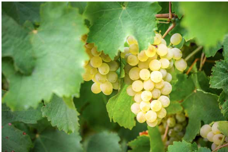
Od Božje snage grozdovi zriju

da proniče jednodušnost i da doprinosi većoj svečanosti. To je okvir u kojem bi se trebala razvijati sva liturgijska glazba. Shvatilo se da ono što se pjeva u misi treba biti tekstualno i glazbeno u skladu s činom u kojem se pjeva. Dakle, darovna pjesma morala bi biti u skladu s činom koji se odvija, a to je žrtvovanje i prinošenje darova, ali može se ta tema i malo šire shvatiti što ćemo vidjeti u predloženim darovnim molitvama iz Misala. Kod nas i u svijetu nakon Sabora stare darovne pjesme iz gregorijanske baštine zamjenjuju tekstovi pučkih pjesama na tu temu, kao što su: Darove ove stavljamo pred tebe... , Darove prinesite... , Od Božje snage grozdovi zriju... , Jedan kruh na svetom stolu... , Gospodine primi darove puka... itd.