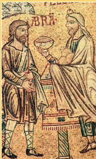
Nepoznati autor, Abraham susreće Melkisedeka , Mozaik u bazilici Svetog Marka, XIII. st.