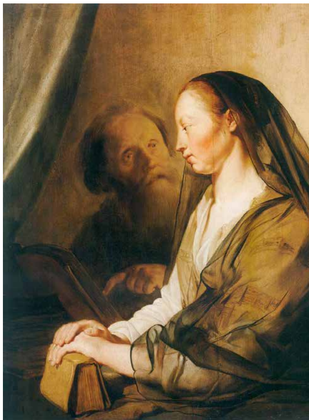
Frans Pietersz de Grebber, Parabola o nepravdom sucu , 1628.

(gr. theopneustos ), odnosno napisana pod djelovanjem Duha Svetoga. Duhom kojim je nadahnuto, Pismo je i korisno za formaciju i rast u vjeri, što je i opisano kroz četiri imenice: izvor je nauka (gr. didaskalia ), uvjeravanja (gr. elegmon ), popravljanja (gr. epanorthōsis ) i koristi za odgajanje (gr. paideia ). Od ove četiri uloge Pisma, samo je nauka povezana s intelektom, dok su ostale tri praktične naravi. Posljednja, odnosno odgojna uloga Pisma uključuje i pravednost (gr. dikaiosyne ). Autentična nadahnuta Božja riječ iskazuje svoju funkcionalnost u vođenju i podržavanju kršćanskog djelovanja skladnog Božjoj volji, odnosno pravdi. Sve četiri uloge teže jednom cilju: da čovjek Božji, onaj koji je odgovoran za kršćansku zajednicu, bude primjer i uzor svim kršćanima.