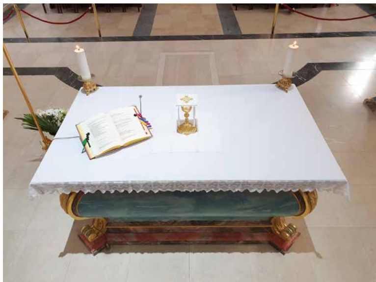
Od stolića s darovima na oltar se donosi Rimski misal sa stalkom, korporal, kalež, purifikatorij i pala

( Živo vrelo 11/2017), no dobro je i držanje trenutaka tišine u prinosu darova. »Tišina nije puko čekanje dok se nešto izvana ne učini, već nutarnji proces koji odgovara vanjskom zbivanju – pripremanje nas samih za dar. Zajednička šutnja time je i zajednička molitva i zajedničko djelovanje. Tišina je kretanje s mjesta naše svakodnevice prema Gospodinu, ulazak u istodobnost s njime. Bogu koji govori, odgovaramo pjevanjem i molitvom, ali veća tajna – koja nadilazi sve riječi – poziva nas na šutnju.« (Benedikt XVI., Duh liturgije , Split, 2015.).