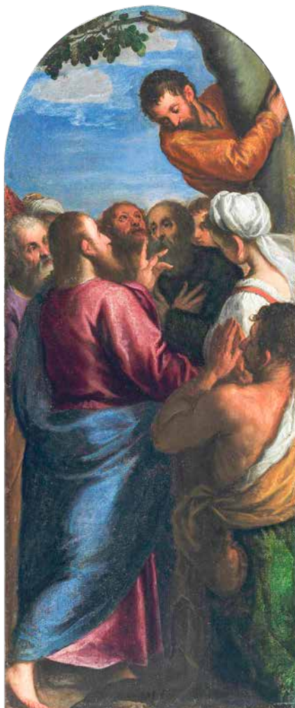
Jacopo Palma, Krist se obraća Zakeju , 1653.

Kao što je učinio Zakej, svatko od nas je pozvan liječiti pogled svoga srca Isusovim pogledom, te tako otkriti Boga koji skrbi o našem spasenju i čeka da se vratimo u njegovu očinsku kuću. Upravo to se je dogodilo Zakeju kad je Isus ušao u njegovu kuću. Po Isusovu