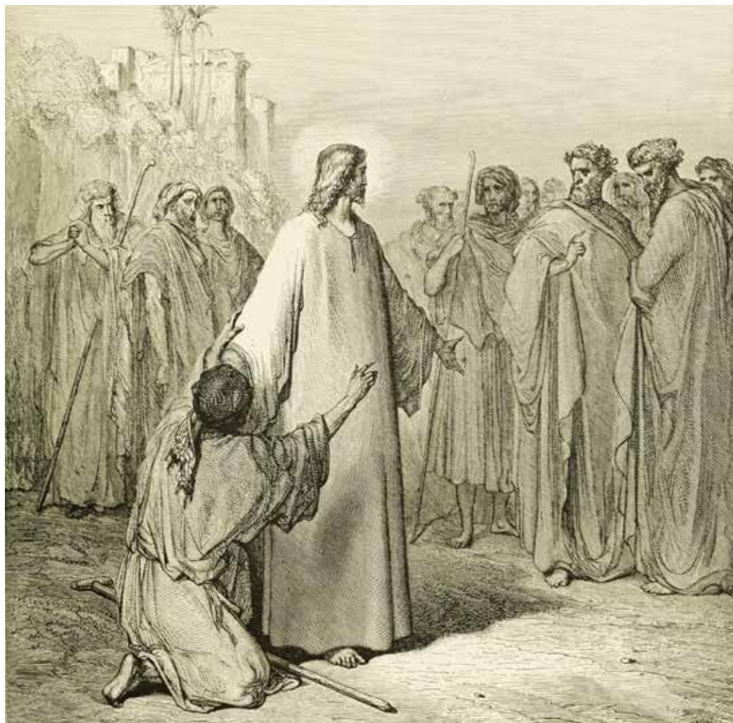
Gustave Dore, Isus ozdravlja opsjednutoga , 1880.

U tom slučaju, moje srce može biti nalik jednome mjestu u kojemu ne vlada uvijek sklad, mjestu u kojemu se događaju trgovanja (moralom, odnosima, emocijama...), mjestu u kojemu se ne snalazimo dobro i u kojemu je teško pronaći radost i disati punim plućima. Međutim, Gospodin ne želi biti prisutan samo u Jeruzalemu moga života. On želi biti prisutan i u Kafarnumu tog istog života. Želi dotaknuti ono kaotično, bojažljivo, nestalno – ne kako bi uništio i amputirao – nego kako bi ozdravio i pokazao svakomu od nas ljepotu i vrijednost vlastitog života koju možemo