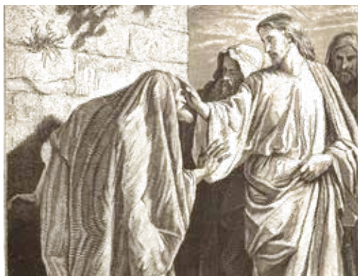
Alexandre Bida, Isus liječi gubavca , 1875.

Gubavac iz evanđelja napokon, nakon tko zna koliko teškoća, došao je k Isusu i bacio mu se pred noge. Nije koristio mnoge riječi, nije objašnjavao svoju bolest, samo je jednostavno, ali vjerno rekao: »Ako hoćeš, možeš me izliječiti!« Gubavac ne sumnja da ga Isus može iscijeliti; ali ne zna želi li to učiniti. Uostalom, što bi jadni gubavac mogao znati o volji tog mladog proroka? Ako ništa drugo, njegovo nepovjerenje prema drugima potvrđeno je nepovjerenjem koje su