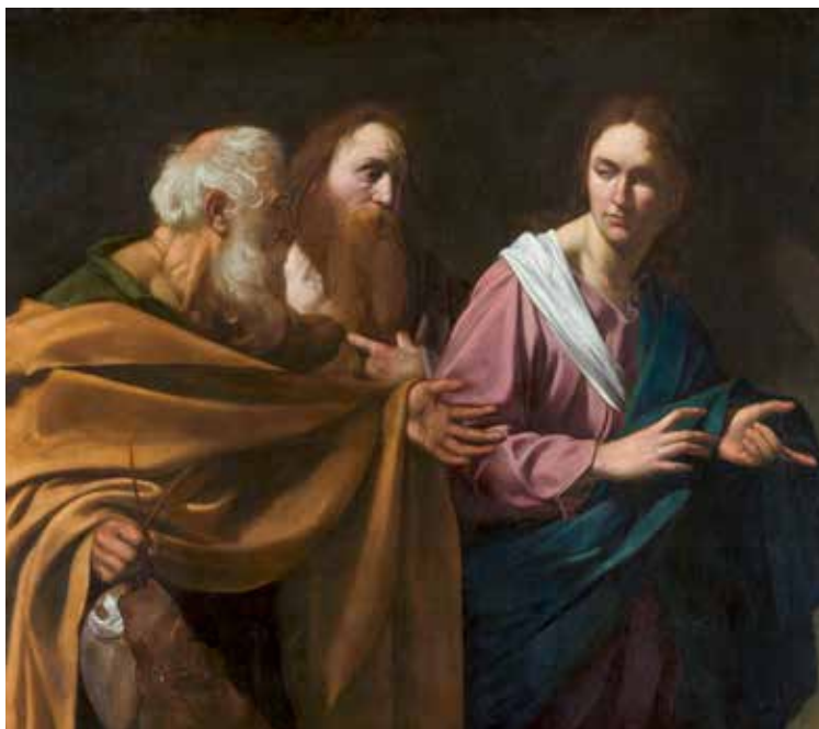
Michelangelo Merisi da Caravaggio, Poziv sv. Petra i Andrije , 1602.

Poziv na obraćenje i poziv prvih apostola, kako čitamo u današnjem evanđelju, sretan