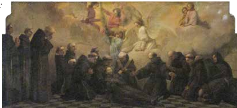
Kowalewski Otto, Transitus Sancti Francisci (Preminuće sv. Franje), 1914.

Etape odgoja kandidata ili kandidatice za redovnički život postupno uvode u prihvaćanje novog načina života usklađeno Pravilom i Konstitucijama Reda ili Družbe. Evanđeoski poziv na obraćenje, redovnica/redovnik živi u svakodnevnom preispitivanju vlastitog poziva i odgovora na svetost. Odgojne etape intenzivno pripremaju kandidata ili kandidatice da usvoje neprestalno preispitivanje vjernosti pozivu, ali istovremeno odbacivanje svega onoga što nije u skladu redovničkim načinu života. Postulatura, novicijat i postnovicijat temeljne su etape redovničkog odgoja koje oblikuju cjeloživotni način života jednog redovnika ili redovnice. ■