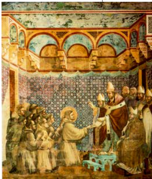
Giotto di Bondone, Rasprava o siromaštvu , 1295.

Pred kraj postulature odgojitelj u razgovoru s postulantom provjerava njegov napredak na putu zvanja te, saslušavši svoje suradnike i razmatrajući prethodne preporuke, šalje svoje pismeno izvješće i mišljenje o primanju postulanata provincijalnom ministru/kustosu koji je odgovoran, uz dopuštenje svoga definitorija, primiti kandidata u novicijat. U izvješću odgojitelja sljedeće su točke koje se moraju zadovoljiti u odgojnoj etapi postulanata: a) molitveni i sakramentalni život; b) spremnost za nasljedovanje Krista u siromaštvu, poslušnosti i čistoći; c) osjećaj pripadnosti Crkvi i Redu; d) psihofizičko-afektivna ravnoteža potvrđena cjelovitim načinom života; e) sposobnost za život u zajednici;