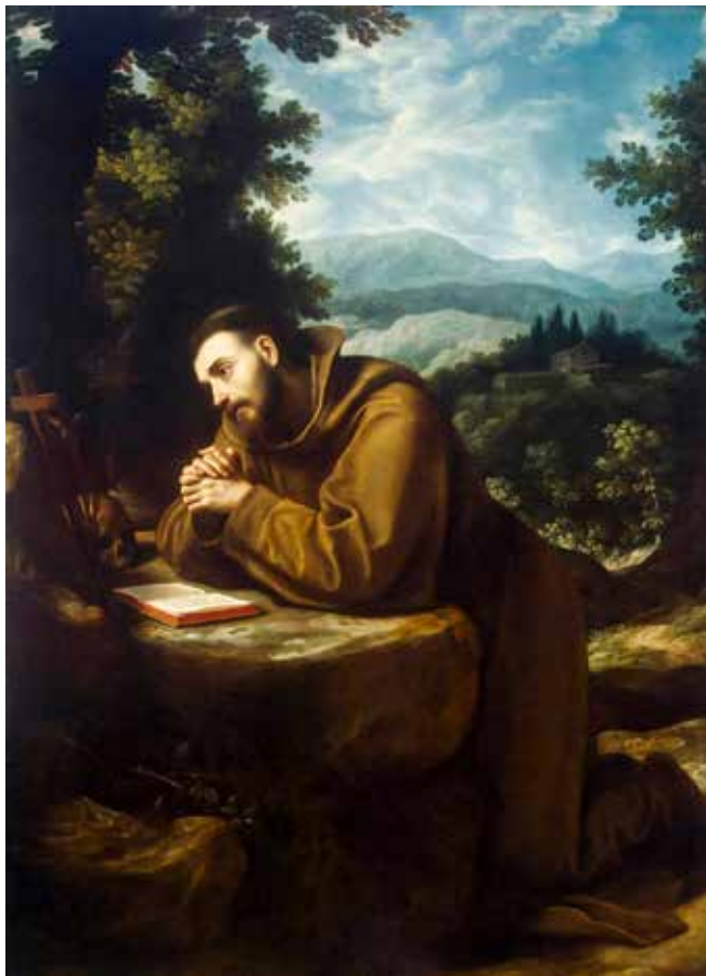
Lodovico Cardi, Sv. Franjo Asiški, 1597.–1599.

Promatrajući svetog Franju u njegovoj malenosti koji je i nakon obraćenja nastavio produbljevati svoj odnos ljubavi s Gospodinom Isusom, sve bolje i više otkrivajući kakav treba biti njegov osobni odgovor na darovani poziv. Počeo je služiti gubavcima i siromasima; darom prve braće, zajedno s njima tražio je Božju volju za novonastalo bratstvo; s njima je navješćivao Evanđelje. Isto tako, produbljeni studij povezan s razdobljem privremenih zavjeta odvija se na različitim razinama: ljudsko-duhovnoj, relacijsko-kulturološkoj, teološko-ministerijalnoj.