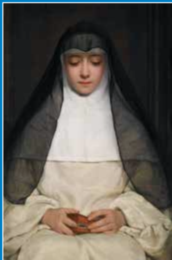
Henriette Browne, Redovnica , 1859.