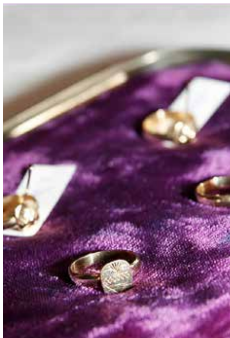
Prsten je snažan simbol koji ovdje označuje da je novozavjetovana redovnica sada Kristova zaručnica.

i proslavljena Crkva. Svete se kao izvrsne primjere moli još da onima koji se zavjetuju budu stalno na pomoći. I sami se zavjetovanici tako potiču da na primjerima svetih svoj život također trajno posvećuju Bogu. Poslije litanija svi ustanu, a oni koji se zavjetuju pristupaju jedan po jedan poglavaru i čitaju obrazac zavjetovanja. Rubrike napominju da je dobro da ga (obrazac) sami vlastoručno prije napišu , što je (koliko nam je poznato) redovita praksa u redovima i družbama.