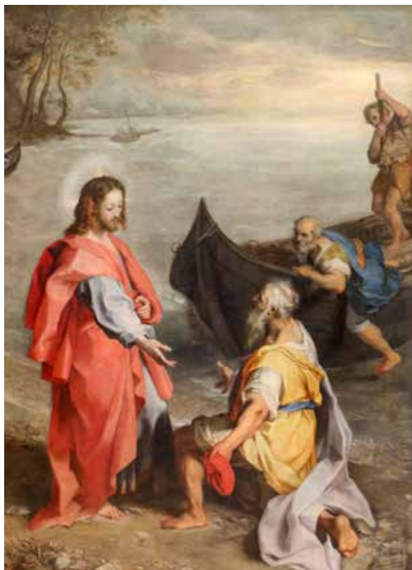
Federico Barocci, Poziv sv. Petra i Andrije , 1586.

Naime, otkriće Krista i osobno iskustvo susreta s Bogom uvijek je pokretač novih traganja za još dubljim odnosom s njima. Stoga u našoj vjerničkoj praksi neće biti dobro ako se zadovoljavamo s onim što smo o Bogu saznali, otkrili ili pak iskusili, nego će nam sve to biti podstreh za daljnji život u vjeri i još snažnije traganje za Bogom.