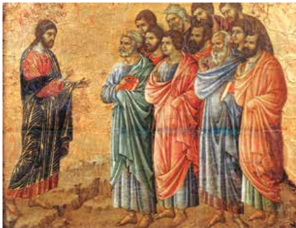
Duccio di Buoninsegna, Ukazanje na planini u Galileji , 1308.-1309.

Zavjet poslušnosti najvidljivije se pokazuje u poslušnosti poglavaru ili poglavarici, ali ima svoj dublji teološki temelj i obuhvatniji obzor. On proizlazi iz osluškivanja Boga i poslušnosti njemu. Poslušnost se u biti sastoji u radikalnom davanju prednosti Bogu u vođenju vlastita života, u njegovu planiranju i određivanju njegovih ciljeva. Onaj tko je poslušao Božji poziv prihvatio je Božji plan za sebe. U