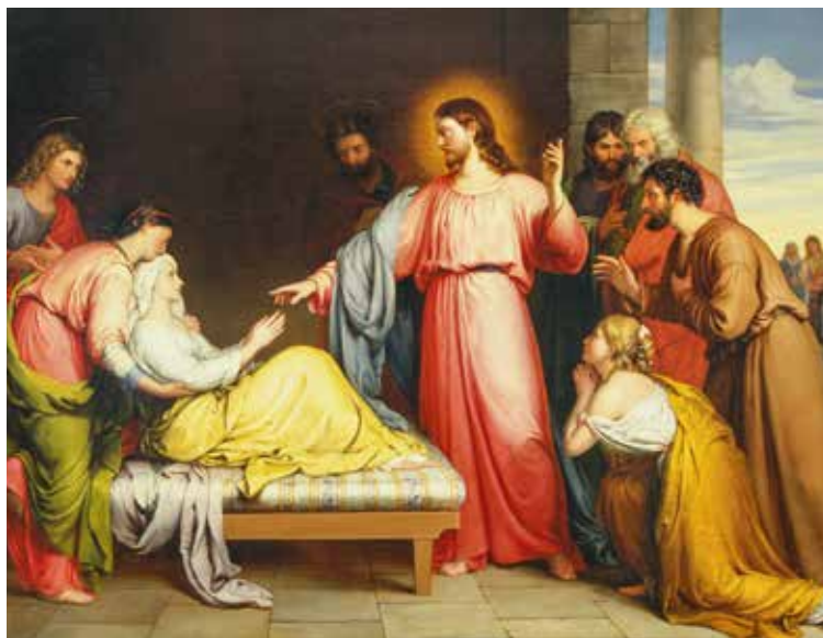
John Bridges, Ozdravljenje Petrove punice , 1839.