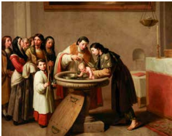
Zacarías González Velázquez, Krštenje sv. Franje, 1787.

I u obrednom i u pravnom smislu zavjeti su dakle javna odluka kršćanina o potpunom predanju milosti Božjoj, koja ga/ju je i potakla produbiti milost krštenja, te na život u redovništvu i u spomenutom služenju. Redovničko zavjetovanje redovito se obavlja u misi. Sastoji