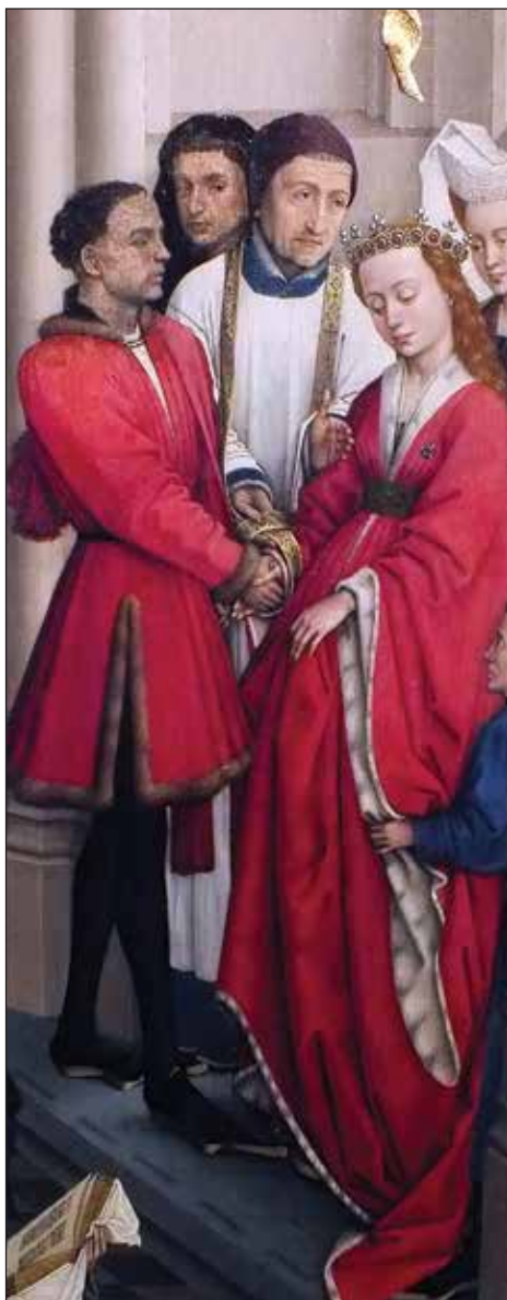
Rogier van der Weyden, Sakrament ženidbe, 1445.

Kada je vjenčanje pod misom, svećenik može dočekati mladence na ulazu u crkvu ili pred oltarom, a obred prijema se može i ispustiti i odmah početi s misom. Ukoliko to rubrike traže, govori se Slava, a ako ne, misa se nastavlja zbornom molitvom. Slavlje ženidbe u užem smislu započinje nakon homilije. Svećenik pozove mladence da odgovore na pitanja koja se odnose na slobodu, nerazrješivost i