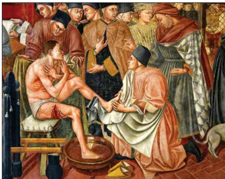
Domenico di Bartolo, Liječenje bolesnika , 1440.-1441.

biti zauvijek isključen i vidjeti da tvoje mjesto zauzimaju drugi.