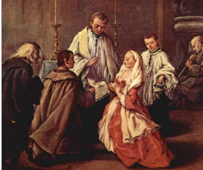
Pietro Longhi, Kršćanski brak, 1755.-1757.