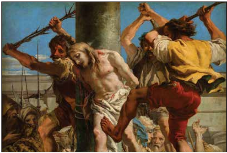
Giandomenico Tiepolo, Bičevanje Krista , 1772.

bili autentični ljudi. Koji je to autentični Sin Čovječji? „Trebalo da Sin Čovječji mnogo pretrpi, da ga starješine, glavari svećenički i pismoznanci odbace, da bude ubijen i treći dan da uskrsne“. Bio je okružen onima koji nisu bili ljudi, okružen zvijerima i egoistima. Pravi čovjek će trpjeti mnogo, kao što janje trpi među vukovima. Naišao je na otpor, neprihvatanje pismoznanaca, staraca, sinedrija, aristokracije, službenih naučitelja vjere. Trpio je od moćnih ovoga svijeta.