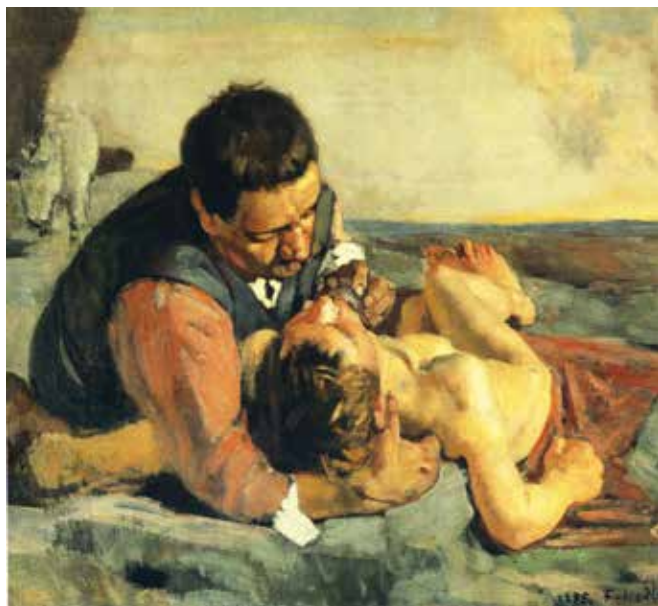
Ferdinand Hodler, Milosrdni Samarijanac , 1975.

međuetničkih odnosa Židova i Samarijanca (nažalost i danas su međuetnički odnosi mnogima kamen spoticanja!) izbor likova u usporedbi još više zaokuplja pažnju slušatelja. Isus je jezgrovit, kratak i jasan. Uopće ne ulazi u motive nijednoga od likova koji nakon što je čovjek neki , opljačkan i ostavljen polumrtav, prolaze onim putem. Motivi za svećenika i levita možda mogu biti s nekoga stajališta i opravdani, strah od daljnjih napada, obredna čistoća itd. Nije izrečen ni Samarijančev motiv zbog čega je stao. Jednostavno se kaže da staje i pomaže.