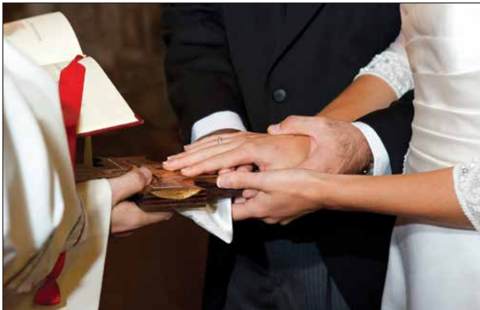
Prisega na znamenju svetoga križa.

Godine 1991. godine pojavilo se novo tipsko izdanje reda sklapanja ženidbe, a hrvatski prijevod je objavljen 1997. godine. Osim za Rimski kanon, u ovom izdanju nude se još umetci za drugu i treću euharistijsku molitvu. Izričito se kaže da se ženidbeni dokumenti potpisuju na koncu mise u sakristiji ili pred narodom, ali ne na oltaru. Nažalost, u drugom hrvatskom izdanju nema više mogućnosti da se privola potvrdi prisegom. Obred vjenčanja izvan mise identičan je onome u misi.