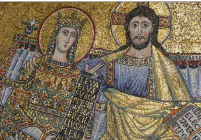
Mozaik u kaloti apsida crkve Svete Marije u Trasteveru (Rim), XII. st.

Kršćanski supružnici uvijek trebaju imati na umu da su oni sakrament, da oni nemaju ulogu predstavljanja samih sebe ili ulogu koju im namjenjuje »paklena ljubav« ovoga svijeta. Kršćanski supružnici trebaju igrati takoreći mističnu igru, »igrati ulogu« predstavljanja Krista i Crkve.