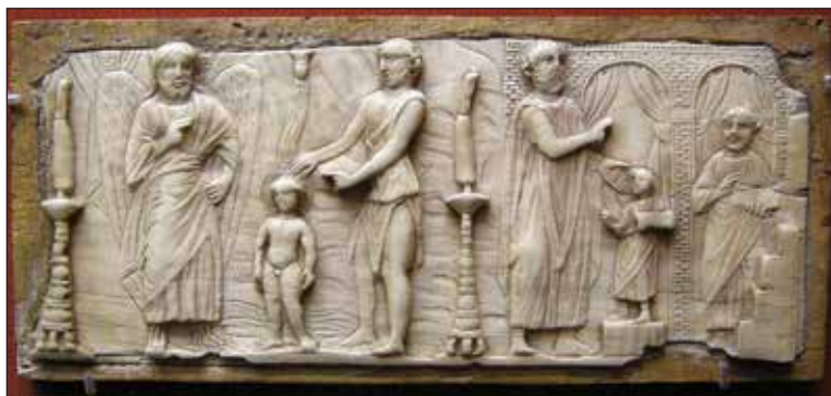
Reljef s prikazom slavlja krštenja i slavlja potvrde, V. st.

U prvim kršćanskim vremenima nakon krštenja slijedi odmah gesta polaganja ruku i zaziv Duha Svetoga što odgovara sakramentu potvrde. Kasnije se potvrda podjeljuje kao zasebni sakrament s polaganjem ruku kao činom podjeljivanja dara Duha Svetoga i mazanjem ulja po čelu. Time krštena osoba postaje potpuni član Crkve i ulazi u službu crkvenog poslanja i navještaja vjere svojim životom, riječima i djelima.