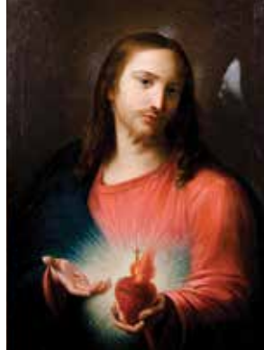
Girolamo Batoni, Presveto Srce Isusovo, 1767.