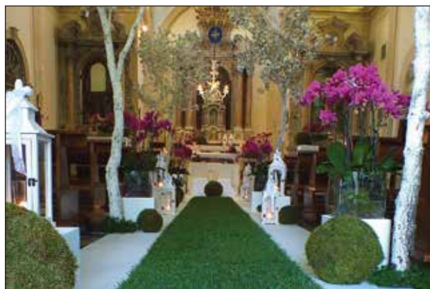
Primjer nesnalaženja u liturgijskoj komunikaciji urešavanjem kojim se narušava dostojanstvo liturgijskog prostora.

Obrednik donosi i Red slavljenja ženidbe između katoličke strane i katekumenske ili nekršćanske strane. U uvodnim se didaskalijama ispušta dio koji govori o prethodnoj krsnoj milosti. Samo sklapanje ženidbe ne razlikuje se od prethodnih obreda. Uzima se treća molitva ženidbenog blagoslova, ali s nekim preinakama. Tako na primjer, umjesto »sakramentom ženidbe« stoji »ženidbenim savezom«, a umjesto »neka obitelj ukrase djecom, obogate Crkvu«, kaže se »resio ih neporočan život i prokušane roditeljske vrline«.