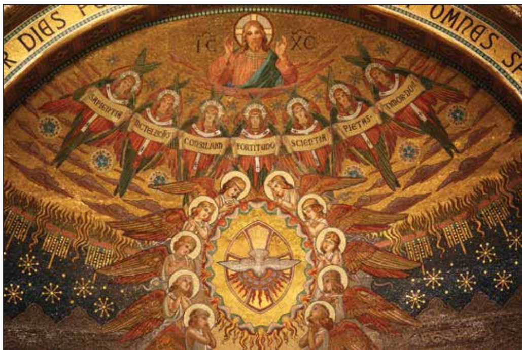
Mozaik s prikazom darova Duha Svetoga u kaloti bazilike Gospe od krunice u Lourdu.

i važnost sakramenta jer se obitelji kandidata za potvrdu najčešće bave drugim i sporednim pitanjima kao što su obiteljska proslava, kumstvo i sl. Nadalje, nakon krizme vjernici se udaljuju od Crkve, rjeđe pohađaju nedjeljnu euharistiju i ne pristupaju sakramentima (usp. Direktorij , br. 6o.). Činjenice koje navodi Direktorij pokazatelj su stvarnosti u kojoj velik broj vjernika živi površno vjeru i primaju sakramente tradicionalno. Sakramentalna djelotvornost ne zahvaća u potpunosti njihov život niti vjernici prepoznaju važnost slavlja za izgradnju vlastitog kršćanskog identiteta.