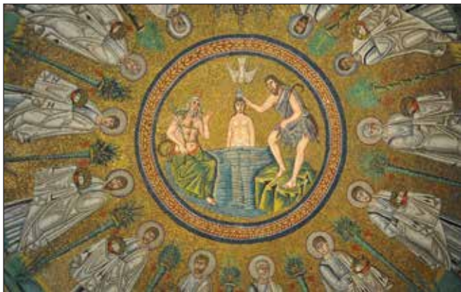
Krštenje Kristovo , mozaik u kupoli arijanske krstionice u Raveni, VI. st.

Nekoliko je dodatnih elemenata koje Direktorij ističe kao važne u organiziranju slavlja i koji mogu kandidate bolje uvesti u značenje i simboliku sakramenta potvrde. Predlaže izbjegavati duge uvodne pozdrave, suvišne govore, neprikladne i neukusne geste, simbole i sl. Izbor pjesama trebao bi biti takav da cijela zajednica bude uključena u slavlje, pjesme predviđene za sakrament potvrde i usklađene s biblijskim tekstovima. Navještaj Božje Riječi također je važno dobro pripremiti i izbjeći svaku improvizaciju. Najprikladnije osobe za navještaj su one koje već obavljaju tu službu u zajednici, a mogu se uključiti i predstavnici roditelja, kateheta i kumova. Poseban naglasak se stavlja na Božju riječ: iz slušanja Božje riječi mnogostruko djelovanje Duha Svetoga prožima Crkvu i svakog krštenika i potvrđenika. Budući da je Božja riječ upućena kandidatima, trebali bi je navijestiti drugi vjernici, a ne sami kandidati. Ispravno je da prisutna zajednica u šutnji i molitvi prati obred podjele svete potvrde i da se čuje glas biskupa ili djelatnika koji izgovara formulu sakramenta. Nije preporučljivo liturgijsko pjevanje za vrijeme podjele jer pjesma je liturgijski čin, a ne ukras obreda ili pratnja podjele krizme. Na kraju, prinosnu procesiju treba osmisliti odmjereno i u skladu s ozbiljnošću, preporuča se obred popratiti prinošenjem darova za siromahe ili potrebne, bez suvišnih i nepotrebnih simbola (usp. Direktorij , br. 74-78.).